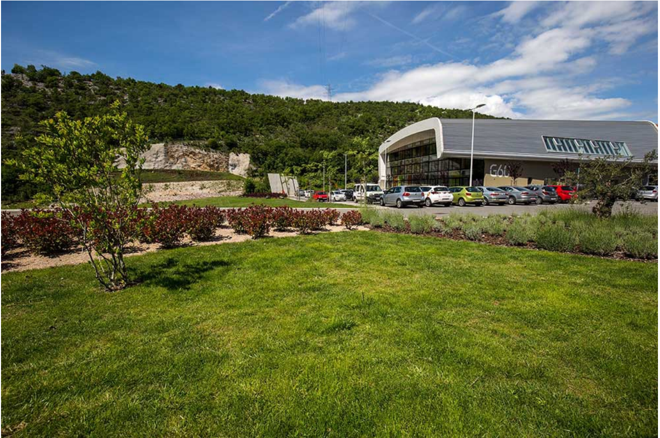
Slika 4: Izvedeni radovi na lokaciji Jadran Galenskog Laboratorija, Rijeka