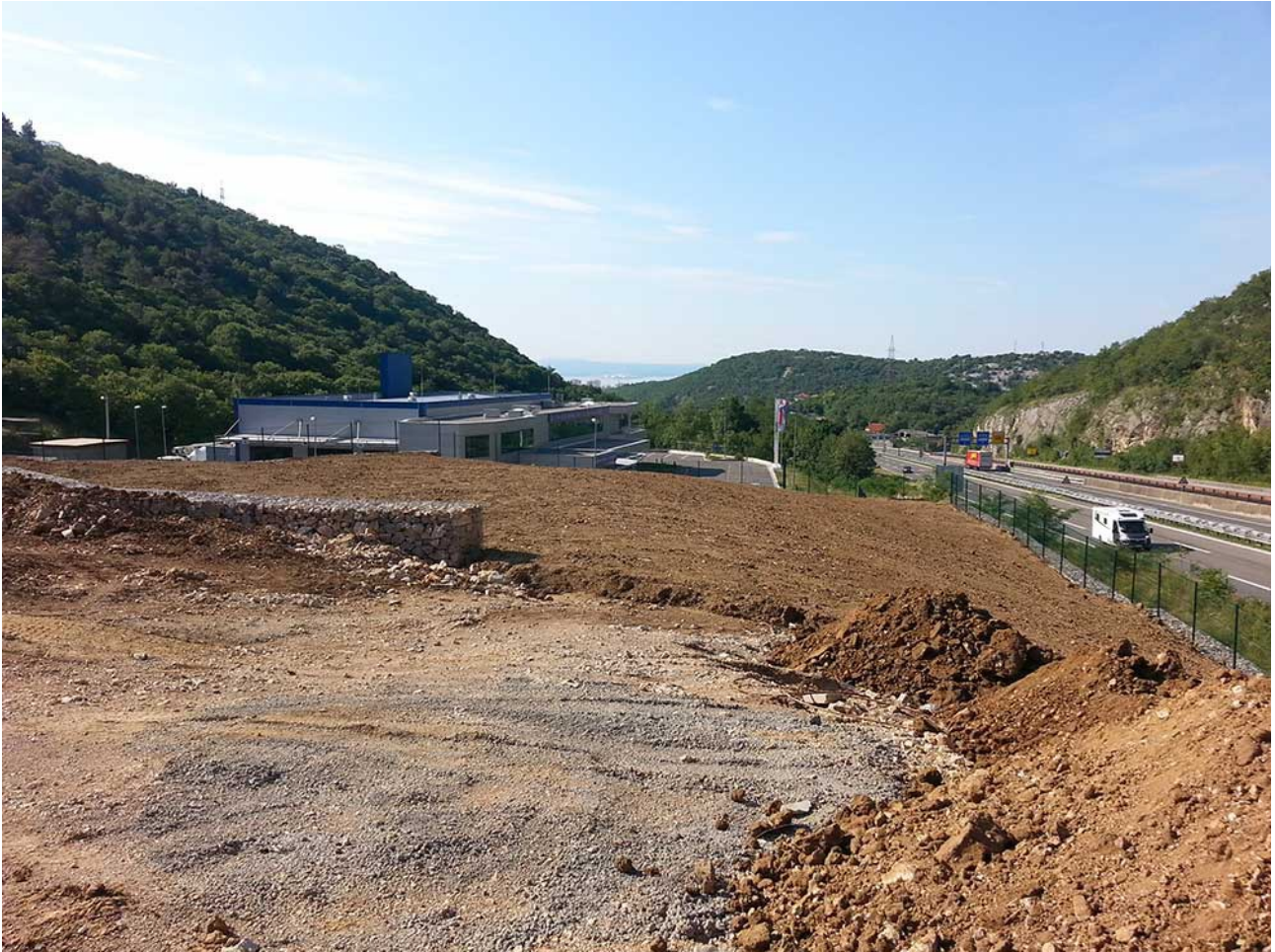
Slika 6: Građevinski radovi na lokaciji Jadran Galenskog Laboratorija, Rijeka