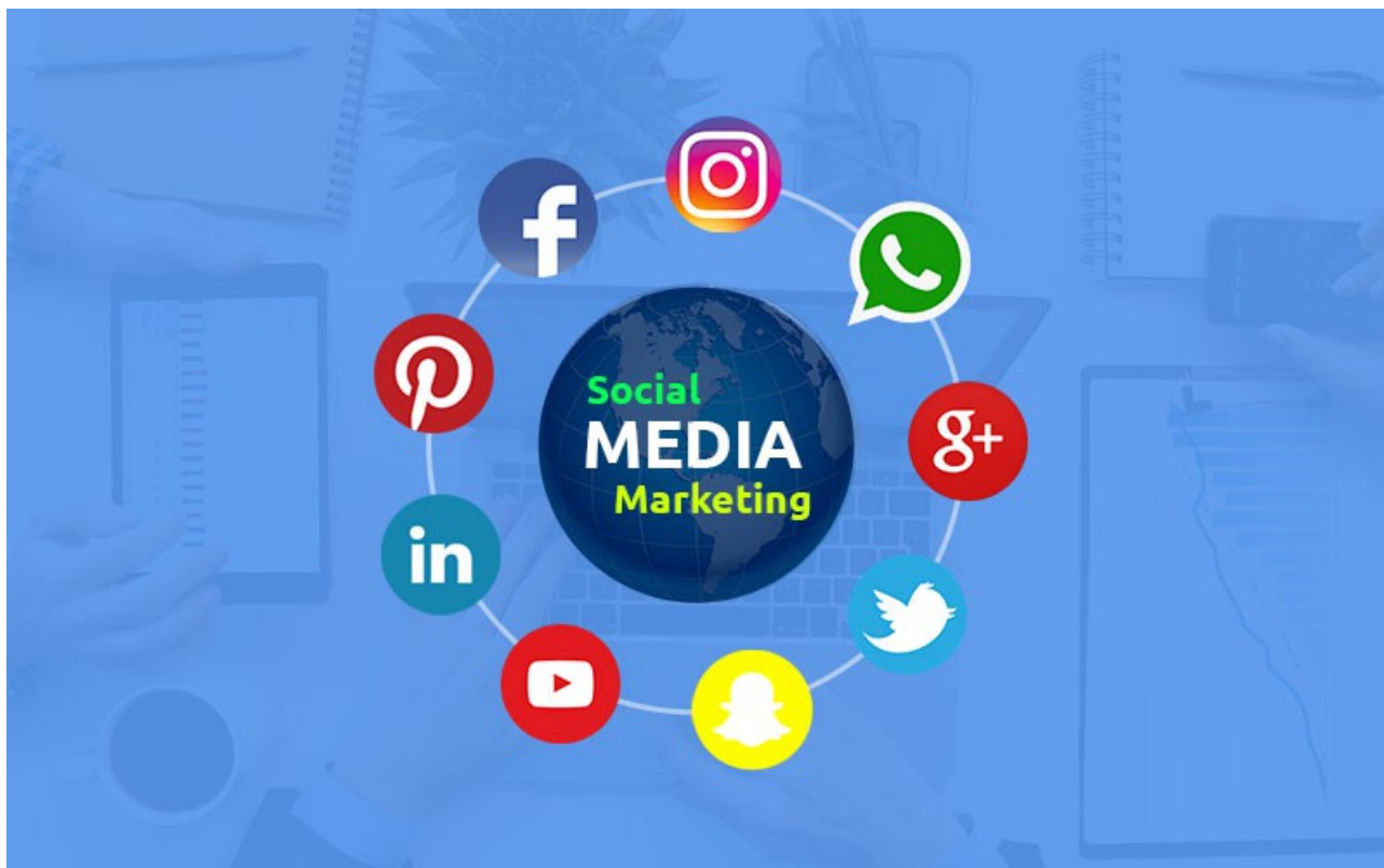
Slika 9: Logotipovi najpopularnijih društvenih mreža

Ono što je bitno za naglasiti, navedene društvene mreže su besplatne, a na njima postoji mogućnost plaćenih, ciljanih oglasa. Dobar profil, redovito ažuriran slikama i informacijama, kao i redovita komunikacija sa potencijalnim klijentima širi bazu uz minimalni vremenski i finansijski input. Mogućnost povratne informacije je velika, a ista je brza.