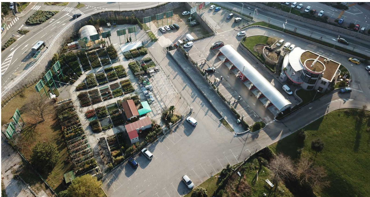
Slika 7: Rasadnik, poslovna zgrada, autopraonica Pitstop i reklamni panoi, Osječka 67b, Rijeka

Politika tvrtke temelji se na suradnji s vrhunskim uzgajivačima bilja s dugogodišnjom tradicijom, stranim i domaćim, baziranim na povjerenju i kvaliteti. Ustaljena suradnja s povjerenjem omogućuje izdavanje garancije za proizvode, u slučajevima kada vrtka izvodi sadnju i održavanje biljnog materijala.