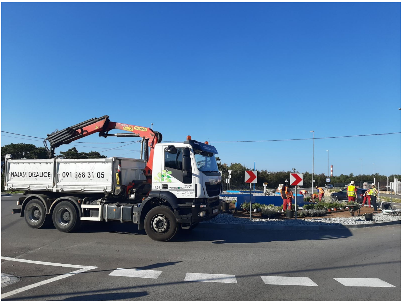
Slika 5: Izvođenje radova na rotoru Šoići, Kostrena, 2020.

Odjel hortikulture čini tzv. „core business” tvrtke i zapošljava preko polovicu radnika tvrtke. Na čelu sektora je voditelj hortikulture sa pomoćnicom. U sklopu sektora djeluju i krajobrazna arhitektica te pod odjel navodnjavanja i rasvjete. Organizacijski je odjel podijeljena na četiri tzv. „brigade” od 4 do 7 radnika na čelu kojih su predradnici.