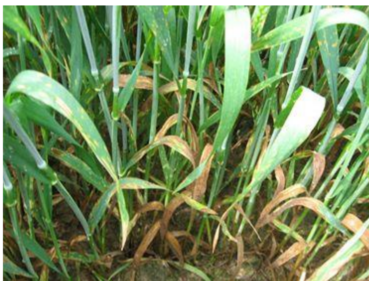
Slika 21. Septoria tritici u usjevu (Izvor: Gojević 2020.)