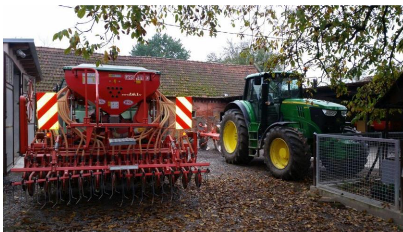
Slika 1. Dio mehanizacije na OPG-u