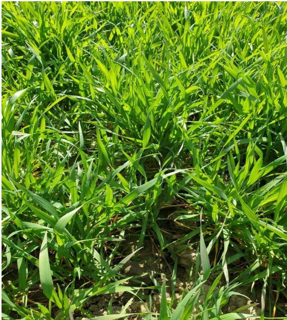
Slika 2. Pšenica u početku vlatanja

Pšenica je, iza kukuruza, druga kultura po zastupljenosti u Republici Hrvatskoj i stoga s opravdanjem nosi titulu najvažnije žitarice ovog OPG-a (Slika 3.). Smatra se najznačajnijim ratarskim usjevom te zauzima \frac{1}{4} obradivih površina u svijetu. Najpoznatiji pšenični proizvod svakako je pšenični kruh kojim se hrani oko 70% stanovništva. Osnovni sastav pšeničnog kruha čine ugljikohidrati, ponajviše škrob te je lako probavljiv. Najveći utjecaj na njegovu kvalitetu ima lijepak koji u svome sastavu sadrži određene bjelančevine, a njegova glavna karakteristika je elastičnost, bubrenje i čvrstoća. Izuzev proizvodnje kruha, pšenica se koristi i u drugim industrijama, kao što su pivovare, farmaceutske industrije, prehrambene industrije i sl.