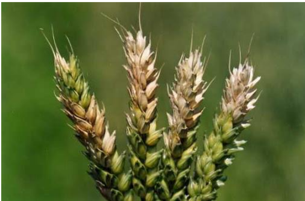
Slika 9. Palež klasa