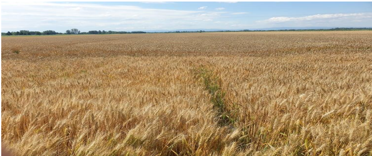
Slika 3. Pšenica u zriobi

Što se tiče odnosa prema vodi najkritičnija faza je vlatanje. Nedostatak vode u toj fazi razvoja pšenice negativno se odražava na visinu prinosa jer dolazi do manjeg broja cvjetova i manjeg broja zrna. Pšenici najbolje odgovaraju plodna, duboka i umjereno vlažna tla ( https://nsseme.com/aktuelno/saveti-strucnjaka/vlatanje-kriticna-faza-u-razvoju-strnih-zita/ )