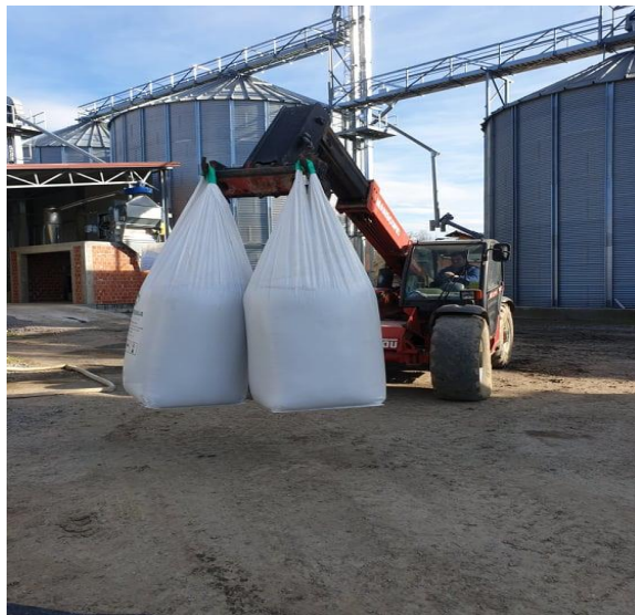
Slika 14. Gnojivo