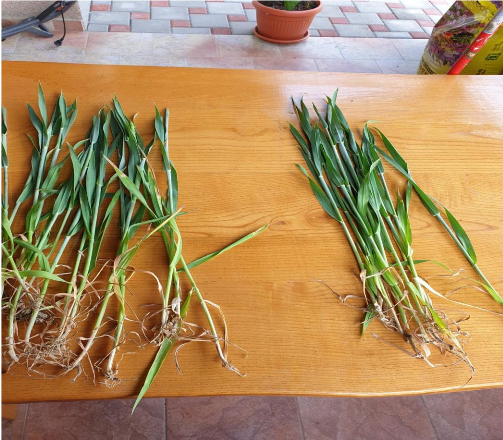
Slika 23. Pšenica sa netretiranog i tretiranog dijela table