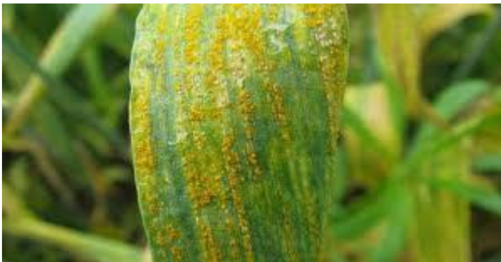
Slika 7. Žuta hrđa