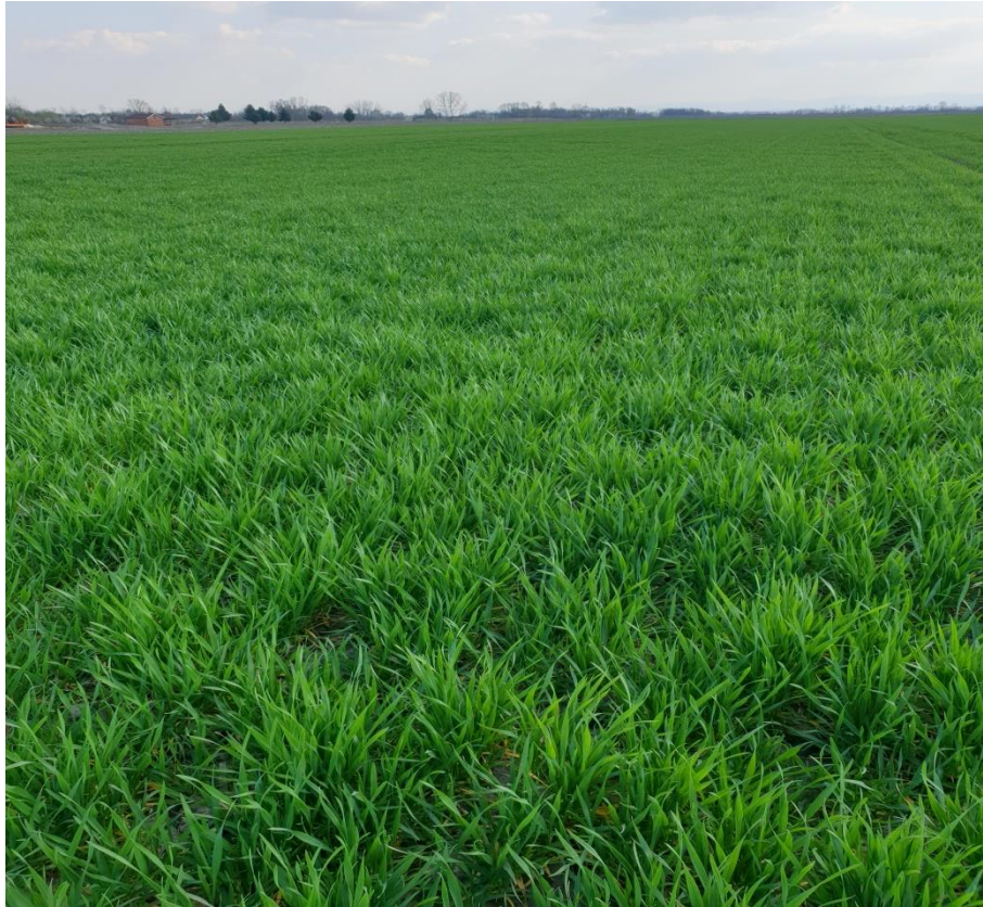
Slika 12. Tabla „Bašća Rus“