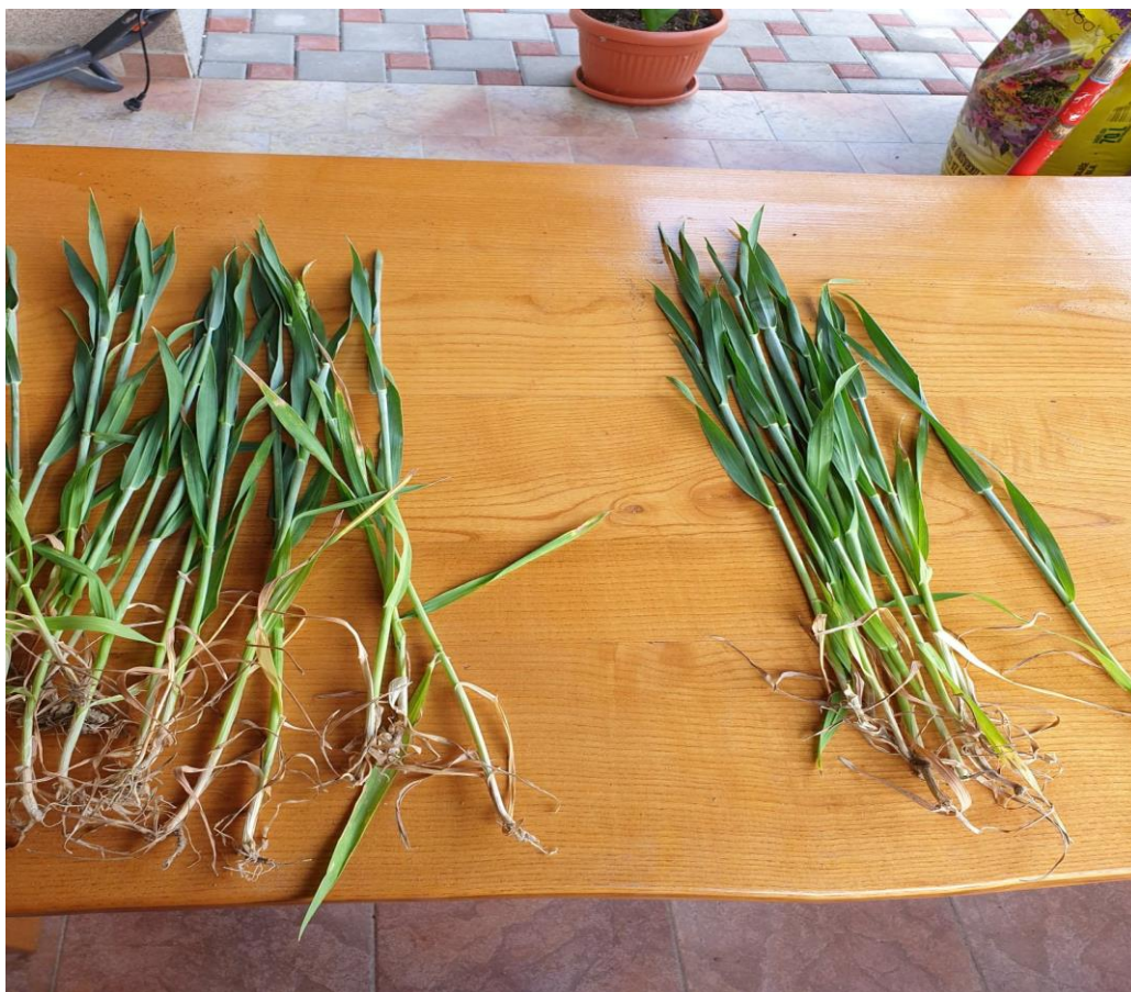
Slika 23. Pšenica sa netretiranog i tretiranog dijela table