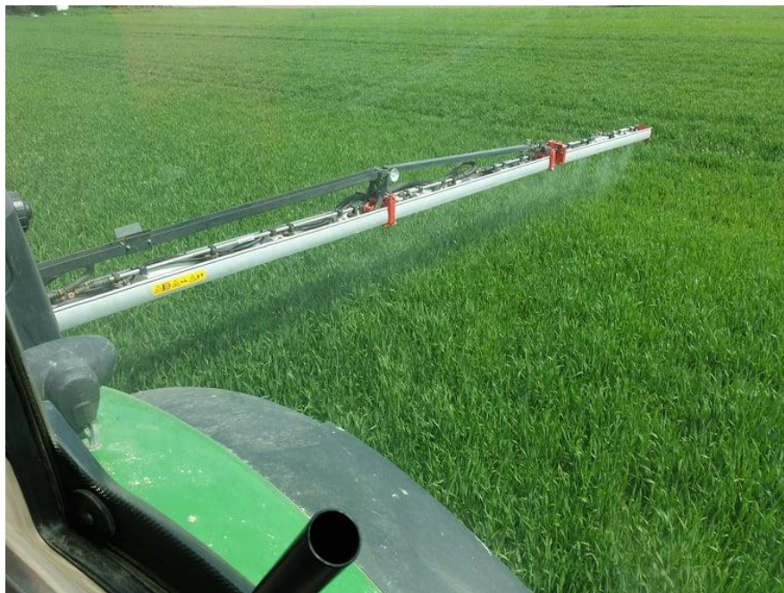
Slika 17. Prskalica u pogonu