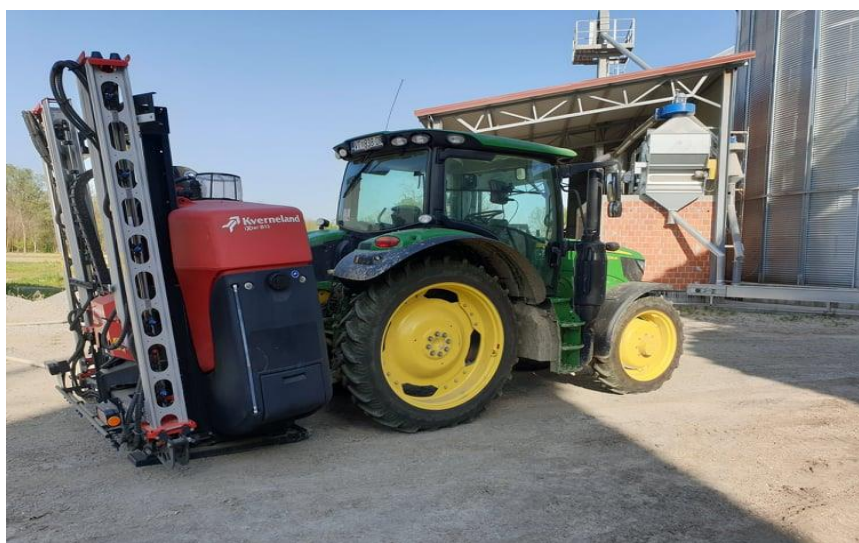
Slika 15. Traktor i prskalica

Za zaštitu pšenice od bolesti korišteni su fungicidi Priaxor EC , Elatus Era i Magnello. Mehanizam djelovanja navedenih fungicida prikazan je u Tablici 5. Na slikama 16,17,18, prikazana je zaštita pšenice s fungicidom. Za zaštitu lista pšenice se koristio Priaxor EC (prvo prskanje). Drugo prskanje je obavljeno s Elatus Era.