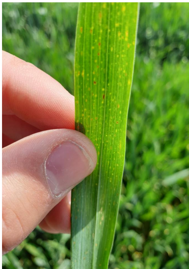
Slika 22. Puccinia recondita na listu pšenice

Obilaskom polja 5. svibnja utvrđena je smeđa hrđa pšenice. Vremenske prilike pogodovale su razvoju ove bolesti. Puccinia recondita se može razviti u velikom rasponu temperatura. Bolest se prvo pojavila na netretiranom dijelu table u slabijem intezitetu (Slika 23.), te je kasnije zahvatila i tretirani dio. Postotak zaraženih biljaka iznosio je 5 %. Prema OEPP/EPPO (2012.) skali (koristili smo skalu za žutu hrđu) postotak zaraze vidljive na listu bio je u prosjeku 5 % na netretiranom dijelu, dok je na tretiranom bio 1 % (Slika 24.).