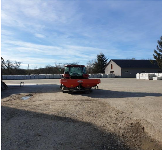
Slika 13. Mehanizacija