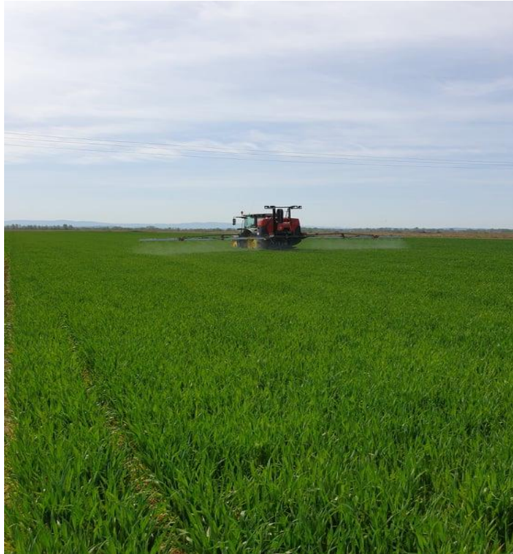
Slika 16. Zaštita lista pšenice