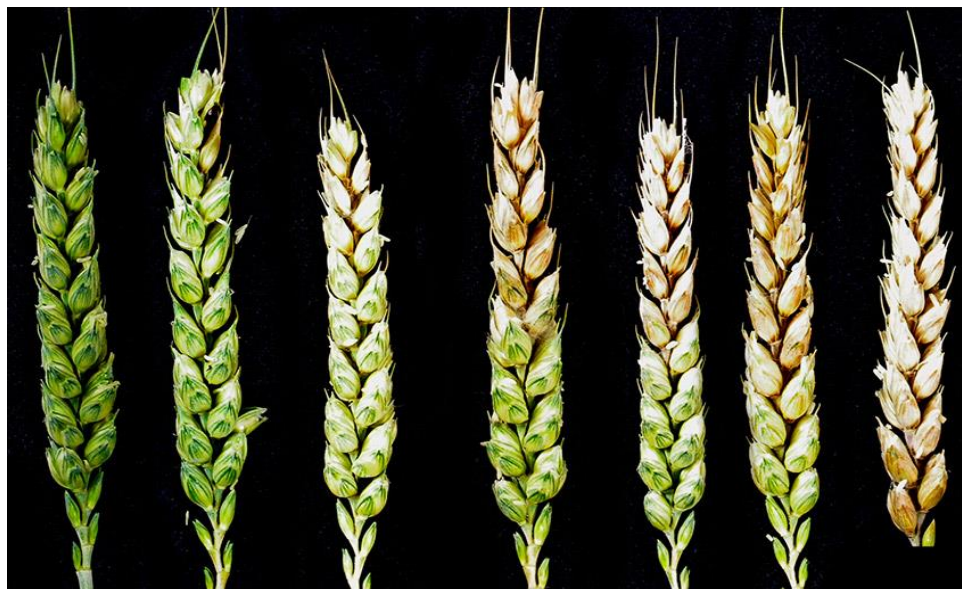
Slika 10. Fusarium