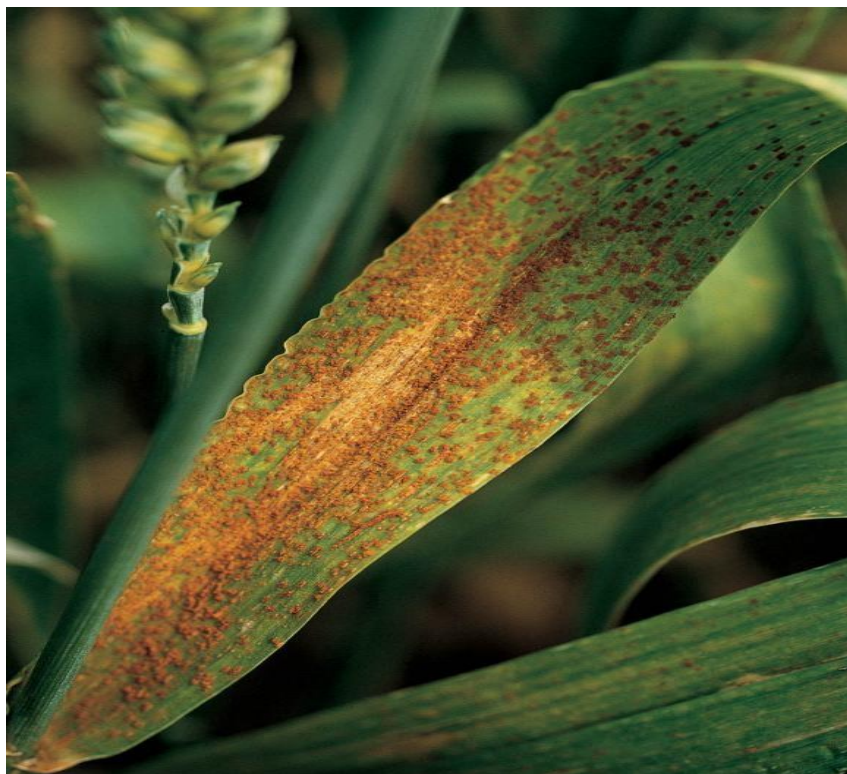
Slika 8. Smeđa hrđa na listu pšenice

Smeđa hrđa, kao i žuta, je domaćin strnim žitima kao i korovima iz porodice Poaceae . Prema Ćosić i sur. (2006.) bolest se pojavljuje svake godine, a najveći izvor zaraze su zaraženi biljni ostatci iz prošlih vegetacija. Ako je godina povoljna za razvoj ove bolesti, gubitci mogu biti i do 70 %. Na pšenici napada najčešće lice list, a rjeđe rukavac lista, vlat, pljeve i osje. Puccinia recondita može napasti biljku kroz cijelu vegetaciju dok su listovi zeleni. Tokom zaraze uredosorusi se mogu vidjeti na gornjoj strani plojke gdje se nalazimo s uredosoruse koji su svijetlije ili tamno smeđe boje (Slika 9.). Imaju oblik leće, hrđaste su boje i nepravilno su rasuti po listu. Spajaju se u slučaju jakog napada, okrugli su i veličine 1-2 mm . Teliosoruse možemo uočiti u klasanju, kao sjajno crne nakupine na licu i naličju. Zaduženi su za prijenos zaraze na druge biljke pri velikom temperaturnom rasponu do 2 do 32 °C. Uredospore ostaju aktivne i zimi ukoliko temperatura nije manja od 2 do 3 °C. Vrlo su vitalne, a svoju klijavost mogu očuvati i do 220 dana, a inače se prenose vjetrom. Do infekcije može doći pri temperaturnom rasponu od 2 do 32 °C, a potom dužina inkubacije ovisi o temperaturi (Ćosić i sur. 2006.).