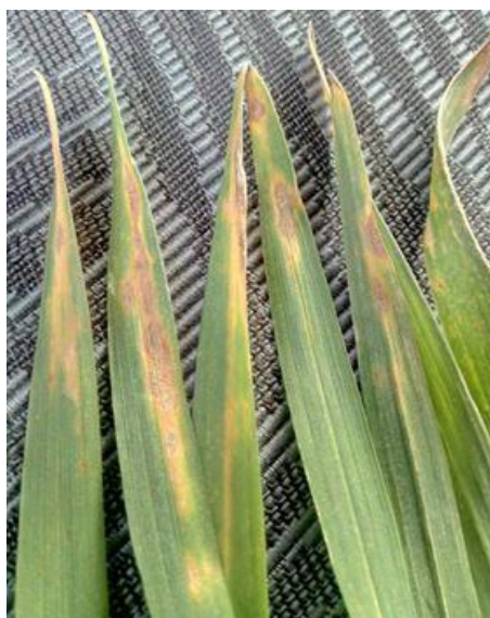
Slika 20. Septoria tritici na listu pšenice

Nakon pregleda polja „Bašća Rus“ 18.04. 2020. utvrdili smo pojavu smeđe pjegavosti na listu pšenice uzrokovane sa Septoria tritici . Bolest je zahvatila manji dio table, uglavnom kontrolnu varijantu gdje nije bilo primjene fungicida (Slika 22.). Postotak zaraženih biljaka na dijelu table koji nije bio tretiran fungicidom iznosio je 40 % dok je na tretiranom dijelu bilo 5 % zaraze. Prema OEPP/EPPO (2012.) skali postotak zaraze na listu u prosjeku je bio 25 % (Slika 21.). Iako se na manjem dijelu table bolest razvila na cijelom listu, te je 50 % površine lista je imalo simptome.