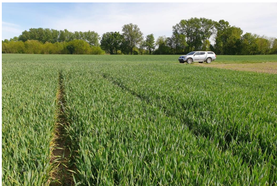
Slika 24. Tabla „Polje 1“