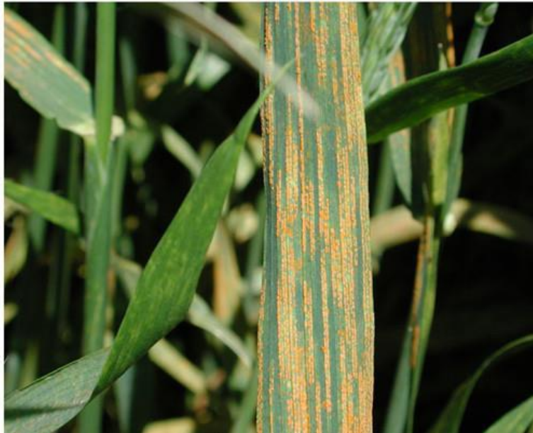
Slika 6. Žuta hrđa na pšenici ( http://rusttracker.cimmyt.org )