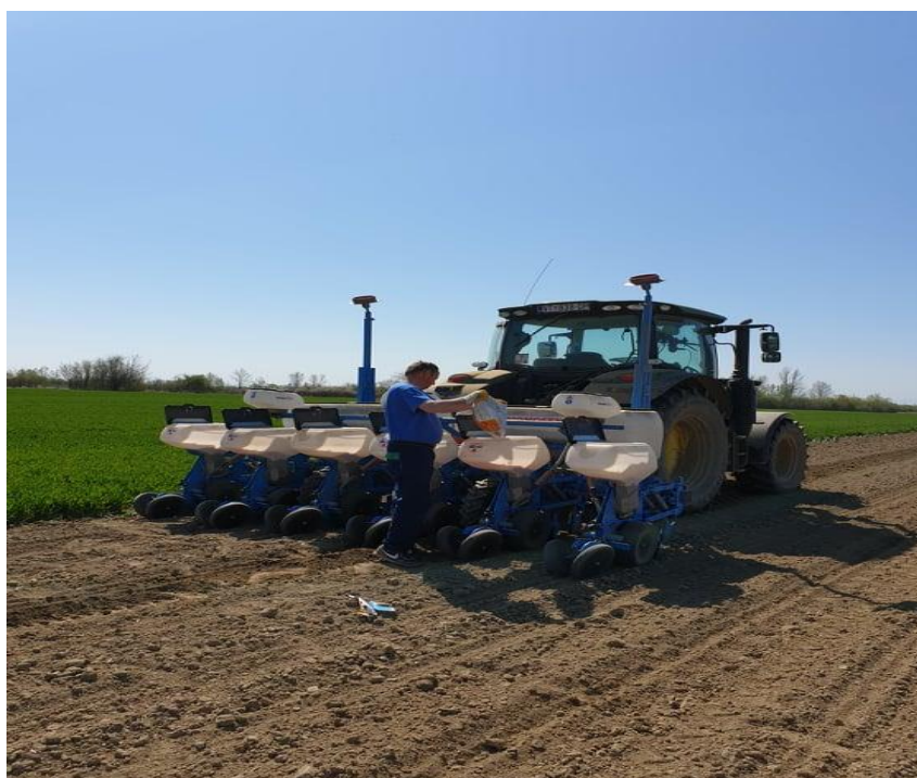
Slika 11. Sjetva