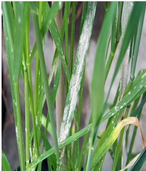
Slika 5. Pepelnica na pšenici

Glavni simptomi ove bolesti su sive prevlake koje nalazimo na licu i naličju lista (Slika 6.). Uslijed velike zaraze, dolazi do gubitka zelene boje, te list žuti i propada. Prosječni gubici prinosa pšenice iznose 5-10% dok su kod ječma duplo veći. Kod napada za vrijeme glavnog rasta dolazi do manjeg ulaganja škroba u zrno pa time i smanjenja kvalitete zrna. Bjeličaste nakupine na listu lista nazivamo micelij koji postupno mjenja boju u pepljastu. Unutar micelija nastaju crni kleistoteciji koji su vidljivi bez lupe. U kleistotecijima se nalaze askusi sa askosporama. Prema (Jurković i sur., 2016.) nespolno razmnožavanje je uz pomoć višestaničnog micelija, odnosno konidija koje se nalaze na površini lista. Pepelnicu nije neophodno suzbijati preventivno no ne smije se dozvoliti da zahvati veću površinu biljke.