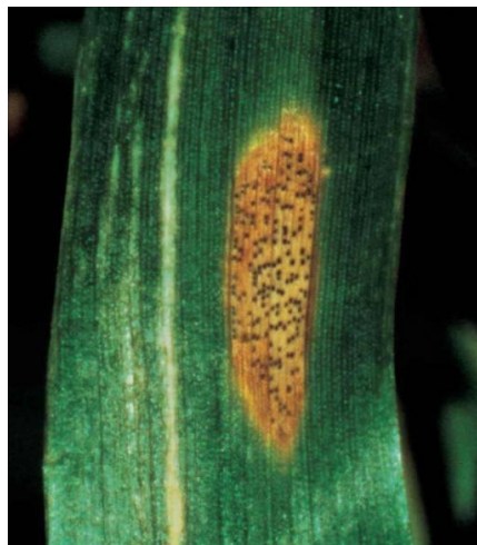
Slika 4. Smeđa pjegavost lista

Najuspješnije suzbijanje je u fazi vlatanja, dakle preventivno. Kritičan period upravo je na početku vlatanja u fazi drugog koljenca po pojavi trećeg lista kada je obvezatno obaviti prvu zaštitu protiv ove bolesti.