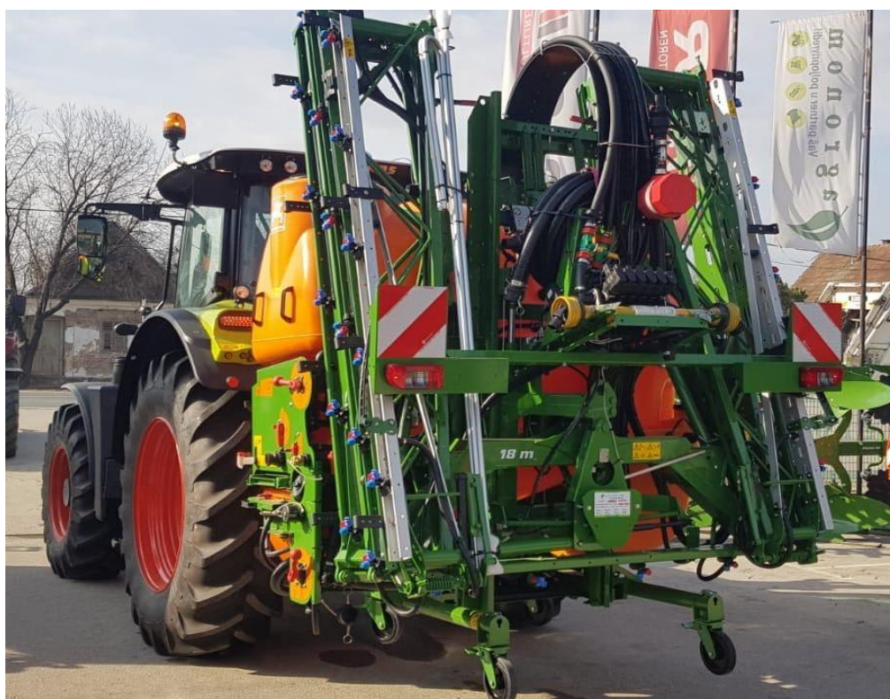
Slika 4. Amazone UF prskalica