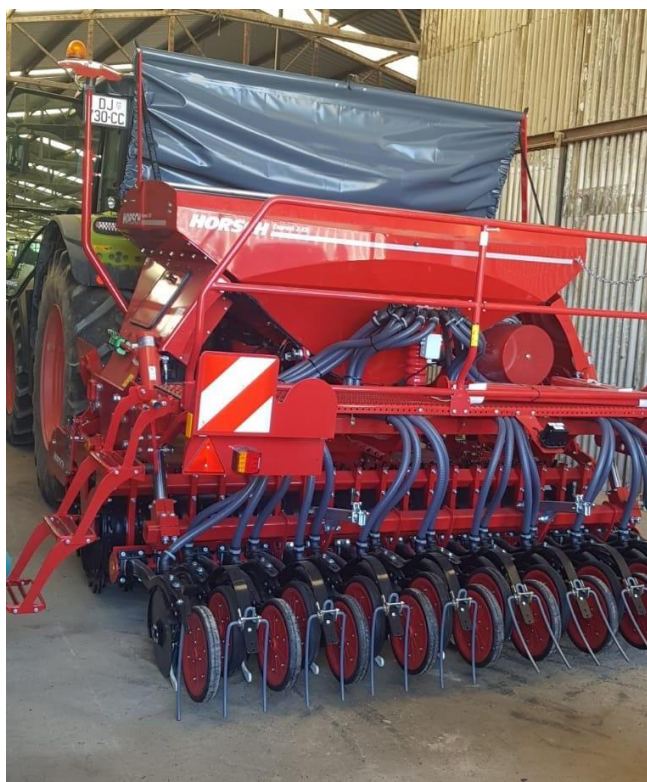
Slika 3. Horche Expres sijačica