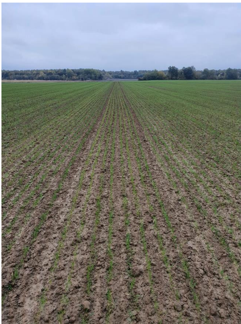
Slika 2. Prikaz sjetve s navigacijom na polju pšenice

RTK signal za preciznost navođenja s pogreškom od 2-3 cm, nam je omogućio rad s većom preciznosti pri većim brzinama s čime odmah imamo veći učinak.