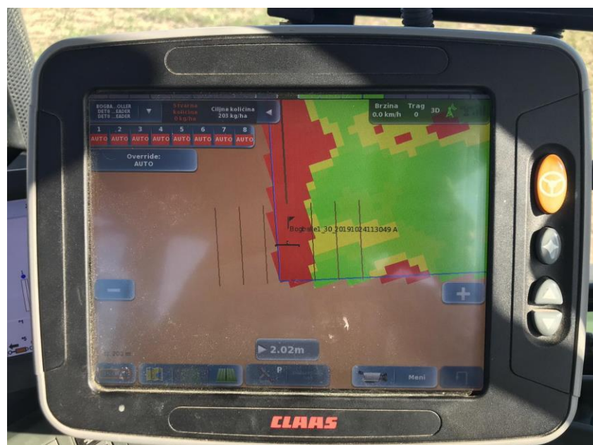
Slika 1. S10 display

TC-GEO je licenca koja nam omogućuje promjenu količine gnojiva, sjemena ili zaštite ovisno o točnoj geografskoj lokaciji na kojoj se nalazimo, odnosno prije rada u polju napravimo kartu po kojoj odredimo gdje ide kolika količina repromaterijala za tu tablu.