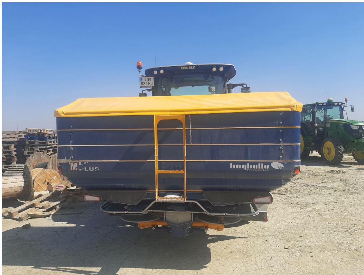
Slika 5. Bogballe M45W razbacivač mineralnog gnojiva

Na OPG-u „Stjepan Ervačić“ se za dokumentiranje svih operacija sa satima rada, utrošenim repromaterijalom i točnim datumom kada je koja operacija odrađena koristi se program FarmNet, te imamo mogućnost praćenja vegetacije putem satelitskog snimka svaka 3-4 dana imamo novu snimku. Ovakva tehnologija nam je omogućila da pravovremeno regairamo. Za prihranu koristimo satelitski snimak kako bi smo izradili kartu gnojidbe koju preko USB-a prebacimo u traktor i tako znamo gdje je potrebna koja količina gnojiva.