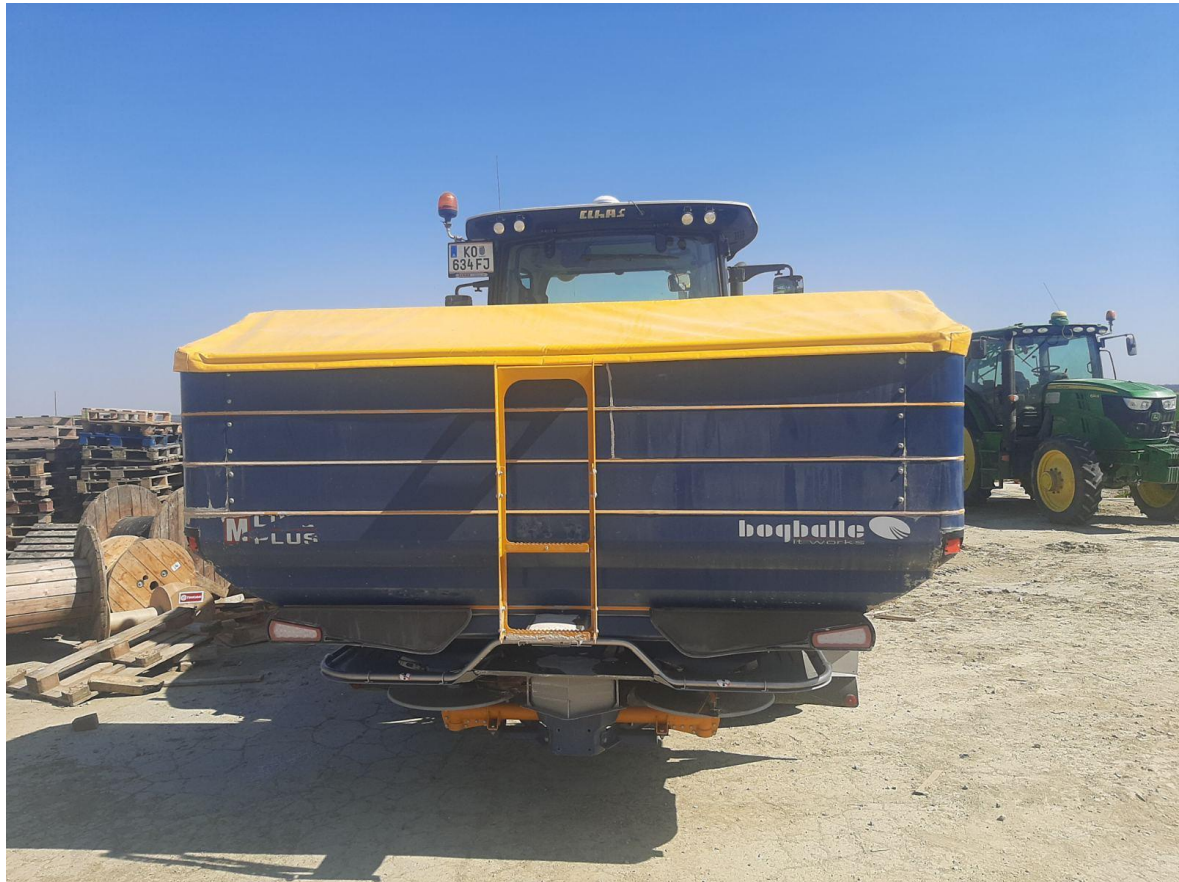
Slika 5. Bogballe M45W razbacivač mineralnog gnojiva

Na OPG-u „Stjepan Ervačić“ se za dokumentiranje svih operacija sa satima rada, utrošenim repromaterijalom i točnim datumom kada je koja operacija odrađena koristi se program FarmNet, te imamo mogućnost praćenja vegetacije putem satelitskog snimka svaka 3-4 dana imamo novu snimku. Ovakva tehnologija nam je omogućila da pravovremeno regairamo. Za prihranu koristimo satelitski snimak kako bi smo izradili kartu gnojidbe koju preko USB-a prebacimo u traktor i tako znamo gdje je potrebna koja količina gnojiva.