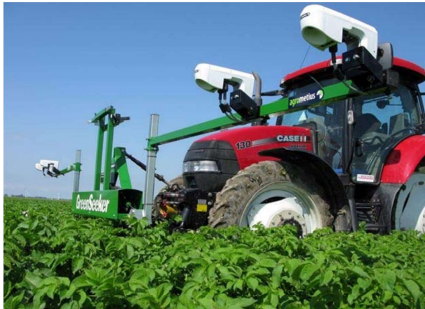
Slika 6. Senzori WeedSeeker