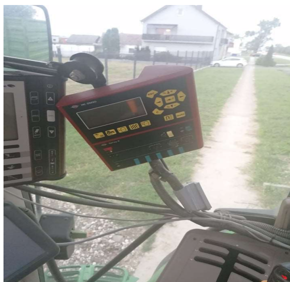
Slika 8. Kontroler HC5500