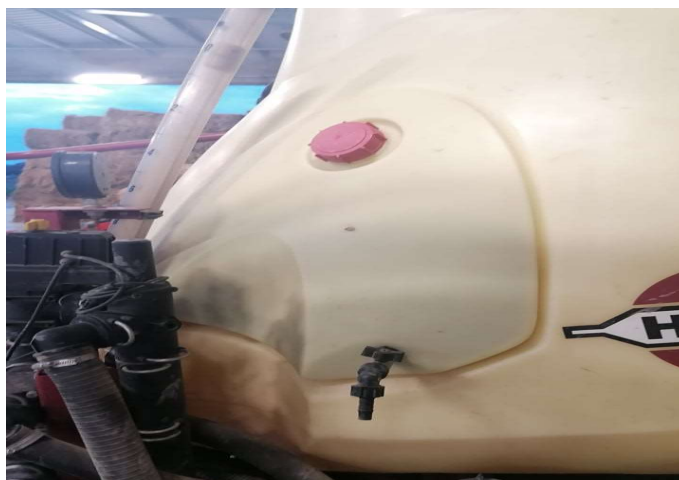
Slika 12. Spremnik za ispiranje ruku

Ranger okvir je izgrađena s čelikom visoke čvrstoće osiguravajući iznimnu čvrstoću. Okvir je konstruiran s niskim središtem gravitacije jer prskalice s visokim središtem gravitacije može biti vrlo opasna za rad. Platforma je postavljena nisko tako da korisnik prskalice ima perfektan uvid. Opremljena je ručnom ogradom za sigurnost i praktičnost. Tekućina u glavnom spremniku pomiče se naprijed što je spremnik prazniji. Na prskalici se nalazi spremnik sa čistom vodom od 19 l obujma.