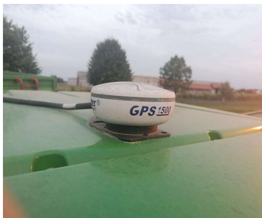
Slika 7. Antena na traktoru John Deere

moguće je podesiti u pokretu. HC 5500 također se može integrirati s HARDI SprayBox III za dodavanje funkcija za kontrolu poput pritiska, aktiviranja sekcija prskanja. Senzor brzine prskalice nalazi se unutar kotača prskalice (Izvor: priručnik za rukovanje).