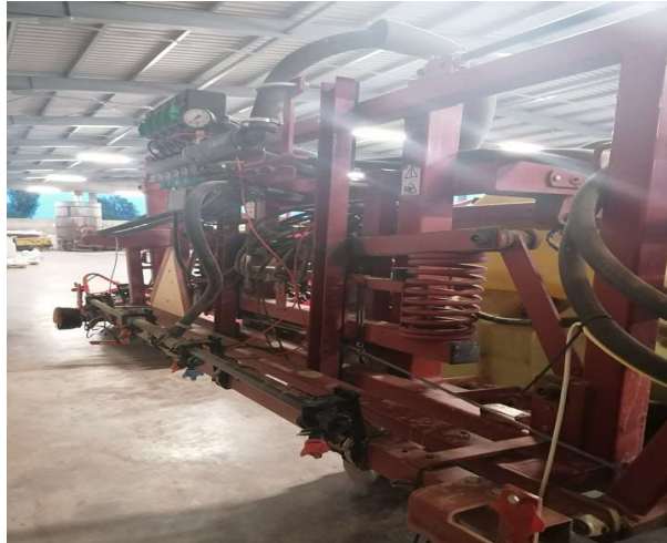
Slika 13. Krila prskalice Hardi Ranger 2500