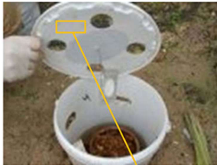
Slika 3. Zamka sa senzorom za štetnike

Senzor slike niske snage je bežični autonomni sustav praćenja koji se temelji na senzoru slike niske snage. Smješten je u zamku, bežični senzor povremeno snima slike sadržaja zamke i šalje ih u kontrolnu stanicu. Takve slike koje senzor pošalje koriste se za određivanje broja štetnika koji se nalaze u svakoj zamci. Na temelju tog broja računa se populacija kukaca i prema tome se planira kada će se početi sa zaštitom usjeva.