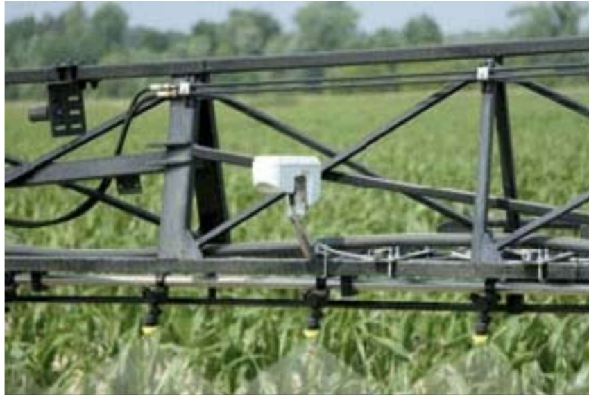
Slika 5. Senzor WeedSeeker

sustav. Sva tri sustava koriste tehnologiju aktivnoga mjerenja refleksije određenoga spektra svjetlosti od usjeva (Izvor: agrivi.blog).