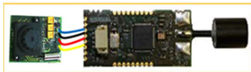
Slika 4. Prikazuje senzor koji se nalazi u zamci