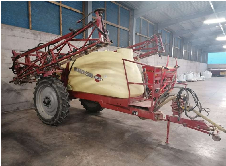
Slika 10. Prskalice Hardi Ranger 2500

radne širine 18 m. Nosač posjeduje lepezaste mlaznice rađene po ISO standardima. Prskalicu karakterizira i TURBO FILTER spremnik za punjenje kemikalijama, u kojem ne postoji mogućnost začepjenja praškastim zaštitnim sredstvom. Stroj posjeduje spremnik za ispiranje prskalice kao i spremnik za pranje ruku. Računalo HC5500 omogućuje automatsko praćenje i upravljanje hektolitarskom dozom prskanja na hrvatskom jeziku. Ovu prskalicu karakteriziraju svjetla za cestovni promet te samoprateće rudo.