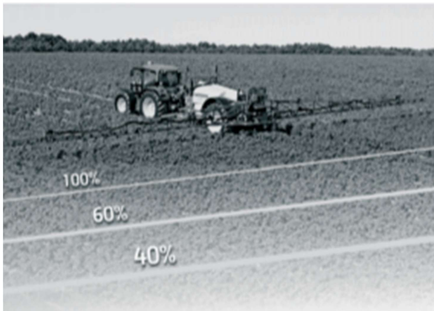
Slika 10. Tretiranje proizvodne površine promjenjivom količinom pesticida

diferencijalno ispravljanje i koristi ga za dobivanje točnosti pozicije na manje od 1 m (2-3 cm). Kada je sustav ispravno postavljen na vozilo, satelit šalje kodiranu informaciju anteni u specijalnoj frekvenciji koja omogućuje prijammiku izračun udaljenosti do svakoga satelita. Kako bi podatci bili točni pri radu na polju, svaki stroj za preciznu poljoprivredu – aplikaciju pesticida mora imati ugrađene mjerne senzore koji isporučuju informacije za izravni postupak upravljanja, dok kod senzorskoga pristupa s kartama koje se preklapaju poljoprivrednik vrši operacije u skladu s raznolikostima na polju. Te razlike mogu nastajati ovisno o načinu i radnjama upravljanja tlom, svojstvima tla i/ili značajkama okoliša (Izvor: priručnik za rukovanje).