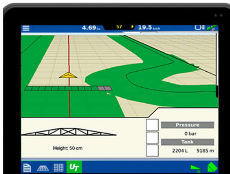
Slika 9. AutoSectionControl za automatsko otvaranje i zatvaranje mlaznica

DynamicFluid4 (DF4) je snažni regulator tlaka koji osigurava brzu, preciznu kontrolu stope primjene sredstva za zaštitu. Koristeći četiri senzora za automatsko praćenje tlaka, protoka tekućine, okretaja crpke i vlastitog položaja ventila, kontrolor DF4 bilježi promjene koje će utjecati na protok kod mlaznica (npr. promjena u okretaju) i proaktivno podešava tlak sustava kako bi ga regulirao. AutoSectionControl automatski otvara i zatvara mlaznice kako bi se izbjeglo ponavljanje prskanja prilikom prolaska preko prskanog područja. Na kontroler HC5500 dolazi kao dodatna oprema i spaja se na GPS prijemnik. Prilikom tretiranja proizvodne površine automatski snima područja gdje se obavlja zaštita te automatski zatvara mlaznice ukoliko prskalica prolazi preko dijelagdje je obavljena zaštita, kako ne bi došlo do ponovljene zaštite istoga dijela proizvodne površine (Izvor: priručnik za rukovanje).