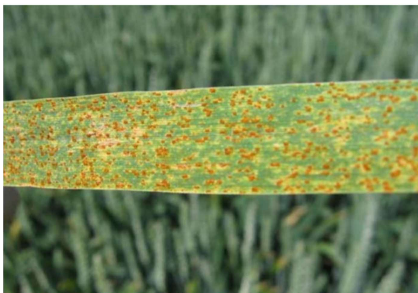
Slika 14. Skeniranje usjeva u sklopu precizne zaštite bilja

Skeniranje usjeva obavlja se radi toga da se ne tretira usjev tamo gdje nije potrebno obavljati zaštitu, time se smanjuje potrošnja sredstva za zaštitu što rezultira uštedom novca i resursa. Informacije koje se dobiju pomoću skeniranja usjeva odmah se obrađuju te se šalje upit prskalici koja se koristi, u slučaju kod Agrolov d.o.o radi se o Hardi Ranger 2500 .