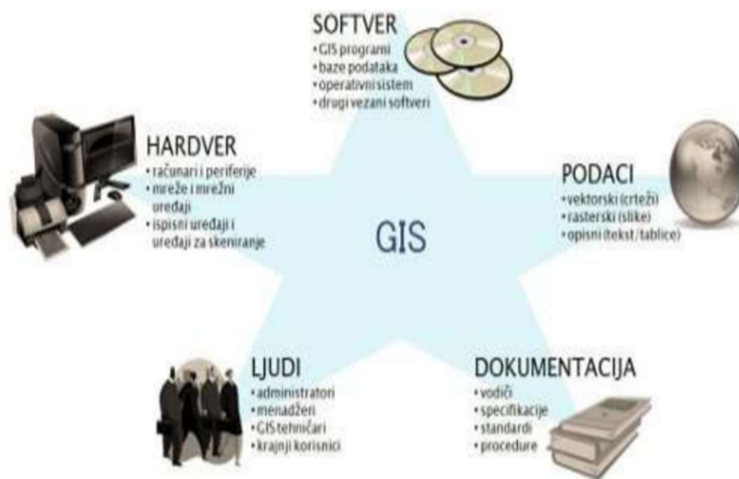
Slika 1. Prikazuje komponente GIS sustava

GIS je moćan skup sredstava za prikupljanje, pohranjivanje, pretraživanje po potrebi, transformacije i prikazivanje prostornih podataka iz stvarnog svijeta (Burrough, 1986.).