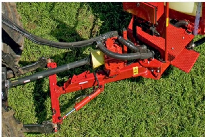
Slika 1. Korekcija nagiba