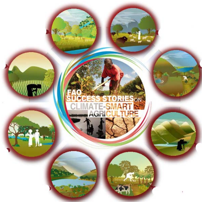
Slika 7. Pristupi i prakse klimatski pametne poljoprivrede

Postoje brojni pristupi i prakse (Slika 7.) koji mogu značajno pridonijeti povećanju proizvodnje, a da istovremeno ostanu usredotočene na održivost okoliša. Ne postoji univerzalni pristup koji je primjenjiv u svakom agroekosustavu već je potreban pristup koji uključuje različite elemente ugrađene u lokalni kontekst odnosno odlike svakog agroekološkog područja (Jug i sur., 2015.).