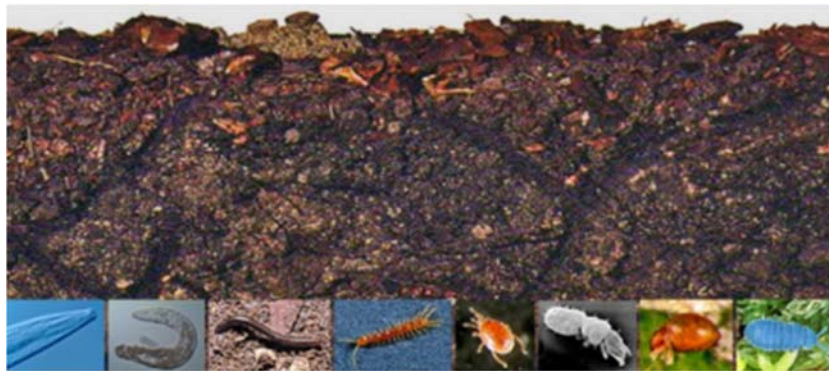
Slika 5. Biološka raznolikost tla

U poljoprivredi, oko 80% BNF- a postiže se simbiotskom povezanošću mahunarki i kvržičnih bakterija (protobakterija iz reda Rhizobiales , porodice Bradyrhizobiaceae i Rhizobiaceae ). Na BNF može se utjecati izborom mahunarki, udjelom mahunarki i sjemenki trave u krmnim smjesama, inokulacijom sjemenata, ishranom usjeva (posebno dušikom i fosforom), suzbijanjem korova, bolesti i štetočina, vrijeme sadnje, rotacijom usjeva, te učestalost defolijacije krmiva. Međutim, neki se čimbenici, uključujući nepovoljne temperature i suše, koji utječu na BNF, ne mogu kontrolirati. Također, neke leguminoze bolje fiksiraju dušik u odnosu na druge leguminoze. U višegodišnjim mahunarkama s umjerenom krmom, crvena djetelina i lucerna obično mogu fiksirati 200–400 kg dušika po hektaru (uključujući cijelu biomasu) (FAO, 2009.)