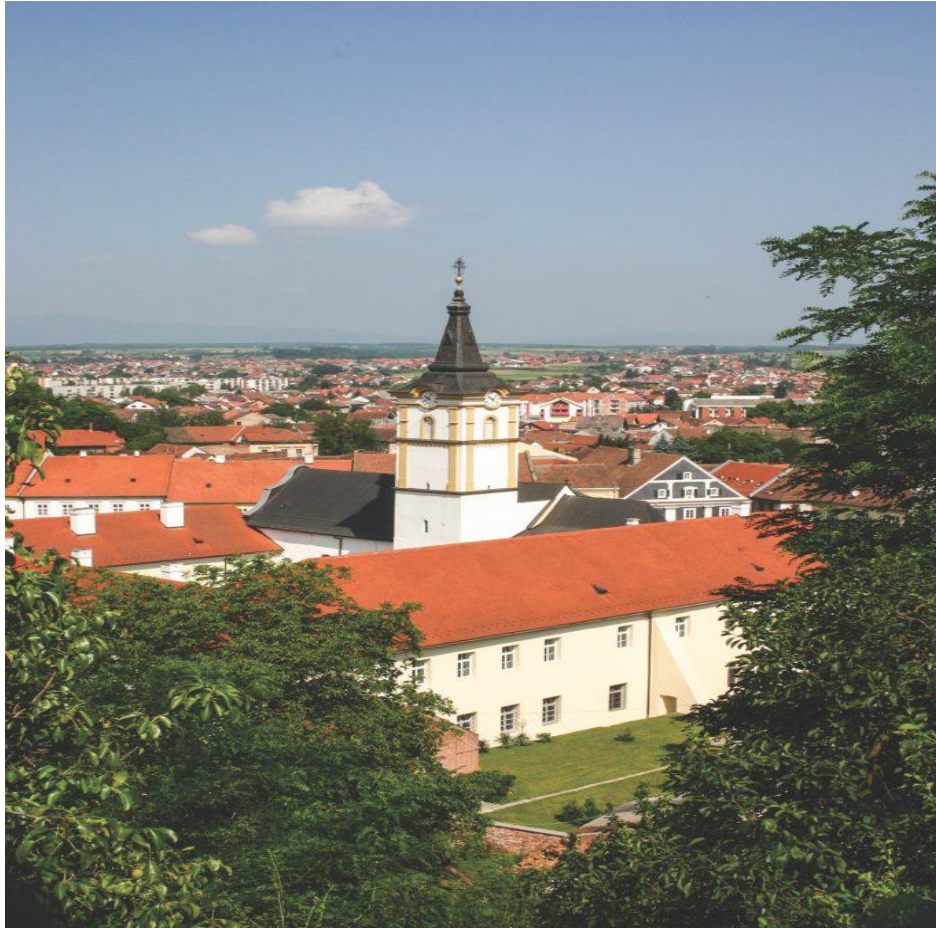
Slika 3. Požega