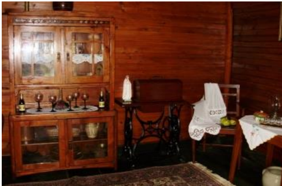
Slika 7. Etno muzej na Eko gospodarstvu Božić