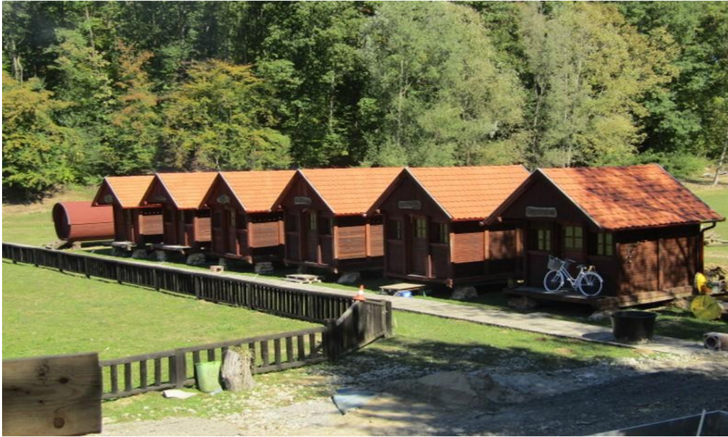
Slika 11. Drveni bungalovi na Ranču Čondić