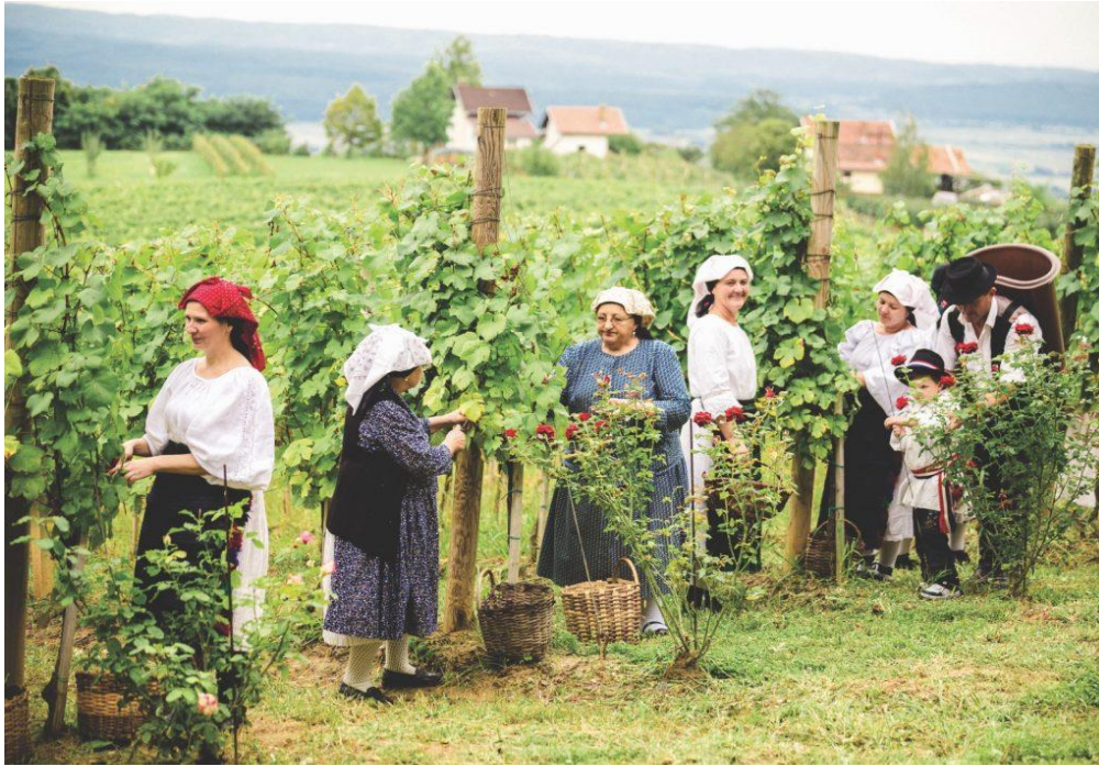
Slika 4. Kutjevački vinograd