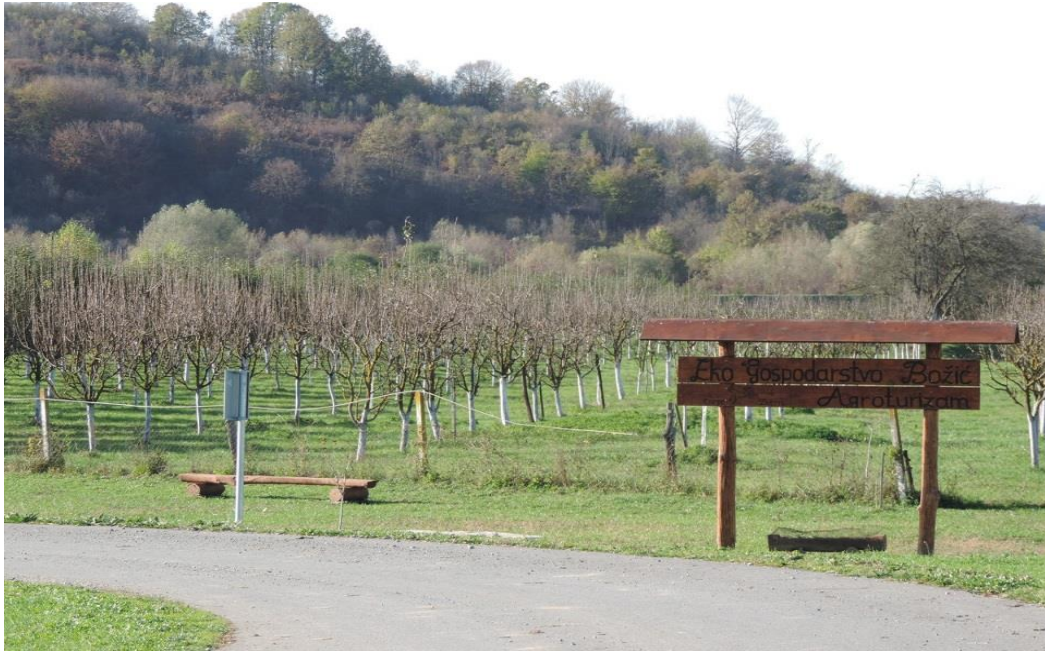
Slika 6. Voćnjak na Eko gospodarstvu Božić

fokusirali su se na solitarne pčele, uholaže, bubamare i zlatooke (Radio Vallis Aurea/OPG Božić).