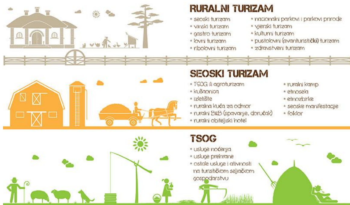
Slika 1. Prikaz međudnosa ruralnog, seoskog i turizma na turističkim seoskim obiteljskim gospodarstvima

„Ruralni turizam predstavlja zajednički naziv za sve posebne oblike turizma u ruralnim područjima. Posebni oblici ruralnog turizma mogu biti: turizam na seljačkim gospodarstvima, lovni, ribolovni, ekoturizam, zdravstveni, sportsko-rekreacijski, rezidencijalni (kuće za odmor), avanturistički, kamping turizam, nautički turizam, gastronomski, vinski, kulturni turizam, vjerski turizam i ostali posebni oblici“ (Bašić Palković, 2018.). Na Slici 1. prikazana je podjela ruralnog turizma.