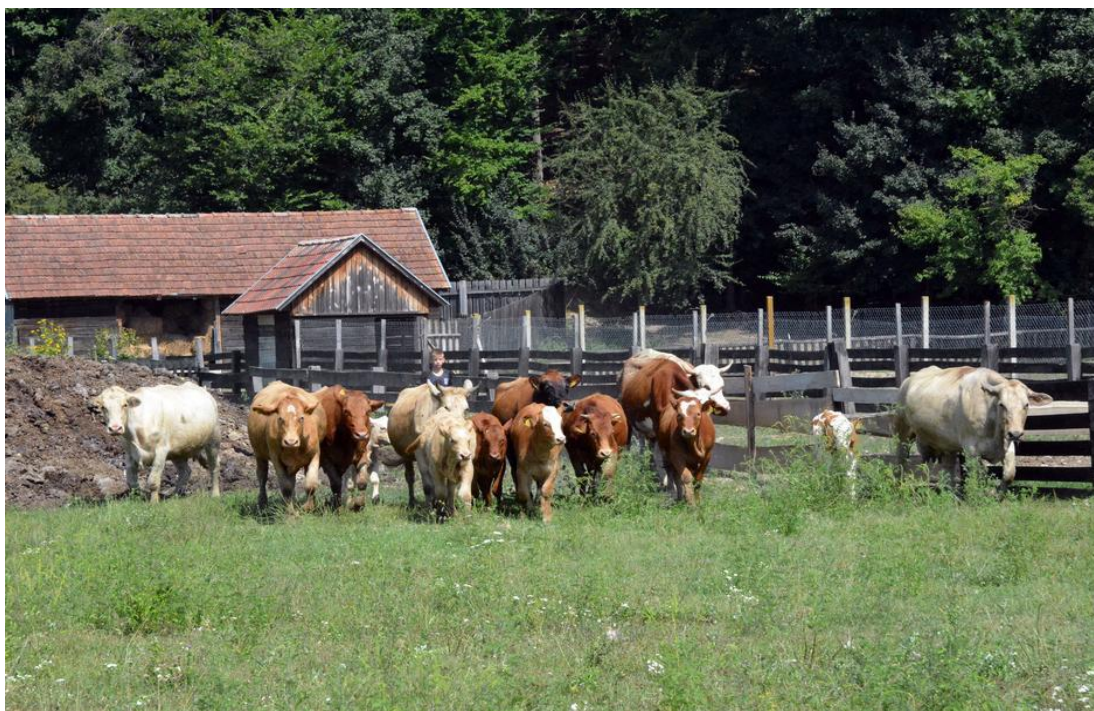
Slika 9. Životinje na ranču Čondić