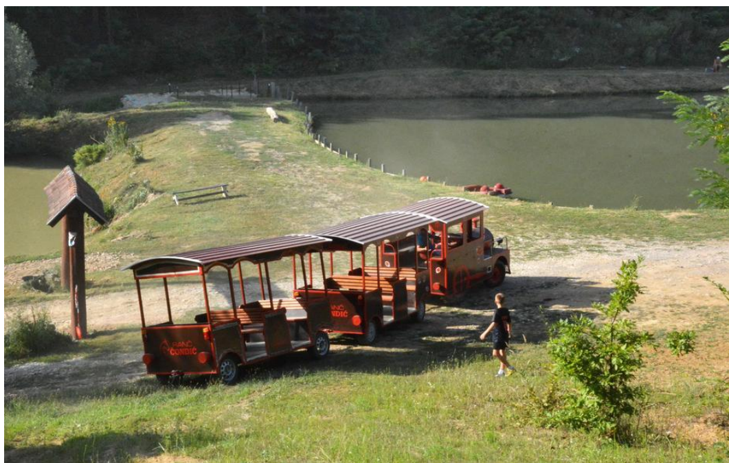
Slika 10. Akumulacijska jezera na Ranču Čondić