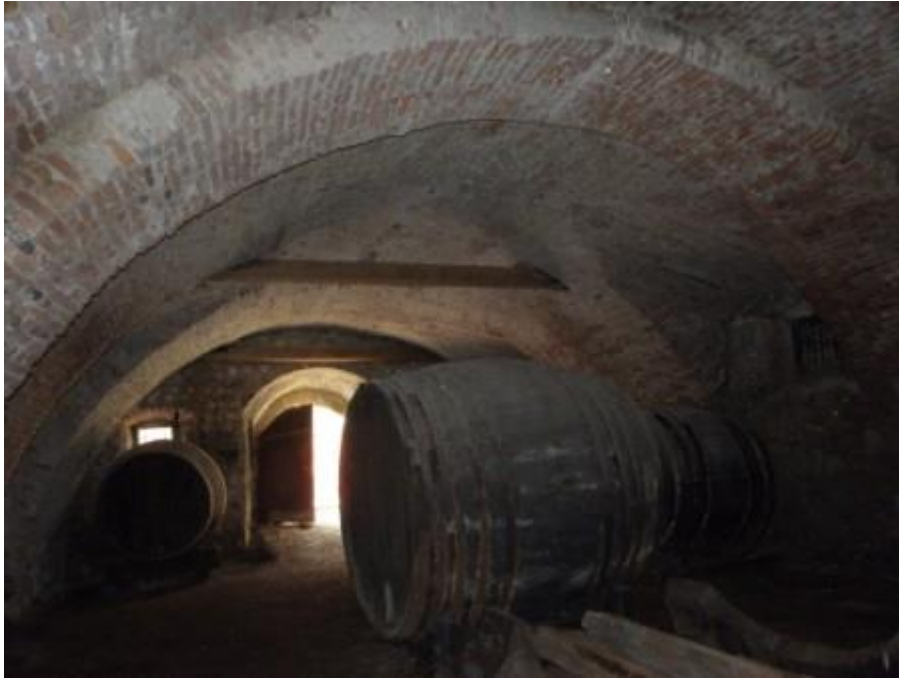
Slika 5. Spahijski podrum