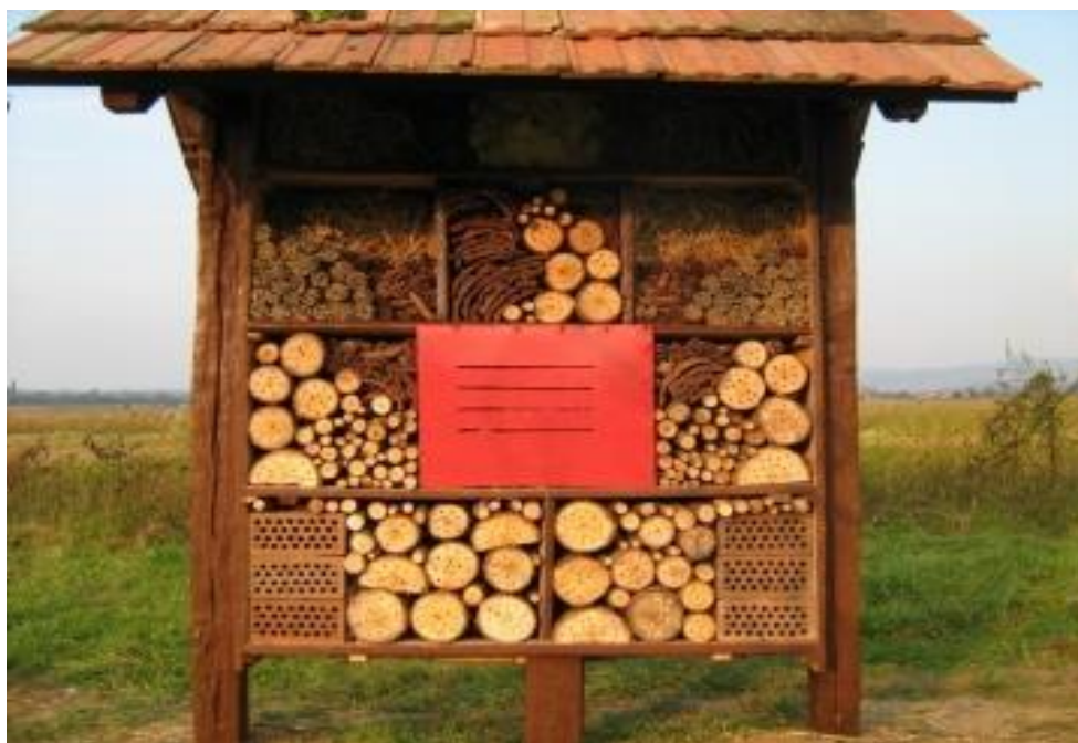
Slika 8. Hotel za kukce na Eko imanju Božić