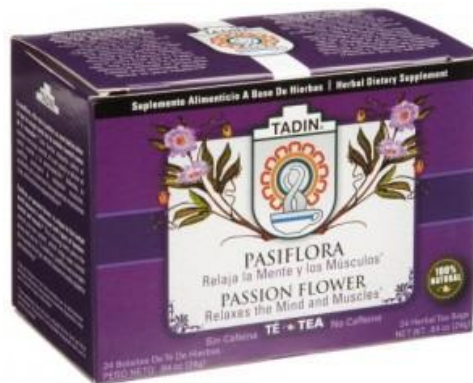
Slika 20. Čaj od Passiflore incarnate 2