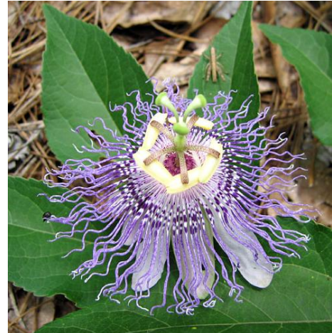
Slika 9. Kruna od resastih segmenata