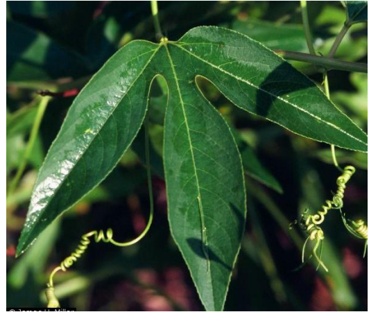
Slika 5. Nazubljeno lišće Passiflore incarnate

Cvijeta od lipnja do rujna. Cvjetovi su pojedinačni promjera 4-6 cm i lijepog mirisa. Neobični cvijet svijetlo ljubičaste boje (boja lavande), rijetko bijele sa pet latica (Slika 6). Cvijet također sadrži pet čašičnih listića (sepala) (Slika 7), pet peludnica, trodijelni tučak (Slika 8) i krunu od mnogo resastih segmenata koji se ističu iznad latica. Kruni kojoj boja varira od bijele do svijetlo ljubičaste sa žarko ljubičastim okvirom (Slika 9). Reproductivni organi su zanimljivo raspoređeni i daju cvijetu egzotičnu ljepotu.