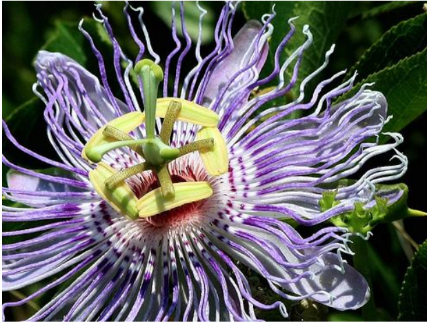
Slika 8. Pet peludnica i trodijelni tučak