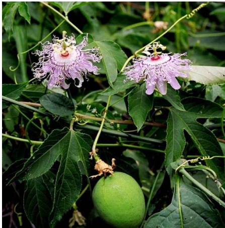
Slika 10. Plod-boba žuto zelene boje

Plod je boba zeleno-žute boje (Slika 10). Ovalnog oblika. Veličine kokošjeg jajeta (4-10 cm dužine). Razvija se dva do tri mjeseca nakon cvatnje. Sadrži više tamnih sjemenki 4-6 mm dužine, koje su prekrivene jestivim usplođem (Slika 11).