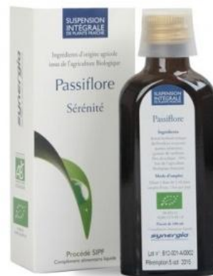
Slika 22. SIFP ekstrakt