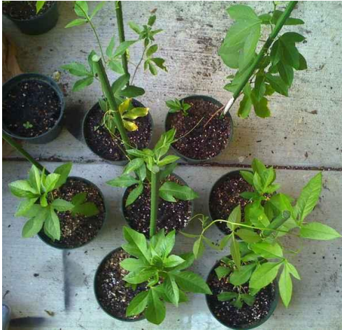
Slika 31. Passiflora incarnata uzgojena iz reznica 1