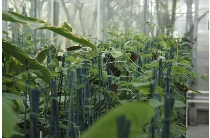
Slika 32. Passiflora incarnata uzgojena iz reznica 2