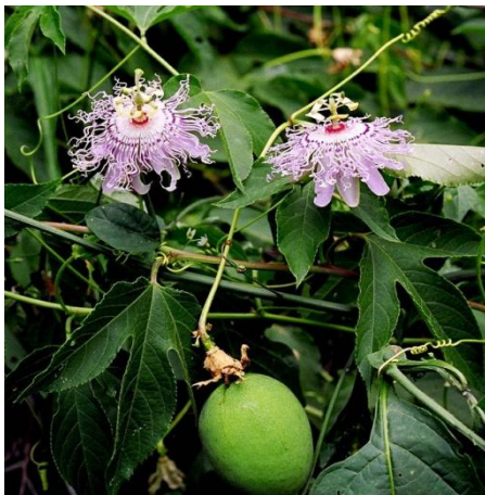
Slika 10. Plod-boba žuto zelene boje

Plod je boba zeleno-žute boje (Slika 10). Ovalnog oblika. Veličine kokošjeg jajeta (4-10 cm dužine). Razvija se dva do tri mjeseca nakon cvatnje. Sadrži više tamnih sjemenki 4-6 mm dužine, koje su prekrivene jestivim usplođem (Slika 11).