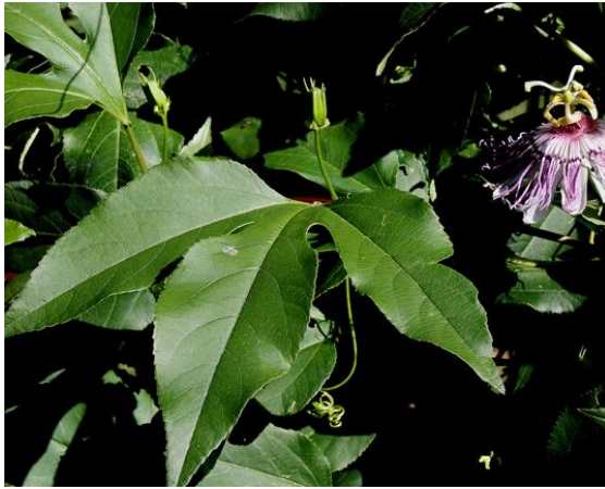
Slika 4. Veliko lišće Passiflore incarnate