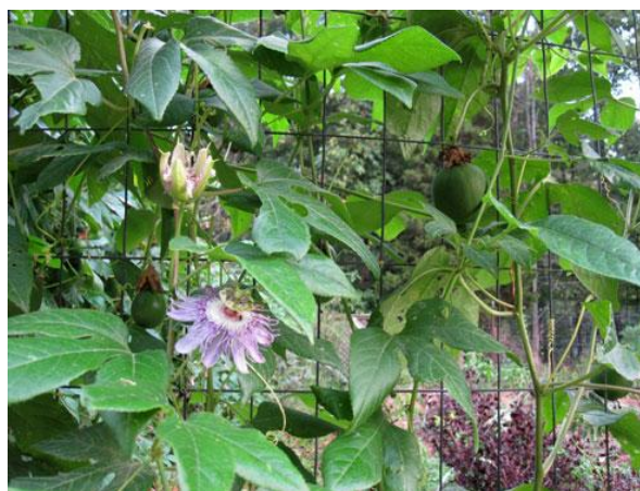
Slika 24. Potporanj za rast Passiflore incarnate