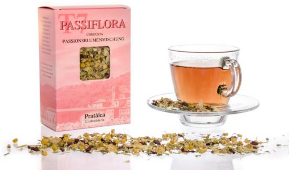
Slika 19. Čaj od Passiflore incarnate 1

Plodovi Passiflore incarnate mogu se jesti sirovi ili spravljati na razne načine (Ljekovito bilje, 2014.). Koriste se u spravljanju soka, vina ili likera i sladoleda (Beal, 2014.).