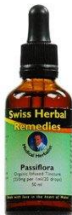
Slika 21. Tinktura od Passiflore incarnate