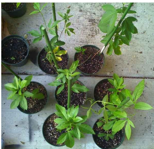
Slika 31. Passiflora incarnata uzgojena iz reznica 1