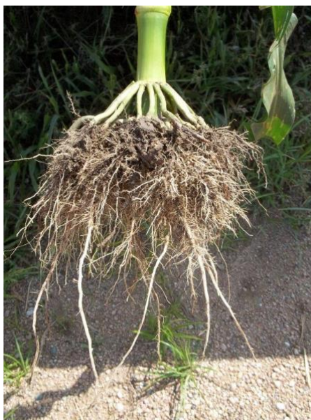
Slika 2. Korijen kukuruza

Korijen kukuruza dobro je razvijen i ima dobru moć upijanja što omogućuje da na lošim tlima i sušnijim uvjetima koristi vodu iz dubljih slojeva te na taj način osigurava dobar prinos. Na razvoj korijenova sustava utječe genotip, tip tla i njegova plodnost, klimatski uvjeti, agrotehnika, obrada tla, dubina sjetve, gnojidba, njega i zaštita (Kovačević i Rastija, 2009.).