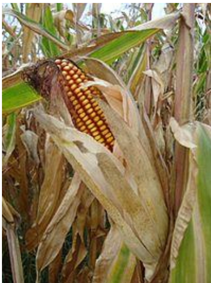
Slika 4. Listovi omotača klipa (komušina)

Listovi su izmjenično smješteni na stabljici (Hulina, 2011.). Na kukuruzu se, ovisno o značenju i mjestu gdje se zameću i nalaze, razlikuju tri vrste listova: klicini listovi, pravi i listovi omotača klipa (komušina). Listovi omotača klipa razvijaju se na nodijima drške klipa (Slika 4.). Oni štite klip i zrna od štetnih vanjskih utjecaja, bolesti i štetnika.