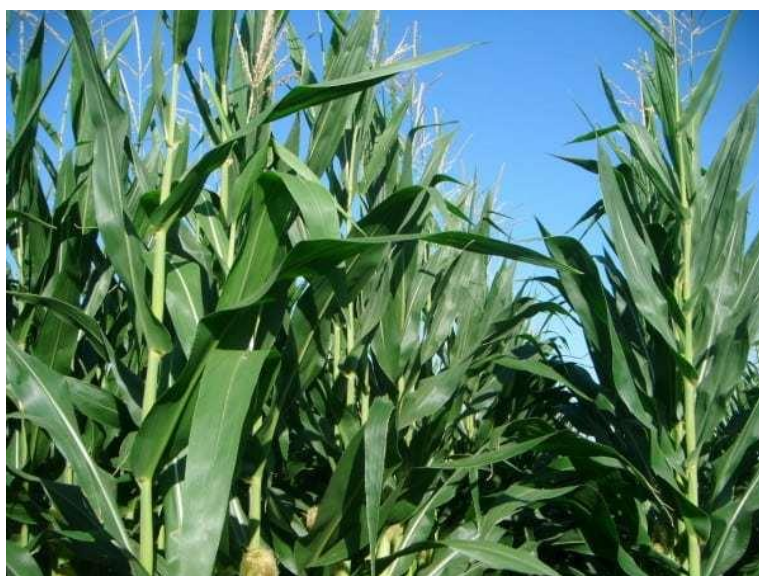
Slika 5. Pravi listovi kukuruza

Izvor: https://www.agroportal.hr/ratarstvo/1527