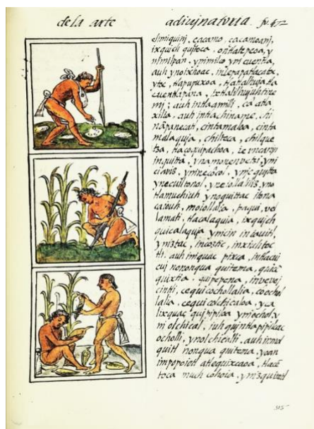
Slika 1. Uzgoj kukuruza na ilustraciji iz 16.stoljeća

Prvu botaničku sliku kukuruza objavio je Fuchs 1542. godine pod imenom Triticum turcicum .