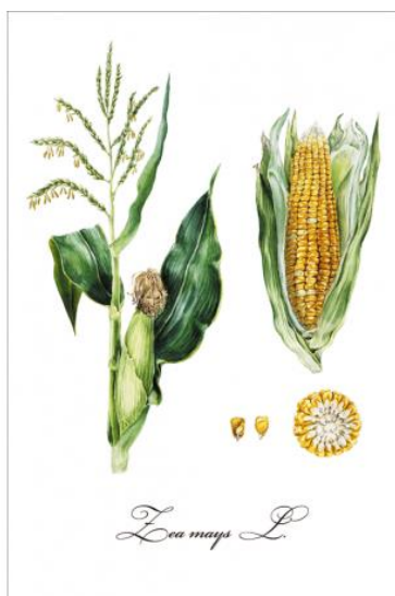
Slika 6. Muška i ženska cvat kukuruza