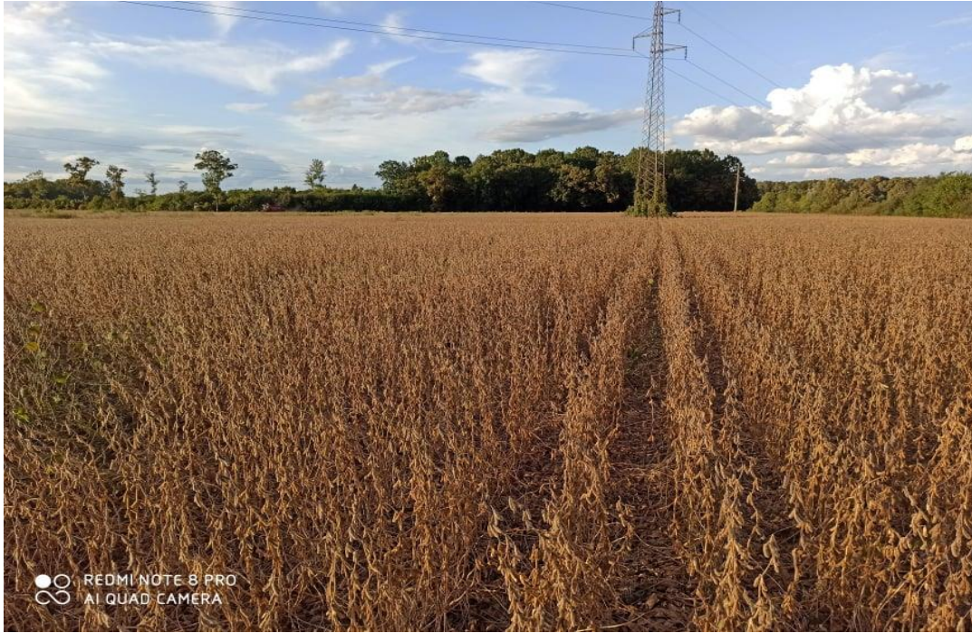
Slika 6. Usjev soje