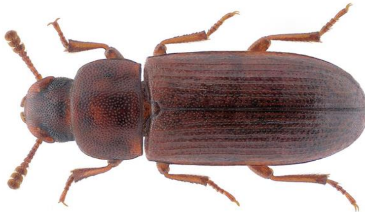
Slika 1. Kestenjasti brašnar ( Tribolium castaneum Herbst)

Tijelo imaga (slika 1.) je duguljastog oblika od 3-4 mm. Crveno smeđe do kestenjaste boje tijela. Ličinka (slika 3.) je žučkasta do crveno smeđe boje od 6 do 7 mm živi unutar zrna ili proizvoda. Kada temperatura zraka iznosi +7°C kukci ugibaju za 25 dana, a ako je temperatura zraka -6°C ugibaju za samo jedan dan (Ivezić, 2008.).