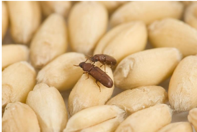
Slika 2. Kestenjasti brašnar na zrnatih proizvodima