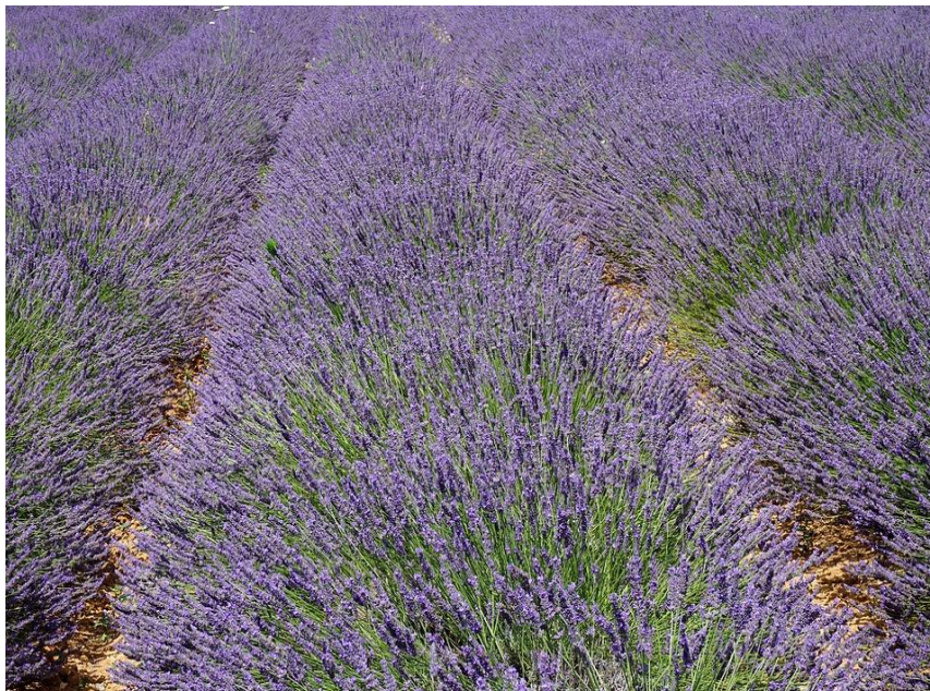
Slika 4. Lavandin

Grm je veličine 80-120 cm a prilikom cvatnje iznosi i 150 cm. Cvjetne stapke su im duže, a osim glavne stapke, imaju još dvije postrane. Količina ulja kreće se oko 0,9-3% u cvijetu. Sjeme je neplodno za razliku od prave lavande. Cvate prvi put krajem mjeseca srpnja, a drugi put tijekom mjeseca rujna. ( http://www.lavanda-lavandin.com/Karakteristike_lavande_i_lavandina.htm ).