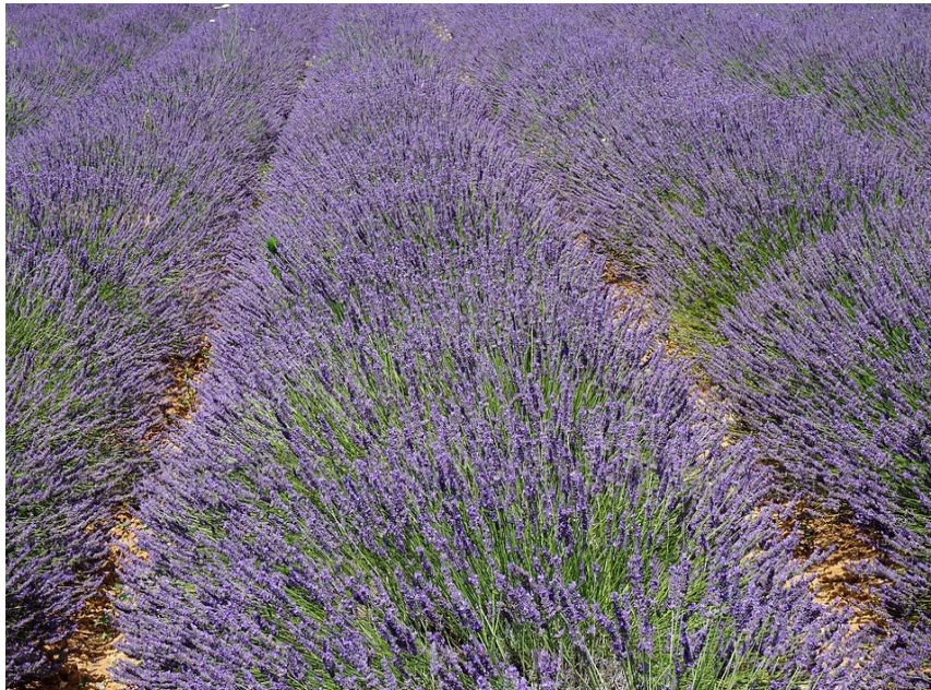
Slika 4. Lavandin

Grm je veličine 80-120 cm a prilikom cvatnje iznosi i 150 cm. Cvjetne stapke su im duže, a osim glavne stapke, imaju još dvije postrane. Količina ulja kreće se oko 0,9-3% u cvijetu. Sjeme je neplodno za razliku od prave lavande. Cvate prvi put krajem mjeseca srpnja, a drugi put tijekom mjeseca rujna. ( http://www.lavanda-lavandin.com/Karakteristike_lavande_i_lavandina.htm ).