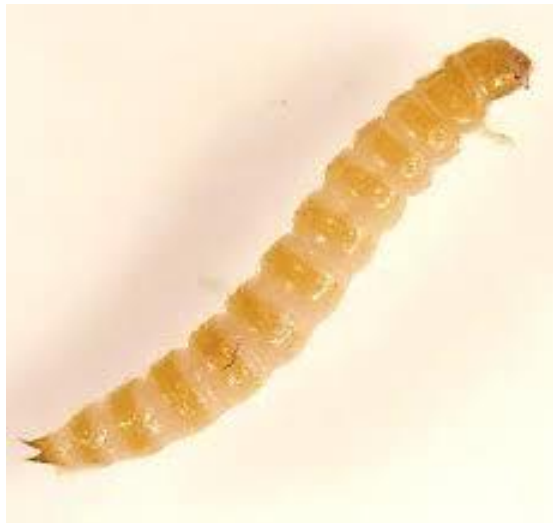
Slika 3. Ličinka Tribolium castaneum