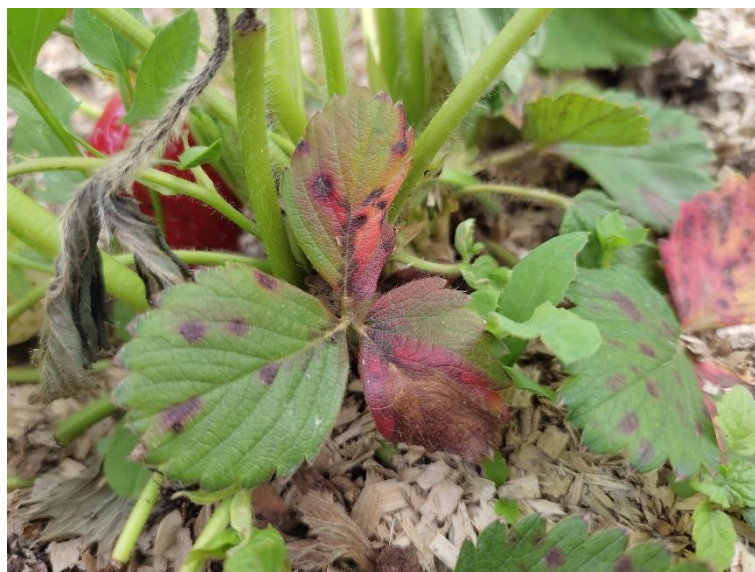
Slika 11. Crvena pjegavost lista jagode

Simptomi crvene pjegavosti su vrlo slični simptomima obične pjegavosti lista jagode. Javljaju se početkom svibnja u obliku malih, crvenih pjega. Daljnjim razvojem bolesti pjege postaju veće i crvenkastosmeđe boje. Razlika od obične pjegavosti je to što središnji dio pjege nema bjelkastu boju. U povoljnim uvjetima pjege se međusobno spajaju u veće lezije, te dolazi do nekroze i lišće izgleda kao spaljeno (Louws i sur., 2014.).