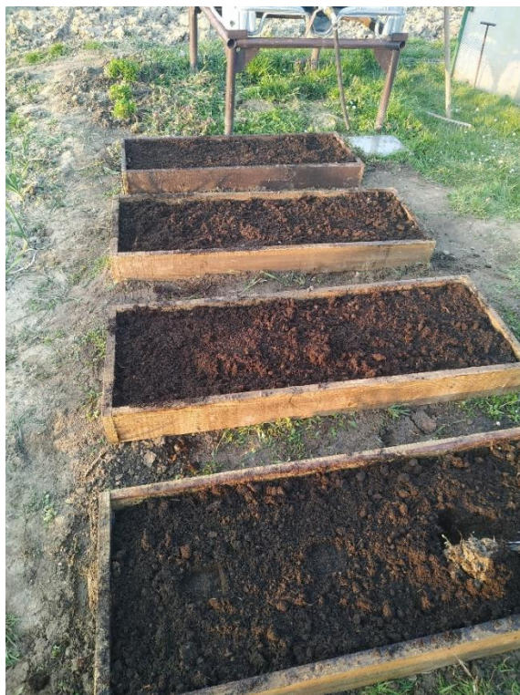
Slika 17. Gredice za uzgoj jagoda

Kako bi se tlo što bolje pripremilo za jagode potrebno je duboko oranje na dubini od 30 do 40 centimetara ako je riječ o nasadu jagoda na otvorenom. Zatim se tanjuračom razbijaju grude koje su ostale poslije oranja i tako se usitni tlo kako bi bilo spremno za sadnju. U pokusu su korištene gredice, kao što prikazuje slika 17., u koje su dodani različiti slojevi tla, pa nije bila potrebna dubinska obrada tla.