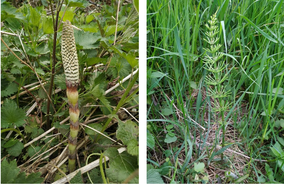
Slike 14. i 15. Fertilna i sterilna stabljika preslice