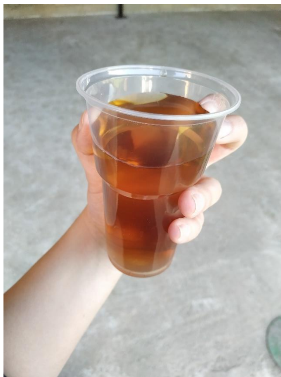
Slika 21. Razrijeđeni biljni pripravak od preslice i koprive

Pripravci su se radili odvojeno jer miješanje biljaka može dovesti do poništavanja djelatnih tvari. Nakon 10 dana, uz svakodnevno miješanje otopine, pripravci su bili spremni za korištenje. Slika 21. prikazuje razrijeđeni biljni pripravak. Za zalijevanje jagoda korišten je omjer 2:10.