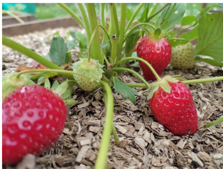
Slika 24. Plodovi tretirane sadnice biljnim pripravkom