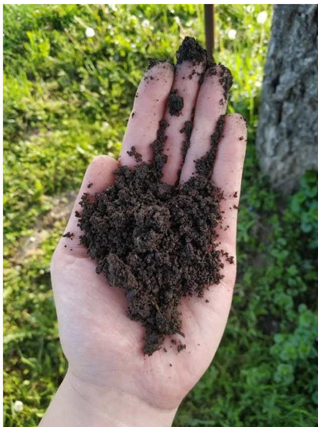
Slika 18. Kompost iz vlastitog uzgoja

Za pokus su korištene kupljene presadnice koje su proizvedene u prethodnoj godini. Vrlo je važno da su sadnice svježe i zdrave, odnosno bez virusa, nematoda, te uzročnika bolesti i štetočina. Jagode se sade tijekom cijele godine. Najčešće se primjenjuje jesenska sadnja kako bi jagode prezimile u tlu, te se pripremile za normalan rast. Stanje dormancije im omogućuje bolju otpornost na bolesti u proljeće.