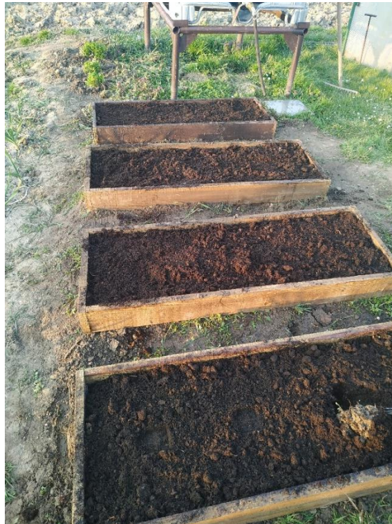
Slika 17. Gredice za uzgoj jagoda

Kako bi se tlo što bolje pripremilo za jagode potrebno je duboko oranje na dubini od 30 do 40 centimetara ako je riječ o nasadu jagoda na otvorenom. Zatim se tanjuračom razbijaju grude koje su ostale poslije oranja i tako se usitni tlo kako bi bilo spremno za sadnju. U pokusu su korištene gredice, kao što prikazuje slika 17., u koje su dodani različiti slojevi tla, pa nije bila potrebna dubinska obrada tla.