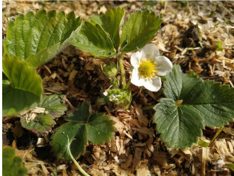
Slika 6. Cvijet jagode