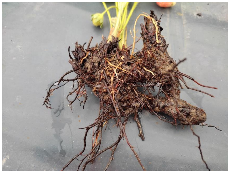
Slika 2. Korijen jagode

Na slici 2. prikazan je korijen, koji je podzemni vegetativni organ, razgranat i žiličast. Nalazi se u dubini od 15 do 25 centimetara. Korijen se sastoji od primarnih, sekundarnih i obrastajućih korijena, te korijenovih dlačica. Učvršćuje biljku, usvaja vodu i mineralne tvari iz tla (Maretić, 2014.).