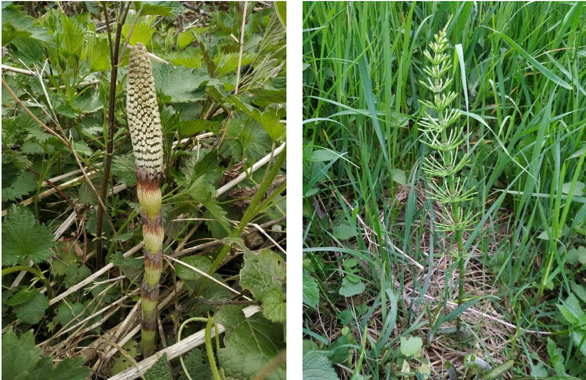
Slike 14. i 15. Fertilna i sterilna stabljika preslice