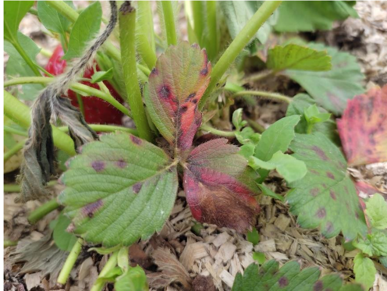
Slika 11. Crvena pjegavost lista jagode