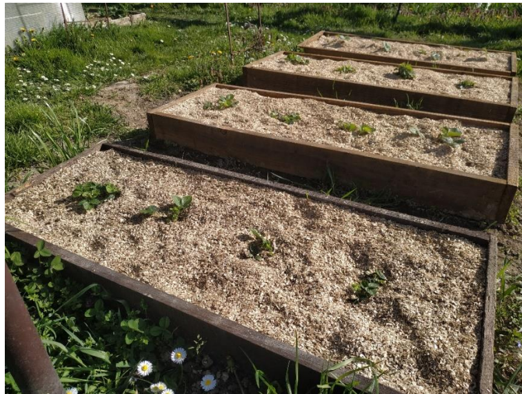
Slika 8. Piljevina korištena kao malč

Za uzgoj jagoda su najpogodnija humusno pjeskovito-ilovasta tla, tla dobro opskrbljena hranjivim tvarima, tla s dobrim vodozračnim režimom i tla kisele do neutralne reakcije (pH 4,5 - 6,5) (Krpina i sur., 2004.). Mogu se uzgajati i na siromašnijim tlima, ali urod će biti smanjen. Tla koja sadrže više od 60 % gline i preko 70 % pijeska su nepogodna za uzgoj. Od iznimne je važnosti držati korov pod kontrolom jer korovi oduzimaju biljci vodu i hranjive tvari. Oni se uništavaju pravilnom obradom tla ili pokrivanjem tla organskim materijalom koji se naziva malč. U pokusu je korištena piljevina kao malč i to je prikazano na slici 8.