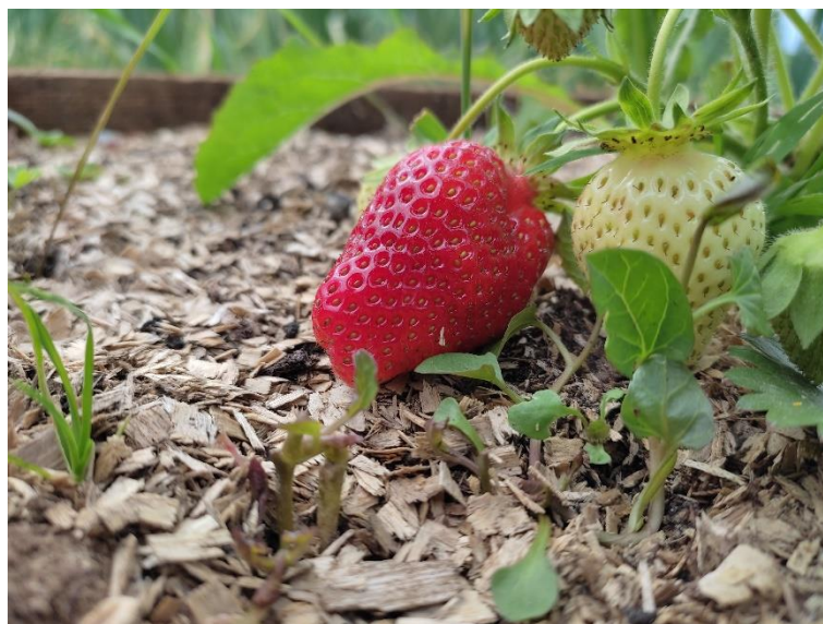
Slika 7. Plodovi jagode