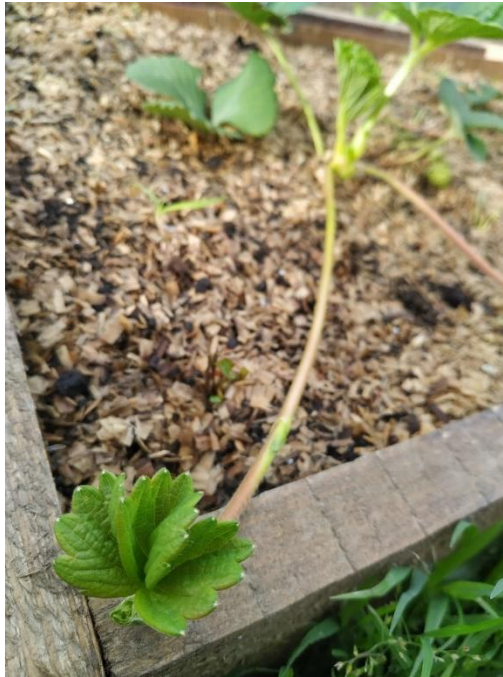
Slika 5. Vriježa jagode

Vriježa ili stolon je nadzemni puzeći izbojak. Vrlo je tanak, te dužine 1,5 metar kao što prikazuje slika 5. Služi za razmnožavanje jagoda (Maretić, 2014.).