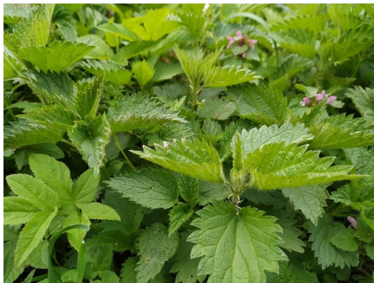
Slika 13. Listovi koprive

Cvjetovi koprive su neugledni, sitni, zelenkasti i simetrični, te oblikuju grozdasti cvat. Kopriva, koja je prikazana na slici 13., cvate od svibnja pa do kraja rujna, ovisno o podneblju i mikroklimi staništa. Razmnožavanje se odvija pomoću sjemenki i podanaka (Sliepčević S., 2020.).