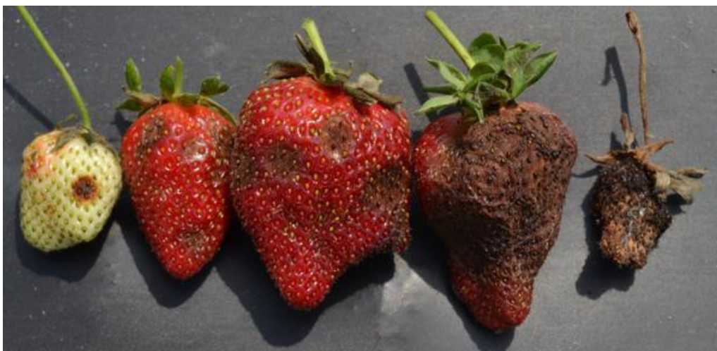
Slika 12. Antraknoza na plodovima jagode

Bolest se pojavljuje u obliku smeđih do crnih pjega na zelenim i zrelim plodovima. Iz pjega se razvijaju velike lezije, a u sredini lezija mogu se stvoriti narančaste spore u vlažnim uvjetima. U situacijama kada su visoke temperature, te je prisutan manjak vlage lezije su crnije, a plodovi se mogu osušiti i mumificirati. Plodovi mogu biti zaraženi u svim stadijima rasta kao što prikazuje slika 12. Na cvjetovima simptomi se javljaju u obliku paleži, a na lišću se javljaju u obliku malih, crnih pjega ili lezija koje zahvaćaju i peteljke lista (Louws i sur., 2014.).