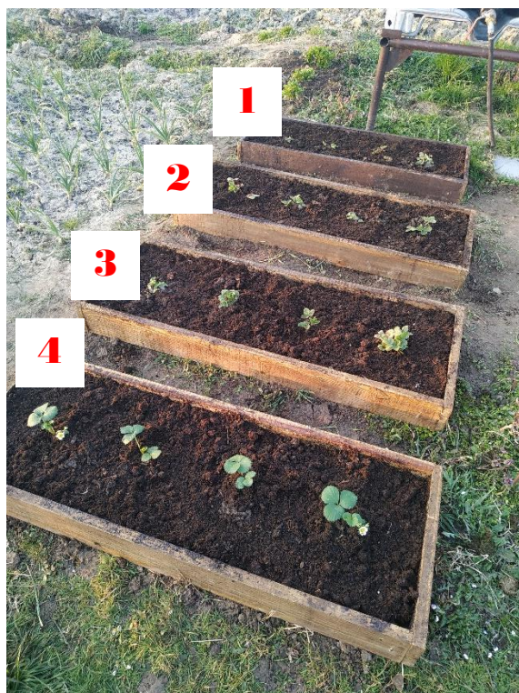
Slika 20. Kontrolne i tretirane jagode

Održavanje vlage je od izrazite važnosti za jagode jer ne podnose sušu pa je potrebno zalijevanje ili navodnjavanje svaki dan kod iznimnih vrućina, te svaki drugi dan kod optimalnih temperatura zraka. Korištenje prirodnog malča pridonosi održavanju potrebne vlage. U pokusu je piljevina korištena kao malč.