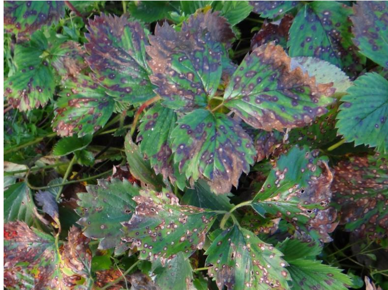
Slika 9. Obična pjegavost lista jagode

Ako dođe do velike zaraze takvi listovi se osuše i otpadnu. Svi navedeni simptomi nastaju pri temperaturama od 20 do 25 °C, te se mogu razlikovati ovisno o sorti jagode i soju patogena (Louws i sur., 2014.).