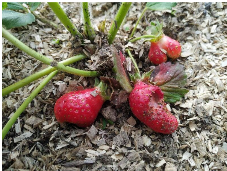
Slika 23. Deformirani plodovi jagode