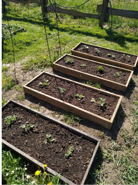
Slika 19. 4 gredice, 16 sadnica jagoda

Za njegu i zaštitu jagoda je korišten biljni pripravak od koprive i preslice. Pripravak je korišten jednom tjednom, ali su tretirane samo dvije gredice. 8 sadnica je zalijevano s pripravkom, a ostalih 8 sadnica je zalijevano običnom vodom. Slika 20. prikazuje 4 gredice pod brojem 1., 2., 3. i 4. Prva i treća gredica su zalijevane biljnim pripravkom jedanput tjedno, ostale dane vodom, dok su druga i četvrta gredica zalijevane samo vodom.