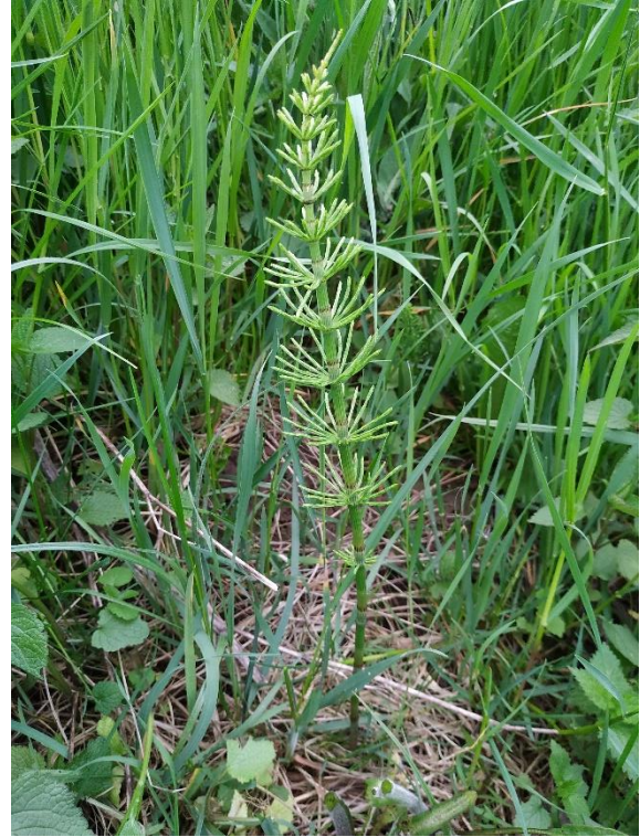
Slike 14. i 15. Fertilna i sterilna stabljika preslice