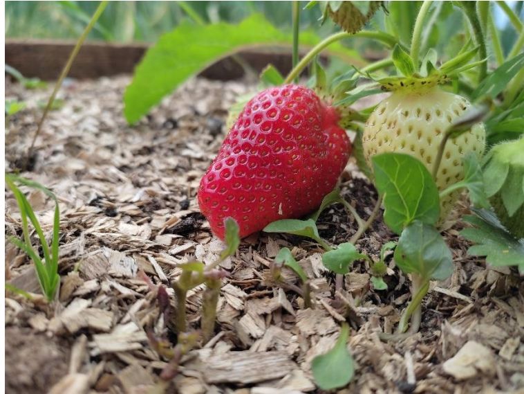
Slika 7. Plodovi jagode