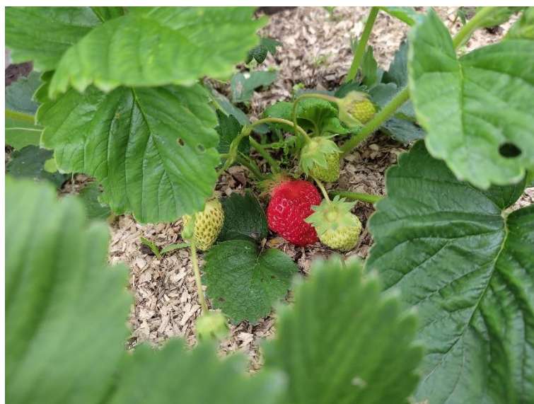
Slika 16. Sorta Queen Elisa

Biljka je srednje bujnog rasta s dosta listova, ujednačenog oblika grma. Listovi su srednje veliki do veliki, nazubljeni, svijetlo zelene boje. Cvjetovi se nalaze na istoj razini s listovima ili neposredno ispod, a na stapki se nalazi 5 - 8 cvjetova srednje veličine. Cvate ranije nego većina sorti jagoda. Plod je srednje veličine, stožastog do tupo stožastog oblika, te je ujednačene veličine do konca berbe ( http://pinova.hr ).