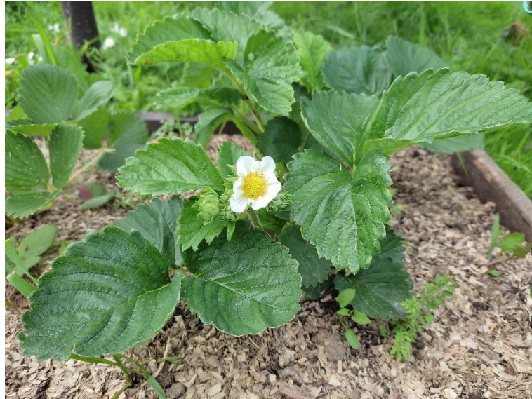
Slika 1. Grm jagode