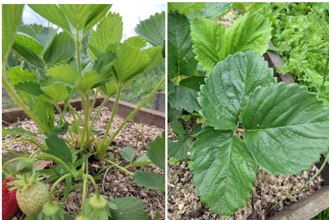
Slika 3. i 4. Stabljike i trodijelni list jagode

List jagode je složene građe. Sastoji se od lisne osnove, lisne drške i liski, najčešće je riječ o trodijelnom listu kao što prikazuje slika 4. Boja listova može biti od žutozelene do tamnozelenene, a oblik također varira. Na jednoj biljci se može nalaziti i do 100 listova, ali najčešće je riječ o 20-40 listova. U listu se odvijaju važni fiziološki procesi kao što je fotosinteza, respiracija, transpiracija itd. (Maretić, 2014.).