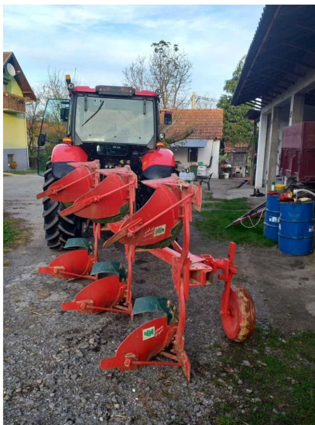
Slika 15. Plug VogelNoot L 950