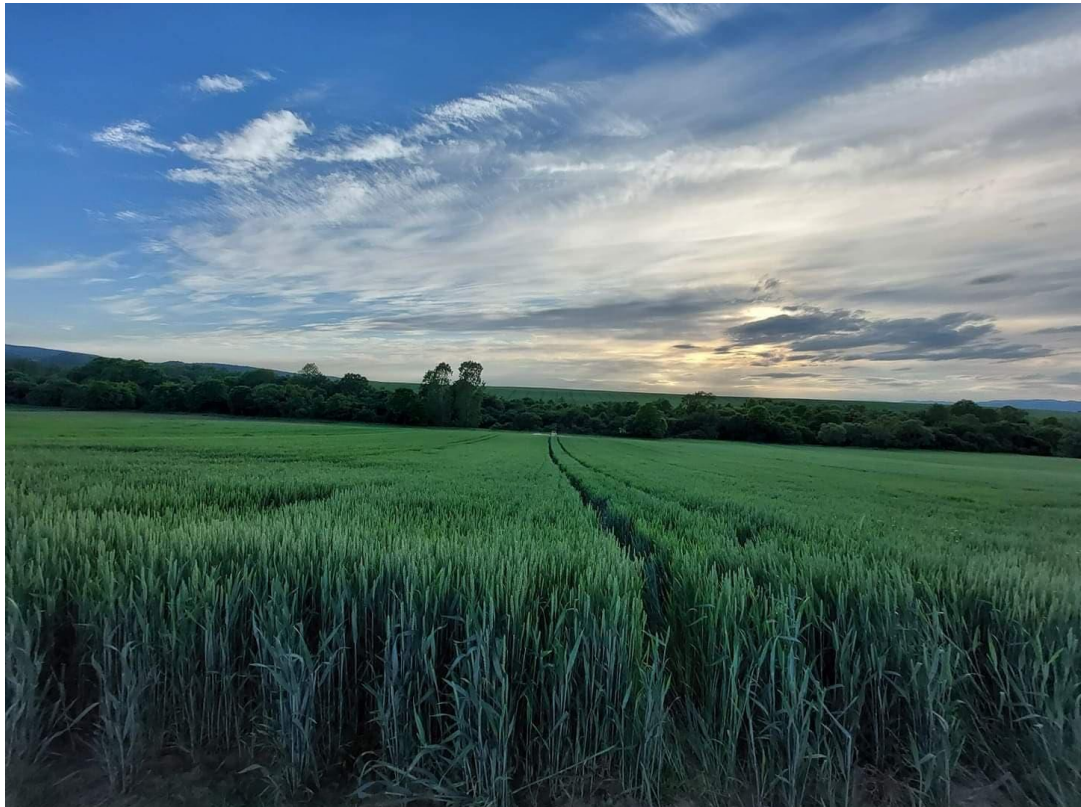
Slika 17. Pšenica u klasanju

Sorta Kraljica (Slika 17) najraširenija je ozima sorta pšenice u Hrvatskoj iz grupe srednje ranih sorti. Visokorodna je sorta koja u velikoj mjeri objedinjuje rodnost i kakvoću – genetski potencijal rodnosti veći je od 11 t/ha, A2 farinografske kvalitetne grupe, prema kakvoći nalazi se u I. razredu, sadržaj vlažnog ljepkva iznosi 28%. Morfološki gledano prosječna visina stabljike iznosi 75 cm, hektolitarska masa je oko 81 kg/hl, a masa 1000 zrna u prosjeku iznosi 40 grama. Otporna je na niske temperature i najrasprostranjenije bolesti pšenice te tolerantna na polijeganje. Optimalni rok sjetve je od 10. do 25. listopada s 500 do 650 kljavih zrna/m 2 .