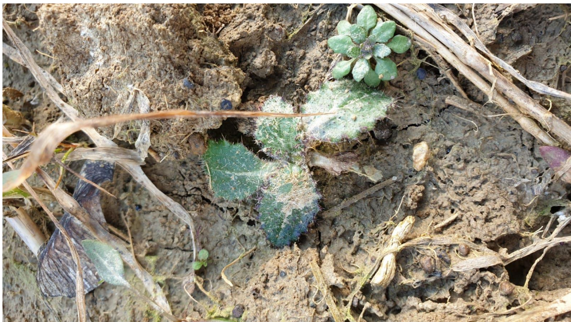
Slika 4. Klijanci poljskog osjaka

Poljski osjak ( C. arvense ) je višegodišnja zeljasta biljka iz porodice glavočika (Asteraceae). Može narasti i do dva metra visine. Podanak joj je puzav i sadrži mnoštvo pupova. Stabljika je uspravna, bridasta i razgranjena u gornjem dijelu. Listovi su naizmjenični, eliptični do lancetasti te prekriveni mnogobrojnim bodljama (Slika 4.).