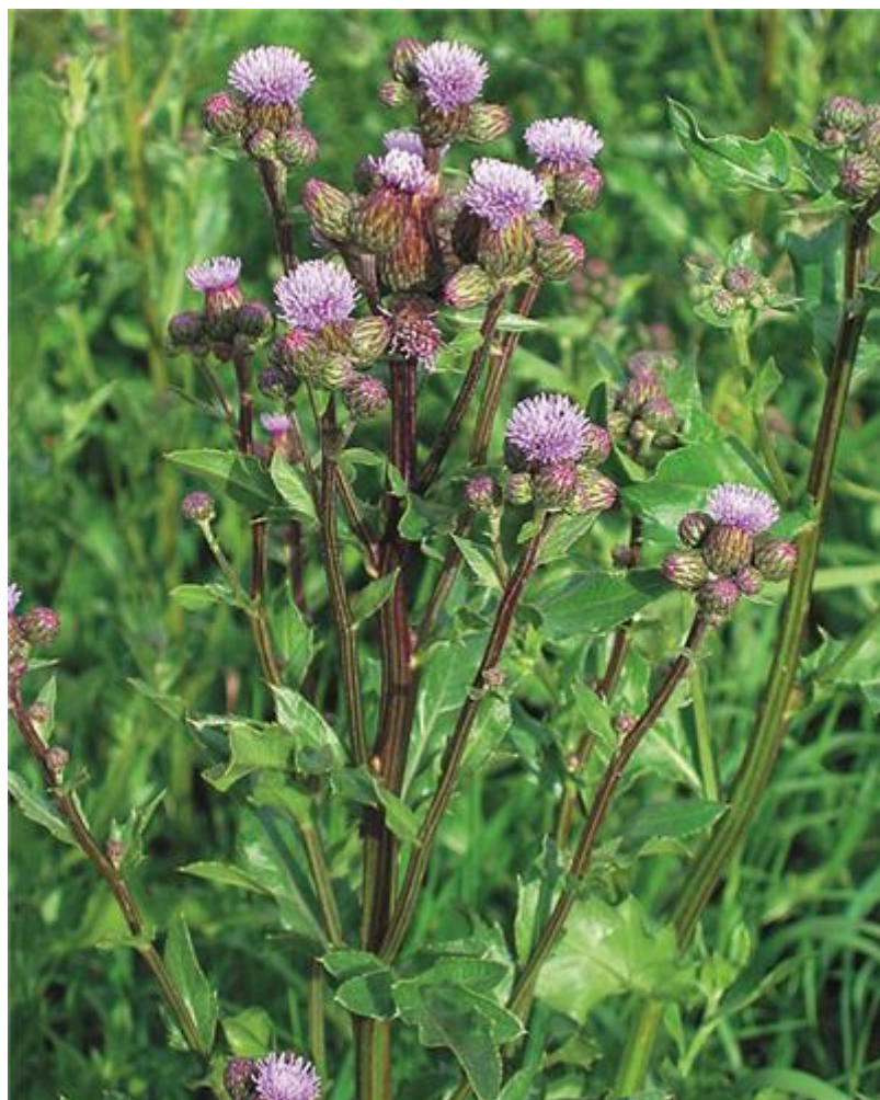
Slika 5. Cvjetovi poljskog osjaka

Može se koristiti kao ljekovita i medonosna biljka. Samo u ranoj fazi porasta može služiti kao stočna ispaša jer u kasnijim fazama biljka razvija grube i bodljikave izdanke.