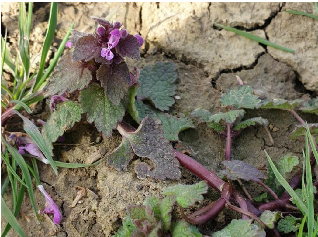
Slika 8. Grimizna mrtva kopriva

Grimizna mrtva kopriva ( L. purpureum ) (Slika 8.) je jednogodišnja do dvogodišnja biljka iz porodice usnača (Lamiaceae). Korijen je razgranat, stoga se uz glavni korijen razvija brojno bočno korijenje. Stabljika joj je uspravna, četverobridna, šuplja s dugim donjim internodijima, naraste do 25 (30) centimetara visine. Listovi (Slika 9.) su joj dlakavi s gornje strane. Donji su listovi na peteljci dok su gornji bez peteljke (Knežević, 2006.).