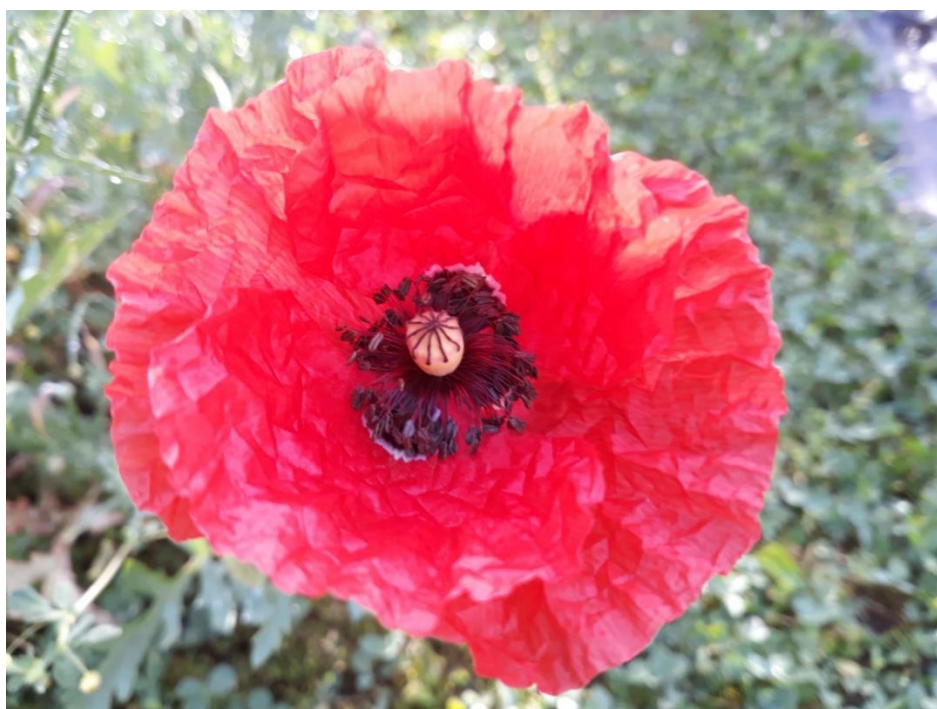
Slika 11. Poljski mak u fazi cvjetanja