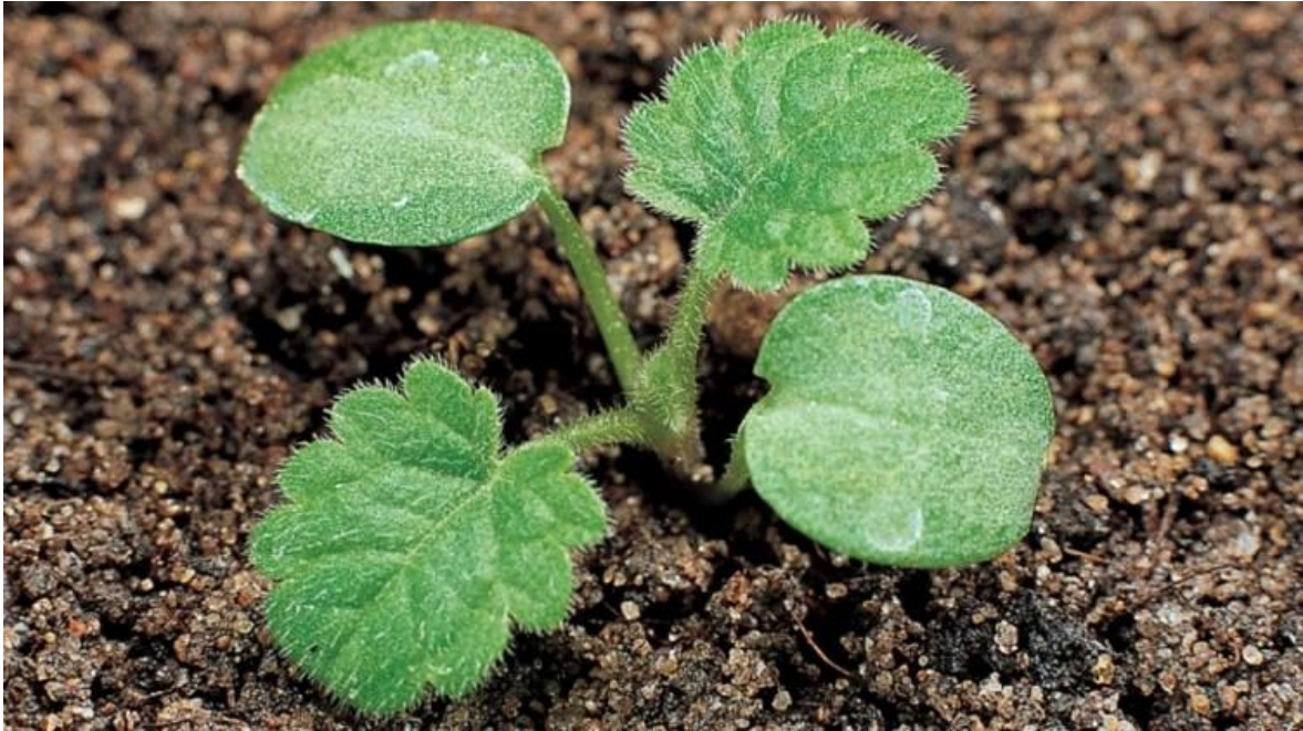
Slika 9. Klijanac grimizne mrtve koprive