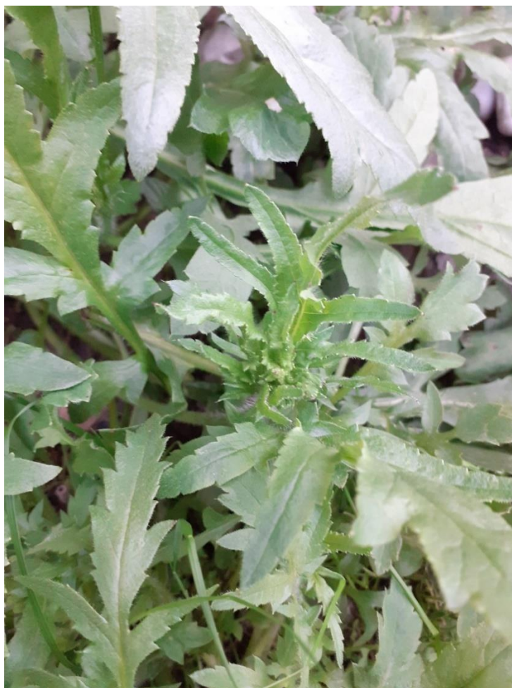
Slika 10. Poljski mak u početnom porastu