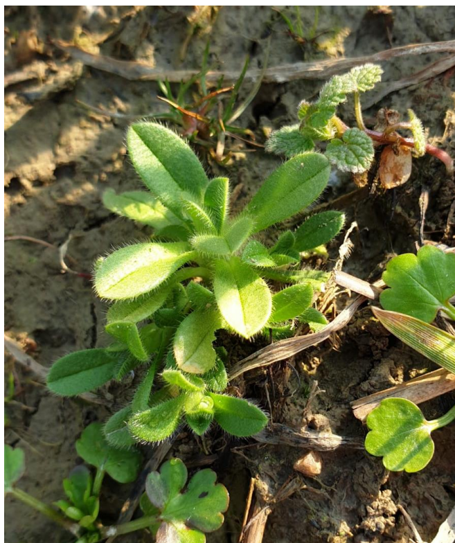
Slika 2. Stariji klijanac C. glomeratum

Klupčasti rožac ( C. glomeratum ) je jednogodišnja, ozima biljka iz porodice karanfila (Caryophyllaceae). Stabljika je uspravna, dlakava i razgranjena te niskog rasta, visine 10 – 30 cm. Listovi (Slika 2.) su uspravni, nasuprotni, dugi do 2,5 centimetra i također su prekriveni dlačicama.