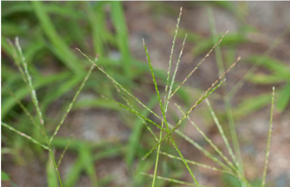
Slika 7. Cvat ljubičaste svračice

Trava je osrednje do loše krmne vrijednosti. Može se koristiti kao pokrov za sprječavanje erozije tla. Pelud može izazvati alergije kod ljudi.