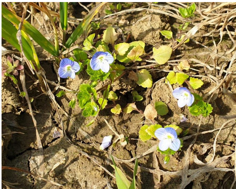
Slika 12. Perzijska čestoslavica u usjevu

Perzijska čestoslavica ( V. persica ) je jednogodišnja do dvogodišnja biljka iz porodice zijevalica (Scrophulariaceae). Stabljika joj je djelomično polegla, često je od osnove razgranjena i uzdignuta te prekrivena dlakama (Slika 12.).