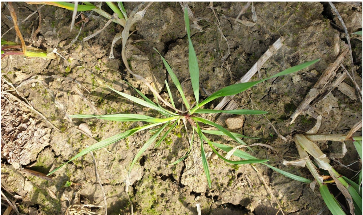
Slika 6. D. sanguinalis

Ljubičasta svračica ( D. sanguinalis ) je jednogodišnja biljka iz porodice trava (Poaceae). Stvara mnogobrojne vlati duge čak i do 65 centimetara. One često mogu biti priljubljene uz tlo ili su uzdižuće (Slika 6.). Plojke listova su zelene do blago ljubičaste boje te prekrivena dlakama i na licu i naličju.