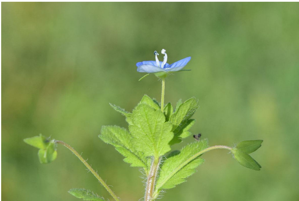
Slika 13. Gornji dio stabljike perzijske čestoslavice

s osrednjom razinom humusa i umjereno kisele reakcije. Razmnožava se sjemenom. Kao krma nema nikakvog značaja. Koristi se kao medonosna biljka.