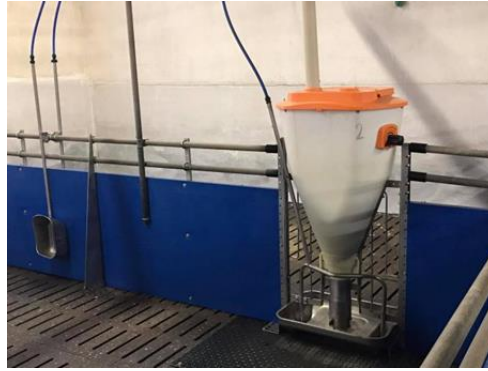
Slika 11. Pojilica i hranilica u tovilištu na poljodjelskom obrtu Srijem u Iloku