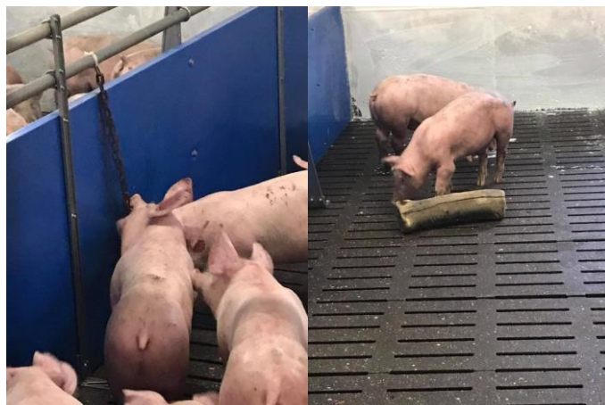
Slika 13. Igračke za svinje u tovilištu na poljodjelskom obrtu Srijem u Iloku