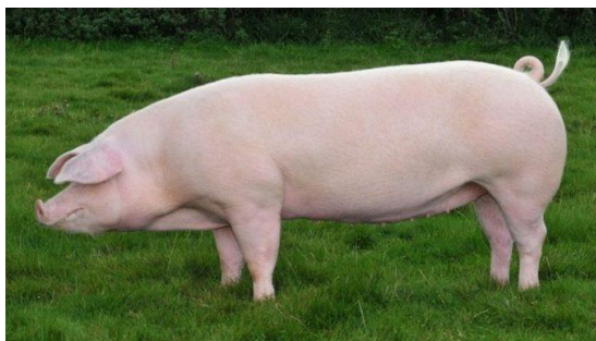
Slika 1. Danski landras

Danski landras je srednja do velika pasmina svinja nastala križanjem domaće danske dugouhe svinje i velikog jorkšira. Ova pasmina ima dug vrat, malu i laganu glavu sa teškim i položenim ušima. Trup joj je dug, a u kranijalnom dijelu uži nego u kaudalnom. Leđna linija je ravna, srednje širine. Plećke su joj slabije razvijene, a butovi su snažni i mesnati. Plodnost je 10 – 12 prasadi u leglu. Danski landras je zrazito dobra pasmina za proizvodnju tovljenika, jer ostvaruje visoke proizvodne rezultate u tovu.