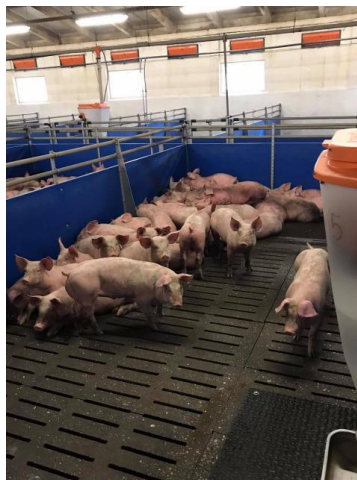
Slika 12. Rešetkasti podovi u tovilištu na poljodjelskom obrtu Srijem u Iloku