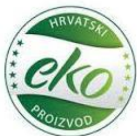
Slika 1. Oznaka hrvatskog eko proizvoda

Hrvatsko tržište ekološke hrane je slabo razvijeno i značajno zaostaje za razvijenim zapadnoeuropskim tržištima. Distribucijski kanali ekološke hrane, a tako i povrća, u Hrvatskoj suženi su ekološkim proizvođačima jer je ekološka hrana vrlo slabo zastupljena u lancima supermarketa koji predstavljaju osnovni oblik prodaje proizvoda. Naime, zbog velike promjene u prinosima između godina te malih proizvodnih kapaciteta (potražnja veća od ponude) ekološki proizvođači su prisiljeni na prodaju svojih proizvoda na tržište izravnom prodajom ili preko prodavaonica zdrave hrane. (Ivanišević, 2016.). Da bi se tržište ekoloških prehrambenih proizvoda jače razvilo prioritet hrvatskim proizvođačima ekološke hrane je ulazak u najznačajnije lance supermarketa. Ulaskom u lance supermarketa proizvođači bi stekli značajan prodajni kanal, a potrošačima bi ekološka hrana postala dostupnija nego što je trenutno. Nažalost, mnogi potrošači i dalje ne znaju prepoznati ekološki proizvod. Upravo zbog toga donešena je odluka potrebe znaka hrvatskog ekološkog proizvoda. (slika 1.).