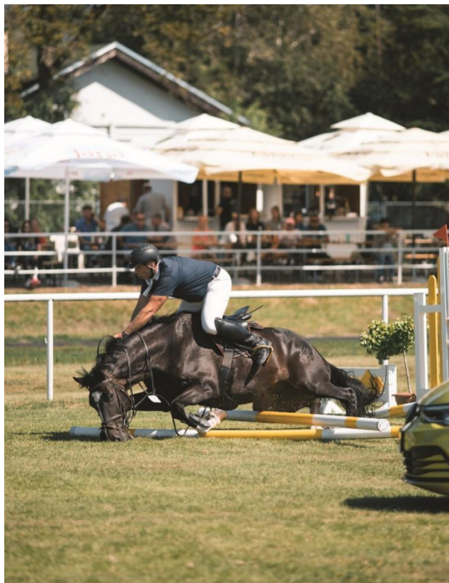
Slika 1. Prikaz pada na preponi

Ruptura ovog mišića je rijetka pojava kod konja, a može nastati nakon traume prednjeg dijela tijela, obično vrata i područja grebena. Do rupture ovog mišića najčešće dolazi nakon skakanja preko previsoke prepreke te nakon ruptore grudni koš propada što se lako uočava po stavu životinje. S obzirom na intenzivnu bol koju prouzrokuje ova ruptura, apliciraju se NSPUL (lokalni nesteroidni protuupalni lijekovi), a životinja bi trebala kroz 30 do 45 dana mirovati. Ukoliko je u pitanju potpuna ruptura mišića, prognoza je loša (Radišić, 2010.).