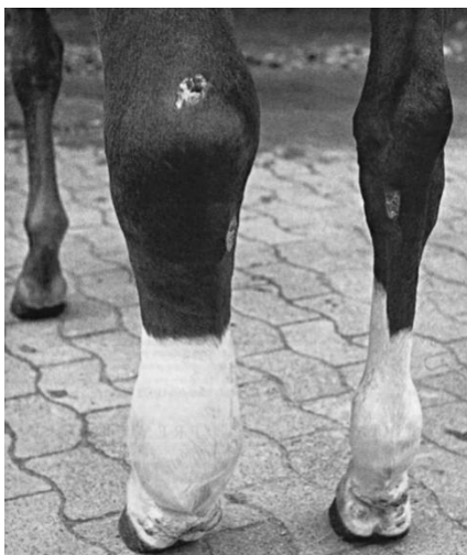
Slika 7. Prikaz jasno izražene otekline noge konja

ozljeđivanja konja potrebno je poznavati konja, pratiti kada i koliko je bio bolestan ili ozljeđen na natjecanjima ili tijekom treninga, redovito pregledavati konja i obraćati pažnju na njegovu fizičku spremnost (Brkanac, 2018.).