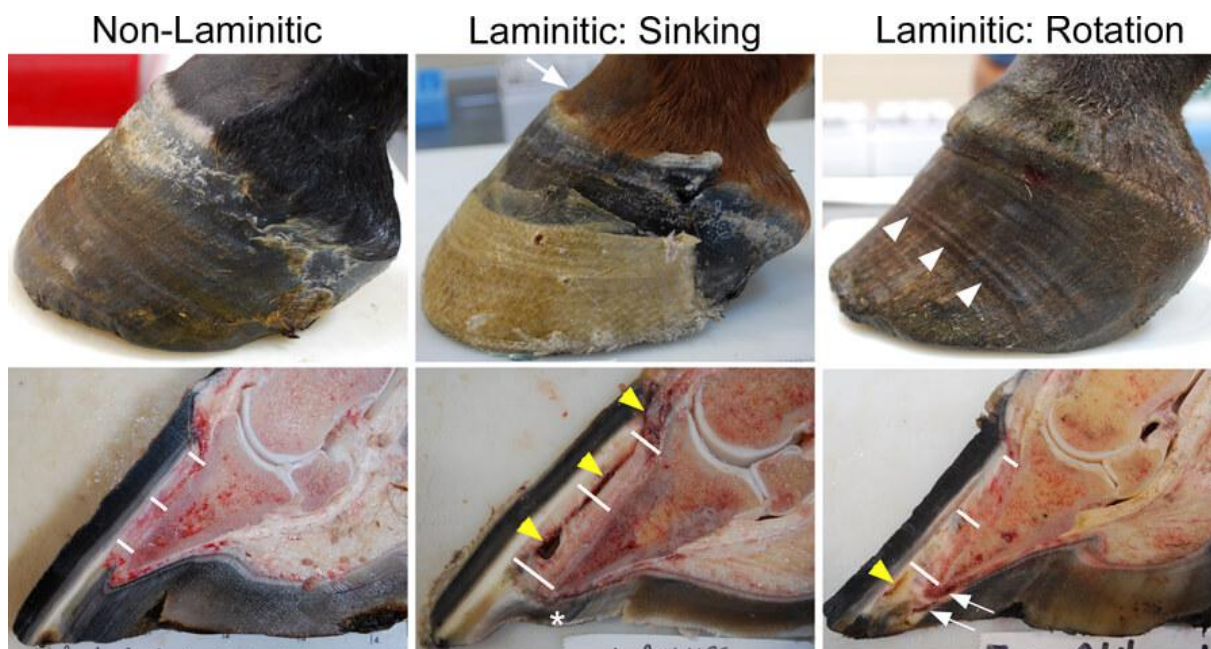
Slika 6. Prikaz presjeka izgleda zdravog kopita i kopita zahvaćenog laminitisom

Laminitis kod konja koji se koriste u daljinskom jahanju može nastati i zbog potresa mozga. Pokazalo se kako krioterapija smanjuje težinu akutnog laminitisa, a neki treneri i jahači lede noge konja između treninga kako bi spriječili laminitis (Radišić, 2010.). Ukoliko dođe do laminitisa za učinkovito liječenje je važno što prije postaviti točnu dijagnozu. Znakovi laminitisa čestu znaju biti nespecifični pa se najbolje koristiti različitim kliničkim metodama.