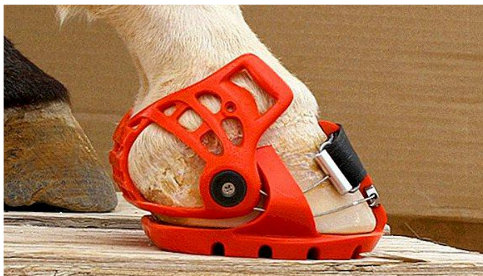
Slika 2. Prikaz ortopedske potkovice

U današnje vrijeme postoje mnoge vrste ortopedskih potkova, no među njima su najpopularniji modeli za korekciju hoda i potkove-stege (slika 2.) koje pomažu u fiksiranju polomljene kopitnice.