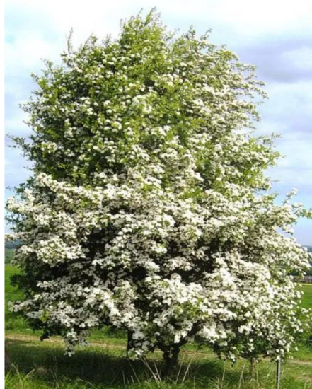
Slika 1. Drvo bijelog gloga

Bijeli glog (Slika 1.) pripada porodici Rosaceae (Domac, 2002.). Raste u Europi, Sjevernoj Africi i Zapadnoj Aziji. Bijeli se glog može pronaći i na drugim mjestima u svijetu, ali kao invazivnu vrstu. Obično raste kao grm ili malo drvo visine 5-10 m (Franjić i Škvorc, 2010., Hulina, 2011.). Njegovi mali tamnocrveni plodovi dozrijevaju sredinom jeseni te se također koriste u različite kulinarske svrhe kao što su pripreme džemova, sirupa, želea.