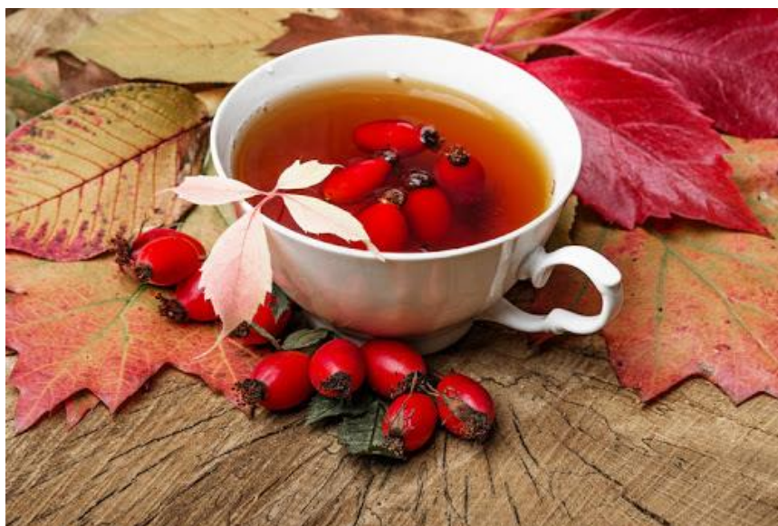
Slika 7. Čaj od šipka

Rimljani su od davnina spominjali kako divlja ruža pomaže kod bjesnoće, među njima je i rimski prirodoslovac Plinije. U srednjem vijeku koristio se često čaj od divlje ruže kod pojedinih zaraznih bolesti te za liječenje upale pluća. Poboljšavanje razvoja otpornosti protiv daljnjih oboljenja od zaraznih bolesti i dobro napredovanje u smanjenju tegoba pripisuje se velikim količinama vitamina C. Kasnije se koristila kao blago sredstvo za čišćenje crijeva (grupa autora, 2008.). Divlja ruža djeluje blago diuretiki, odnosno potiče izlučivanje tekućine. Također djeluje i kao blagi purgativ zbog voćnih kiselina i pektina. Čaj koji dobivamo od divlje ruže koristimo kod upalnih procesa bubrega, a i sprječavanja daljnjih upalnih procesa. Kod osoba koje su podložne stvaranju bubrežnog kamenca preporučuje se dugoročno konzumiranje čaja. Šipkov čaj je zbog svog kiselkastog okusa idealno osvježeno kod osoba koje boluju od vrućice (slika 7.).