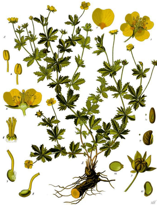
Slika 5. Upravna petoprsta

kraća od latica, a između njih se nalaze četiri manja listića. Prašnici su žute boje i ima ih oko 14-20. vrijeme cvatnje je od lipnja do rujna. Plod je jednosjemena glatka, rjeđe naborana orašica. Plodovi nisu jestivi, jajolikog su oblika i tamno maslinaste boje.