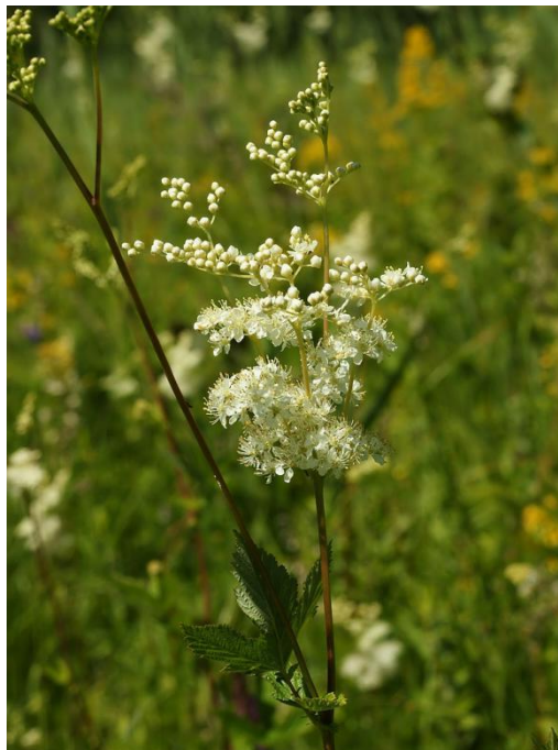
Slika 4. Prava končara

Prava končara ( Filipendula ulmaria (L.) Maxim) trajna je zeljasta biljka iz porodice Rosaceae (Domac, 2002.). Rasprostranjena je na područjima zapadne Azije i Europe (Slika 4.). Raste na vlažnim livadama uz obale rijeka, uz rubove jaraka, uz potoke, rijeke, bare, itd. Uspijeva i do 1300 m nadmorske visine. Latinsko ime roda Filipendula potječe od riječi filum (konac) i pendulus (viseći) jer gomolji izgledaju kao da vise na koncu. S druge strane ime vrste ulmaria dano je zbog sličnosti listova s brijestom ( Ulmus ) (Nikolić i Kovačić, 2008.).