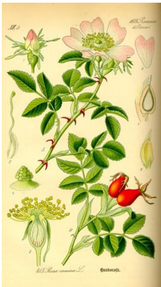
Slika 6. Divlja ruža

cvjetovi su veliki 2 – 8 cm, krupni, ugodnog mirisa i lijepog izgleda, nalaze se pojedinačno ili skupljeno po 2 - 5 cvjetova (Slika 6.). Ocvjeće je dvostruko, građeno od pet listića čaške koja je širine je 3 – 5 mm. Listići čaške su svi međusobno srasli, na rubovima žljezdasto dlakavi, a na kraju cvatnje se povijaju unazad. Pet ružičastih ili bijelih srololikih međusobno slobodnih latica dužine 1 – 3 cm predstavlja vjenčić. Mnogobrojne plodnice i prašnici cvatu od svibnja do srpnja. Plod je šipak, jajolikog oblika, narančasto crvene boje, slatko-kiselog okusa, nalazi se na goloj stapci (Kojić, 1988.). Dozrijeva u rujnu i listopadu.