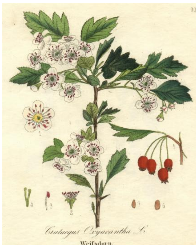
Slika 2. Bijeli glog

Glog je dikotiledonska biljka koja uobičajeno raste kao grm ili malo drvo visine 5-10 m s gustom krošnjom. Kora je smeđe boje s okomito poredanim narančastim pukotinama. Na mlađim stabljikama možemo vidjeti oštre bodlje dužine 12,5 mm. Perasto raspoređeni listovi dugački su od 20 - 40 mm s mrežastom nervaturom. Listovi često variraju oblikom, mogu biti jajolikih ili zupčastih rubova (Slika 2.). Lice je lista tamnozeline sjajne boje dok je naličje nešto svjetlije. Bijeli glog se razlikuje od crvenog po listovima koji su dublje urezani nego kod crvenog gloga i manje su sjajni. Cvjeta kasnije od crvenog gloga, ima bijele cvjetove i crvene prašnike (Lesinger, 2006.) Cvijet je promjera oko 10 mm te se sastoji od pet bijelih latica i brojnih crvenih prašnika. Cvjetovi su skupljeni u guste kitice na kraćim ili duljim peteljčkama. Plodovi su manji, do 8 mm, lijepe tamnocrvene boje, a koštunica sadrži samo jednu sjemenku. Uglavnom su okruglog ili jajolikog oblika (Kojić, 1988., Hulina, 2011.).