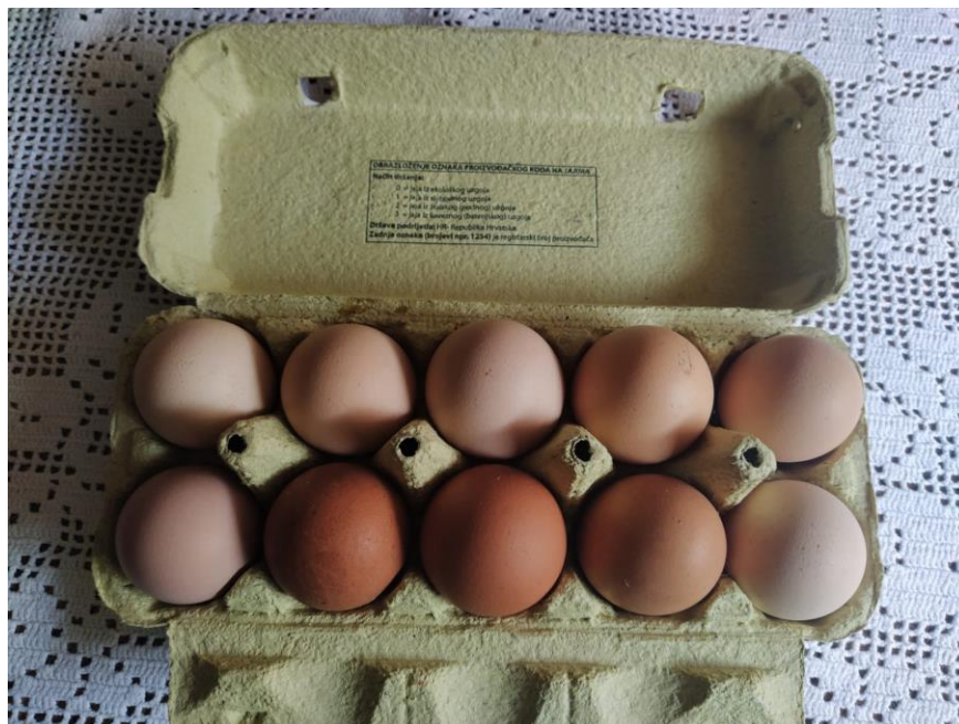
Slika 5. Pakiranje jaja od 10 komada