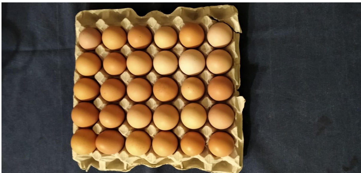
Slika 6. Pakiranje jaja od 30 komada