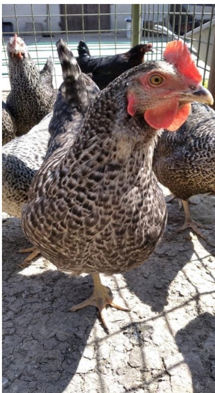
Slika 2. Prelux grahorasta nesilica