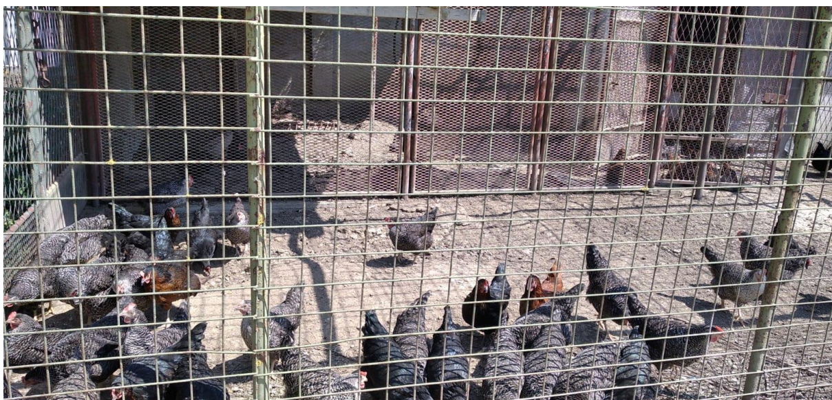
Slika 4. Vanjski kavezi

Sljedećom slikom će biti prikazan vanjski dio kaveza u kojem kokoši provode veći dio dana.