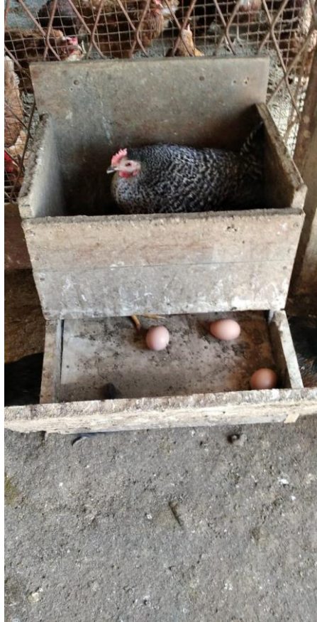
Slika 3. Gnijezdo i odjeljak za snešena jaja