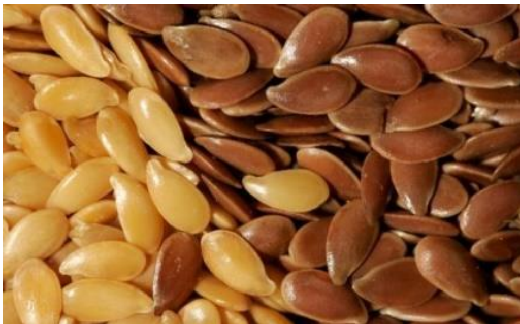
Slika 9. Sjeme lana