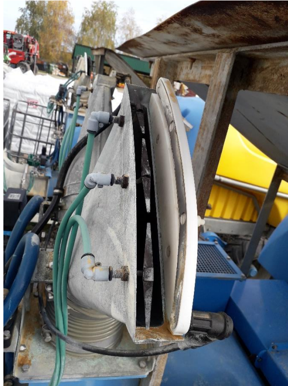
Slika 6. Elektrostatski raspršivač