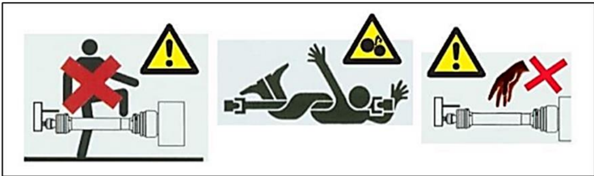
Slika 19. Oznaka opasnosti od kardanskog vratila