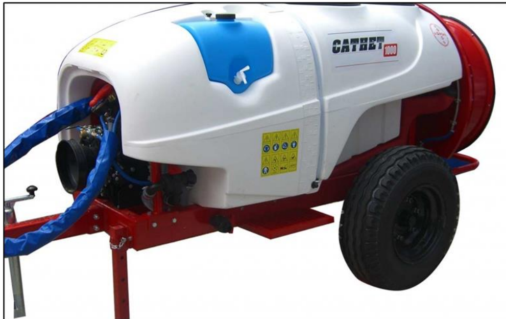
Slika 1. Spremnik raspršivača