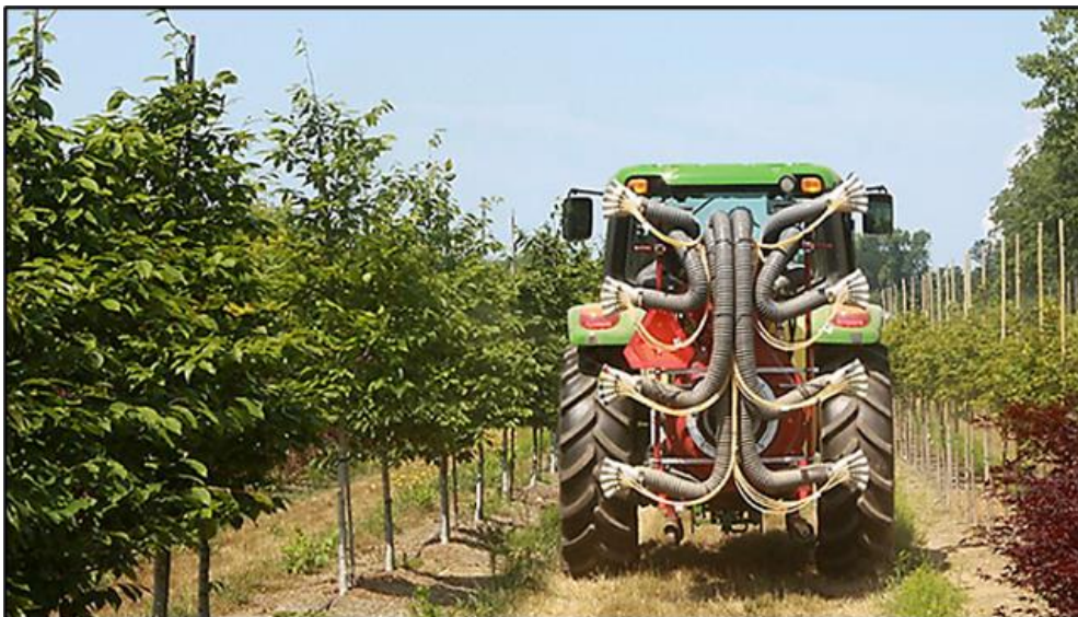
Slika 14. Raspršivač sa laserski sensorom za navođenje mlaza

raspršuju prazne površine između biljaka, te se posebno tretiraju samo bolesna stabla (Pozder i sur., 2018.). Raspršivač sa laserskim sensorom za navođenje mlaza, prikazan na slici 14., a smatra se novim sustavom među selektivnim raspršivačima. Raspršivač sa laserskim sensorom koristeći se laserom usmjerava mlaz kapljica prema krošnji koja je uzgojnog oblika. Opisivani raspršivač posjeduje sposobnost prepoznavanja veličine, oblika i gustoće tretirane krošnje i u istom trenutku izračunava i primjenjuje potrebnu količinu zaštitne tekućine. Sastoji se od: laserskog senzora s radarskim sensorom brzine, računala i zaslona osjetljivog na dodir, automatskog regulatora za protok na mlaznicama, ručnih prekidača, razdjelnica, mlaznica i cijevi. Primjenom raspršivača sa laserskim sensorom za navođenje mlaza smanjilo se korištenje zaštitne tekućine u rasponu 40-70 %, te se smanjio drift do 90 % (Pozder i sur., 2018.).