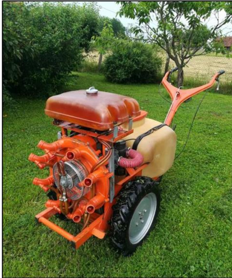
Slika 12. Samohodni raspršivač