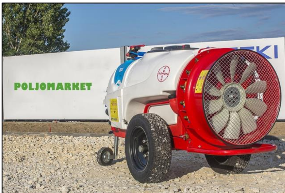
Slika 8. Aksijalni ventilator na vučenom raspršivaču