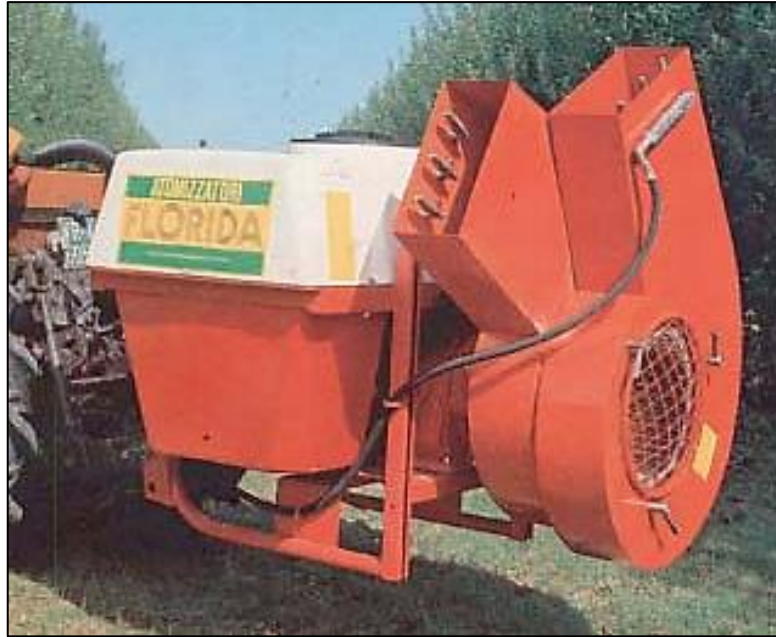
Slika 9. Radijalni ventilator