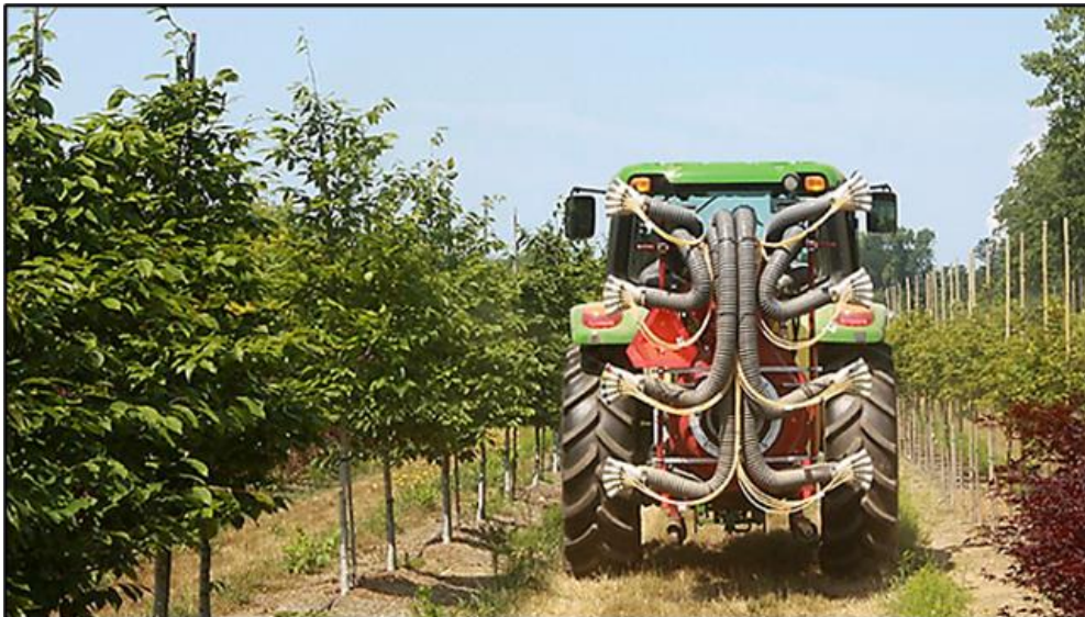
Slika 14. Raspršivač sa laserski sensorom za navođenje mlaza

raspršuju prazne površine između biljaka, te se posebno tretiraju samo bolesna stabla (Pozder i sur., 2018.). Raspršivač sa laserskim sensorom za navođenje mlaza, prikazan na slici 14., a smatra se novim sustavom među selektivnim raspršivačima. Raspršivač sa laserskim sensorom koristeći se laserom usmjerava mlaz kapljica prema krošnji koja je uzgojnog oblika. Opisivani raspršivač posjeduje sposobnost prepoznavanja veličine, oblika i gustoće tretirane krošnje i u istom trenutku izračunava i primjenjuje potrebnu količinu zaštitne tekućine. Sastoji se od: laserskog senzora s radarskim sensorom brzine, računala i zaslona osjetljivog na dodir, automatskog regulatora za protok na mlaznicama, ručnih prekidača, razdjelnica, mlaznica i cijevi. Primjenom raspršivača sa laserskim sensorom za navođenje mlaza smanjilo se korištenje zaštitne tekućine u rasponu 40-70 %, te se smanjio drift do 90 % (Pozder i sur., 2018.).