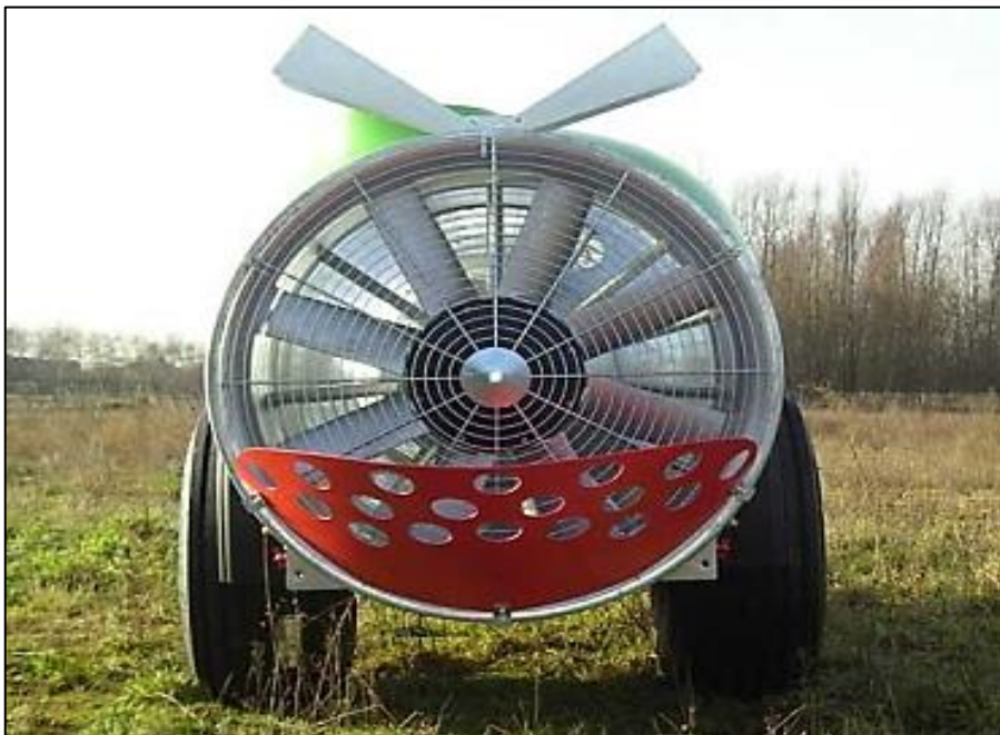
Slika 7. Aksijalni ventilator

Aksijalni ventilator je ventilator gdje ulazni zrak ide u smjeru vratila u radijalnom pravcu. Drugi naziv za aksijalni ventilator je "propelerni". Aksijalni ventilatori su češće korišteni od radijalnih ventilatora jer pružaju veću masu zraka prilikom manje izlazne brzine i manje troše pogonsku snagu (Bokulić i sur., 2015.). Aksijalni ventilator se sastoji od kućišta, lopatica i vratila što je prikazano na slici 7. Na slici 8. prikazan je aksijalni ventilator na vučenom raspršivaču. Volčević (2006.) navodi da aksijalni ventilatori najčešće posjeduju raspršivači sa klipnom ili klipno membranskom crpkom zbog visokog tlaka. Lopatice na rotoru su pričvršćene, ali su moguća zakretanja i ukošavanje. Na prednjoj strani ventilatora nalazi se zaštitna mreža, a u blizini rotora smješten je limeni usmjerivač koji orijentira zračnu struju u smjeru mlaznica. Iz aksijalnog ventilatora nastaje mlaz koji izlazi iz ovalnog otvora i poprima oblik lepeze. Lepezu nije lako prilagoditi biljkama s obzirom na smjer gustoće i dimenzije u procesu cirkulacijskog pokretanja zraka. Brzina zraka koji izlazi u prosjeku doseže vrijednosti od 20 do 50 m/s -1 , dok je masa zraka u prosjeku od 40 do 1200 m 3 /min -1 . Za pokretanje aksijalnog ventilatora potrebno je uobičajeno od 10 do 25 kW. Banaj i sur. (2010.) navode da se okretanje rotora sa lopaticama odvija brzinom od približno 2500 do 5000 min -1 .