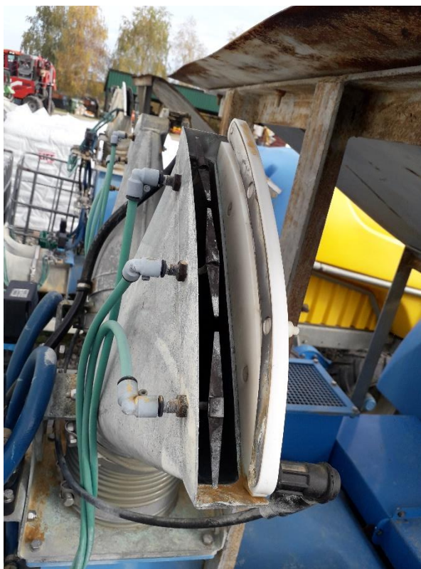
Slika 6. Elektrostatski raspršivač