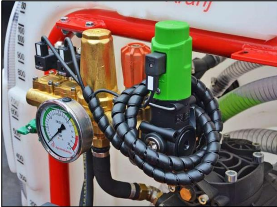
Slika 5. Uređaj za regulaciju