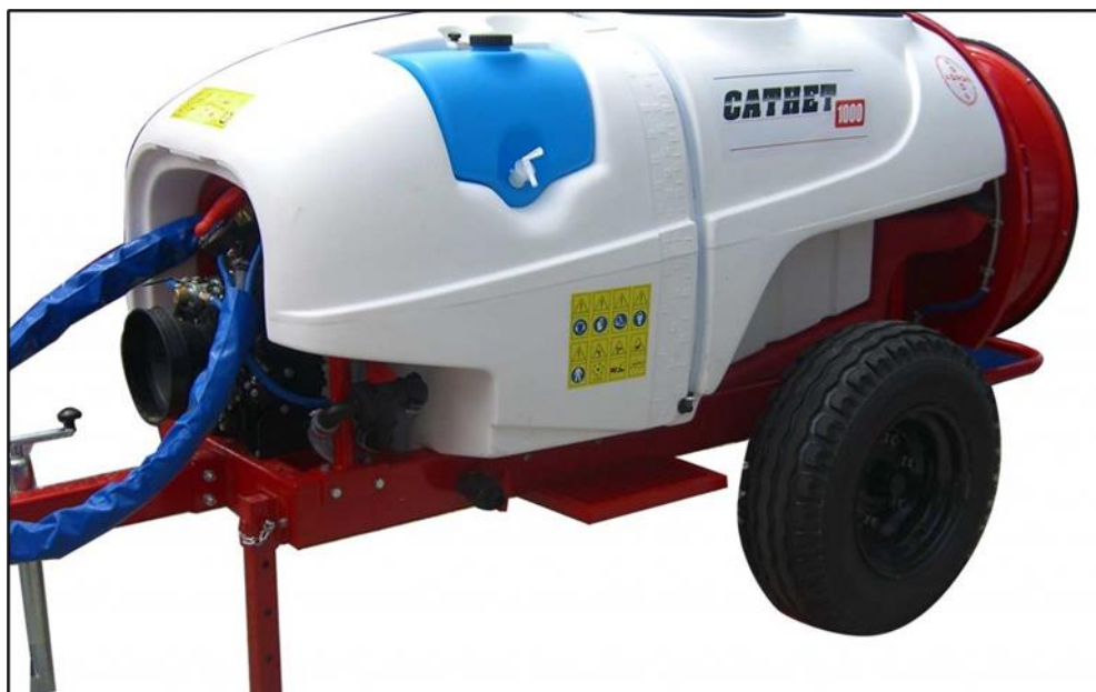
Slika 1. Spremnik raspršivača