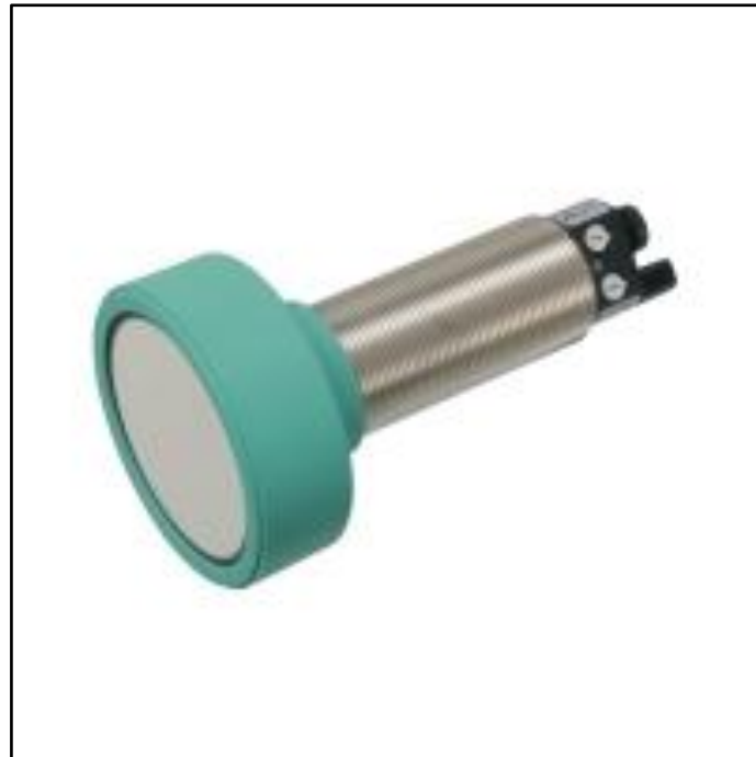
Slika 15. Ultrazvučni senzor

Ultrazvučni senzor može uočiti željeni objekt u udaljenosti raspona od 0,8 do 6 m i prazan prostor veličine od 35 do 120 cm (Sedlar i sur., 2014). Posebno je upotrebljiv i koristan u mladim nasadima i nasadima koštičavog voća jer posjeduju veći razmak među stablima. Korištenjem raspršivača sa ultrazvučnim senzorima za detektiranje prisutnosti stabla može se ostvariti ušteda zaštitne tekućine u rasponu od 30 do 50 % (Pozder i sur., 2018.).