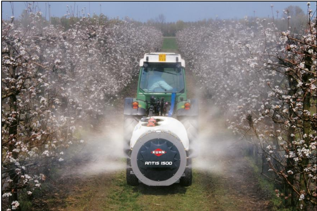
Slika 16. Standardni raspršivač