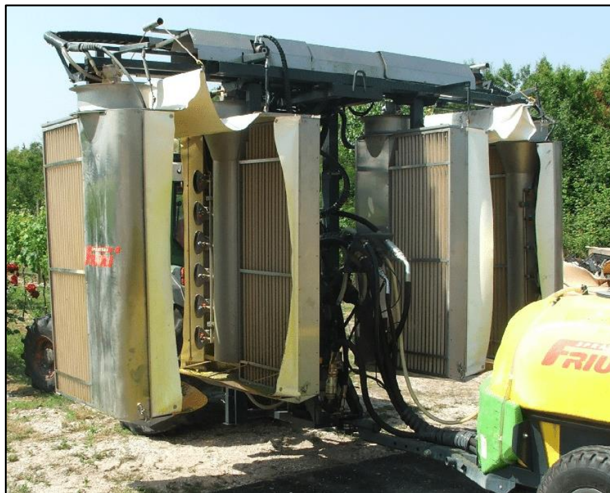
Slika 13. Tunelski raspršivač

Provedeno je istraživanje zaštite jabuka od čađave krastavosti korištenjem tunelskog raspršivača, a norma je 100 \text{ l ha}^{-1} . Ostvaren je rezultat od samo 2,8 % zaraženih listova i 0,5 % zaraženih plodova nakon izvršenog procesa (Sedlar i sur., 2014.). Drugo istraživanje provedeno je isto u nasadima jabuka kako bi se spriječila čađava krastavost, ali s normom 500 \text{ l/ha} korištenjem tunelskog raspršivača. Dobiveni su se isti rezultati kao kada bi se obavljao isti proces sa običnim raspršivačem s aksijalnim ventilatorom normom od 1500 \text{ l ha}^{-1} (Doruchowski, 1998.).