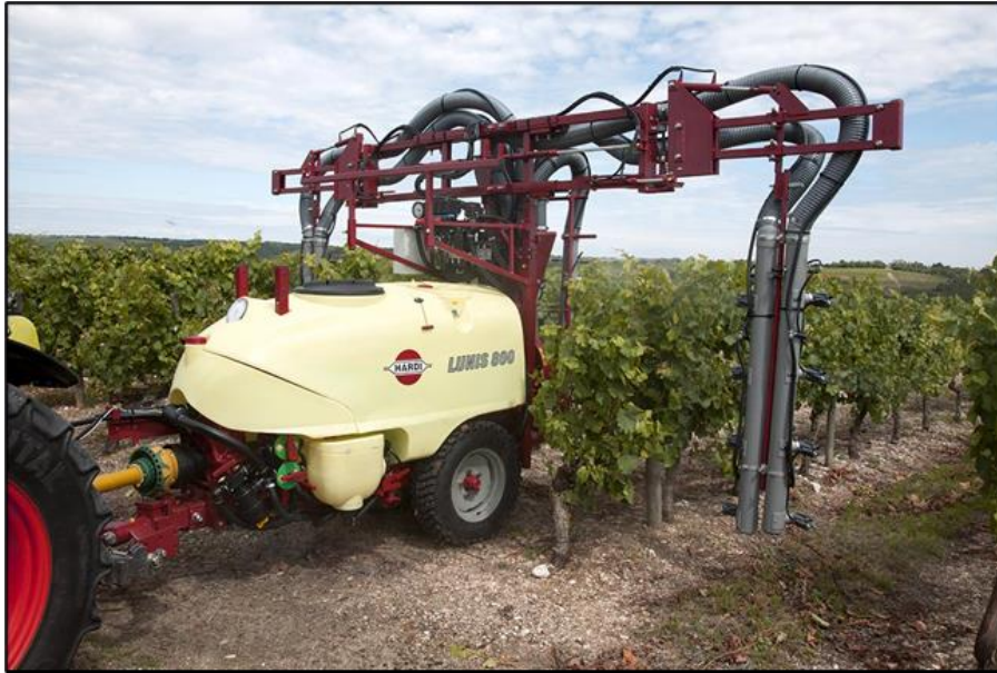
Slika 11. Traktorski vučeni raspršivač s radijalnim ventilatorom