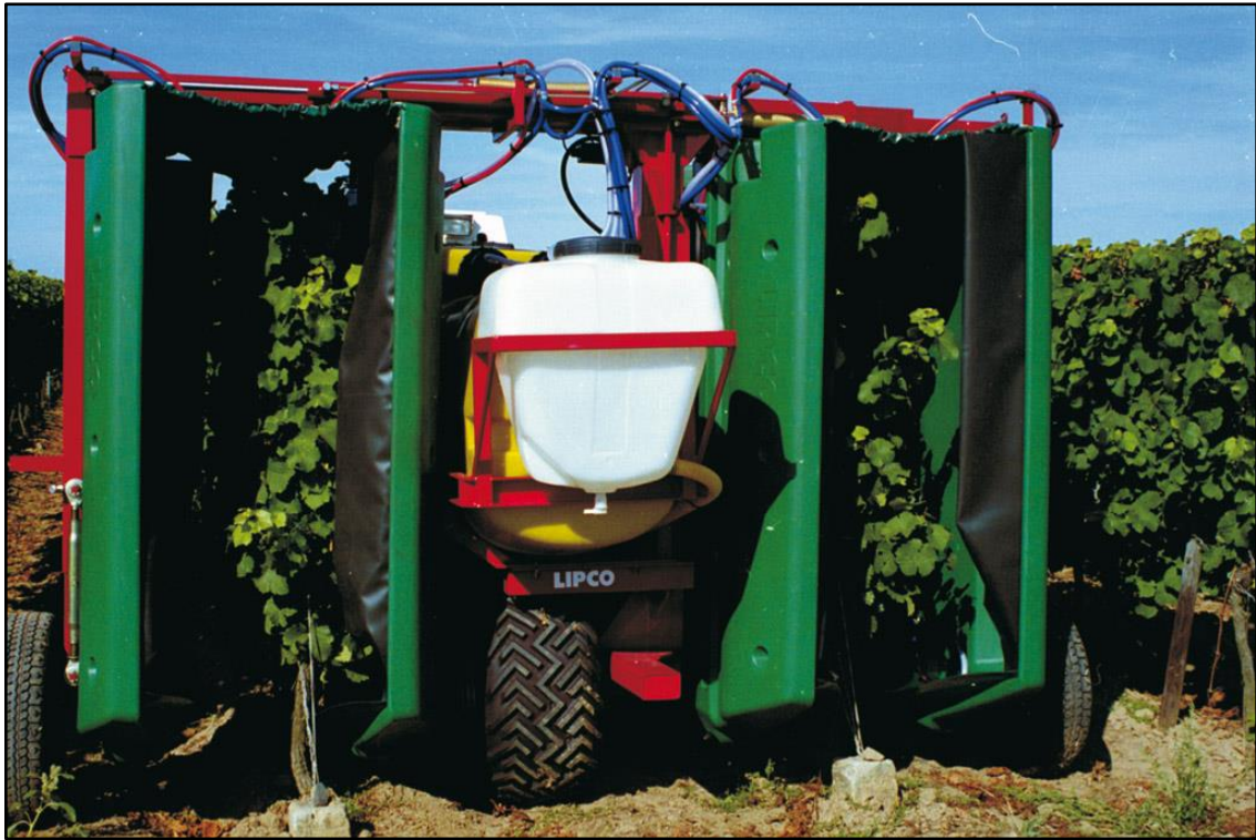
Slika 18. Raspršivač sa reciklirajućim sustavom