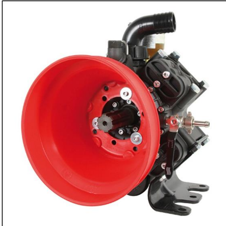
Slika 2. Klipno membranska crpka