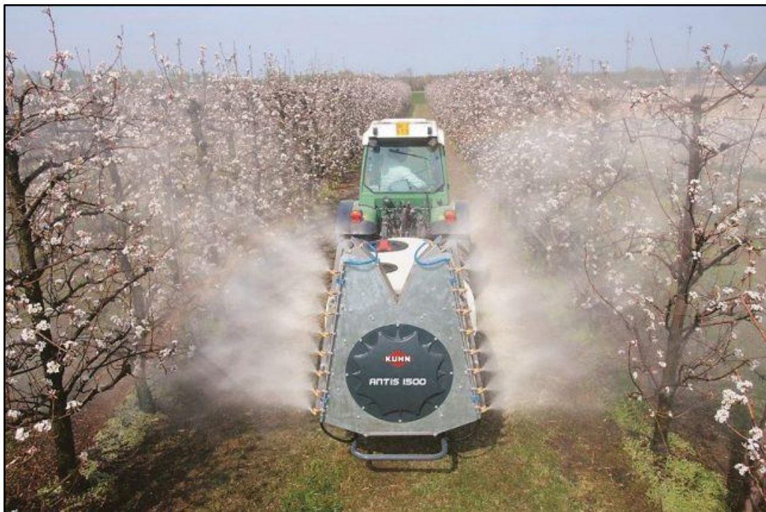
Slika 17. Poboljšani tip raspršivača