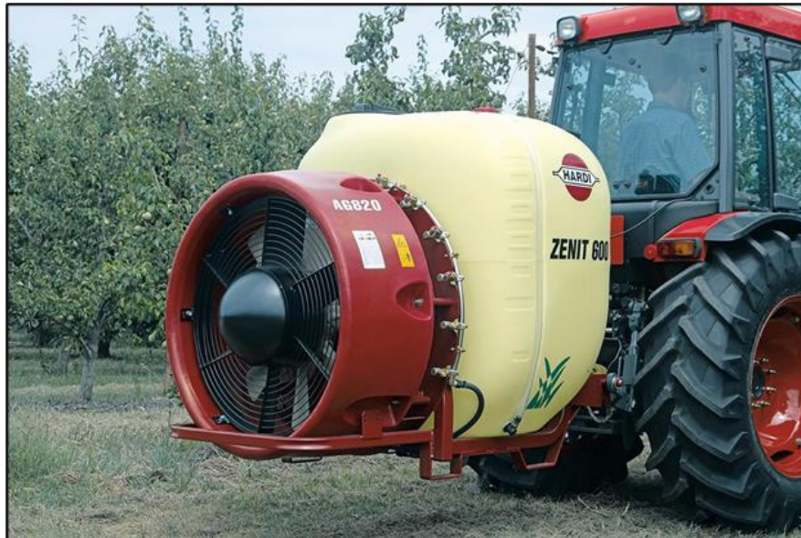
Slika 10. Traktorski nošeni raspršivač s aksijalnim ventilatorom

litara, a najčešće se koriste u manjim i srednjim trajnim nasadim. Većina nošenih raspršivača posjeduje aksijalni ventilator i okomiti usmjerivač paralelan sa nasadom. Na slici 10. je prikazan traktorski nošeni raspršivač sa aksijalnim ventilatorom. Najčešće se koriste tangencijalni ventilatori sa 4 ventilatora zajedno s kojima se postiže veći domet nego drugim vrstama ventilatora. Brčić i sur. (1995.) navode da se upotrebom traktorskog raspršivača može uštedjeti škropivo po ha.