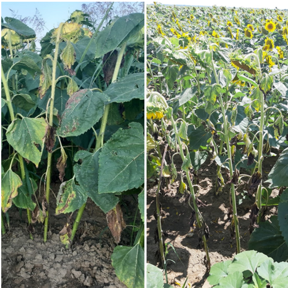
Slika 15. i 16. Bolesti suncokreta

Prvi simptomi zabilježeni su u punoj cvatnji 18.07.2020. godine (Slika 15. i 16.). Srednji dio stabljike postao je taman, a nakon obilnih kiša pojavio se bijeli micelij. Zaraza se proširila na stabljiku u obliku nekrotičnih pjega koje su bile jasno odijeljene od zdravog dijela. Nakon većeg širenja pjega one su se spojile i prstenasto obuhvatile stabljiku koja je kasnije bila lako lomljiva.