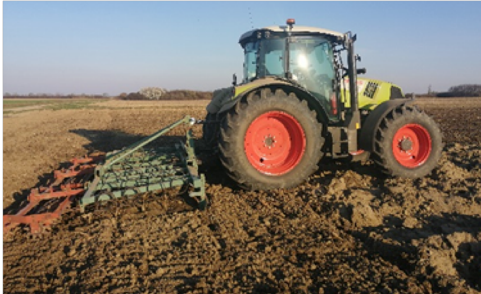
Slika 10. Zatvaranje zimske brazde

Vrlo je važno zimsku brazdu „zatvoriti“ (Slika 10.) kako bi se tlo poravnalo i smanjilo isparavanje vlage iz tla, ona se izvodi pomoću traktora Claas Arion 460 i sjetvospremačem Jadranka – Jelisavac (4, 20 m).