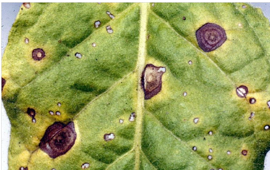
Slika 3. Alternaria tenuis

Uzročnik koncentrične pjegavosti, Alternaria tenuis (Slika 3.), jedna je od najčešće izoliranih gljiva s različitih kultiviranih i korovnih biljaka širom svijeta. Pretežito dolazi na oslabljenim biljkama bilo zbog napada drugih parazita, bilo zbog nepovoljnog djelovanja okolišnih čimbenika (Vratarić i sur., 2004.).