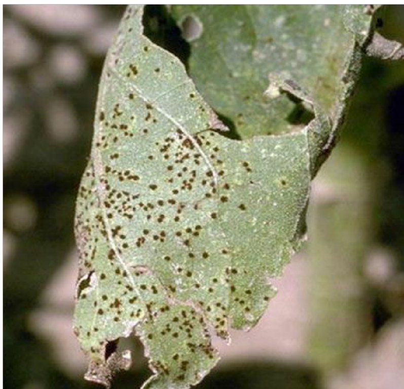
Slika 9. Siva pjegavost lišća