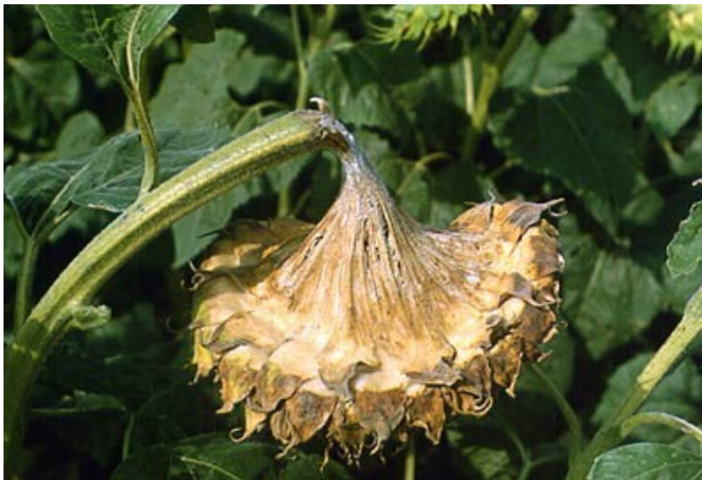
Slika 8. Truljenje glave