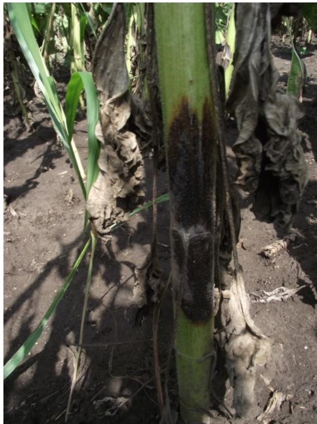
Slika 2. A. helianthi

Parazitna gljiva A. helianthi (Slika 2.) ima relativno uzak krug domaćina, odnosno on do danas nije svestranije proučavan. Glavni domaćini su uzgajane i divlje vrste roda Helianthus , rjeđe Ricinus communis , Leuchanemum vulgare i Zinnia elegans (Vratarić i sur., 2004.).