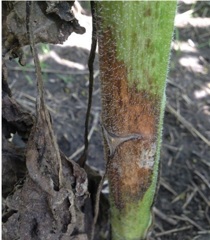
Slika 5. Siva pjegavost stabljike suncokreta