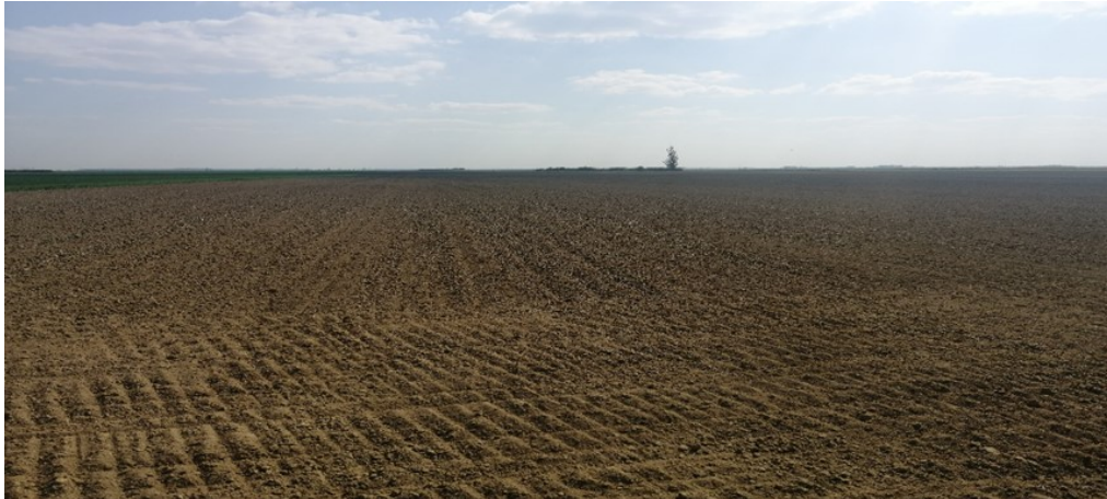
Slika 11. Oranica nakon obrade