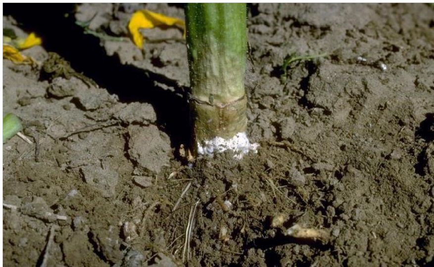
Slika 6. Korijenski tip bolesti i venjenje biljaka

znakova bolesti do potpunog venjenja, uz povoljne uvjete za gljivu i kod osjetljivih hibrida, može doći već za četiri do sedam dana. Simptomi zaraze lako se prepoznaju. Iznad razine tla na stabljici vide se sivkaste ili zeleno – smeđe pjege koje prstenasto obuhvate stabljiku, nekada i do visine od 50 cm. Kako patološki proces napreduje, stabljika se razmekšava, a srž propada. Izvana, na bolesnom dijelu za vlažna vremena razvije se gusta bijela nakupina micelija. Ubrzo u srži i u epifitnom miceliju gljiva stvara 3 – 6 mm velike crne sklerocije. Odumiranje zahvaća i lateralno korijenje. Koliko je danas poznato suncokret je jedina kultura koju S. sclerotiorum napada preko korijena. Najčešće se javlja u hladnijim i vlažnijih podneblja, a razvija se najbolje pri temperaturi od 15 do 21C i visokoj relativnoj vlazi zraka. Glavni izvor zaraze su sklerocije koje u tlu mogu ostati vitalne 4 do 6 godina (Vratarić i sur., 2004.).