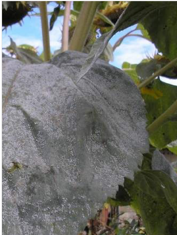
Slika 4. Siva plijesan suncokreta

Uzročnik sive plijesni, gljiva Botrytis cinerea (Slika 4.), fakultativno je parazitna i polifagna vrsta. Međutim, neki izolati B. cinerea pokazuju manji ili veći stupanj specijalizacije te inficiraju samo neke domaćine. Krug njenih domaćina je brojna, osobito u području umjerene klime: suncokret, soja, uljana repica, lan, vinova loza, hmelj, grah, grašak, luk, rajčica, mrkva, ricinus, kao i mnoge druge uzgajane i korovne vrste (Vratarić i sur., 2004.).