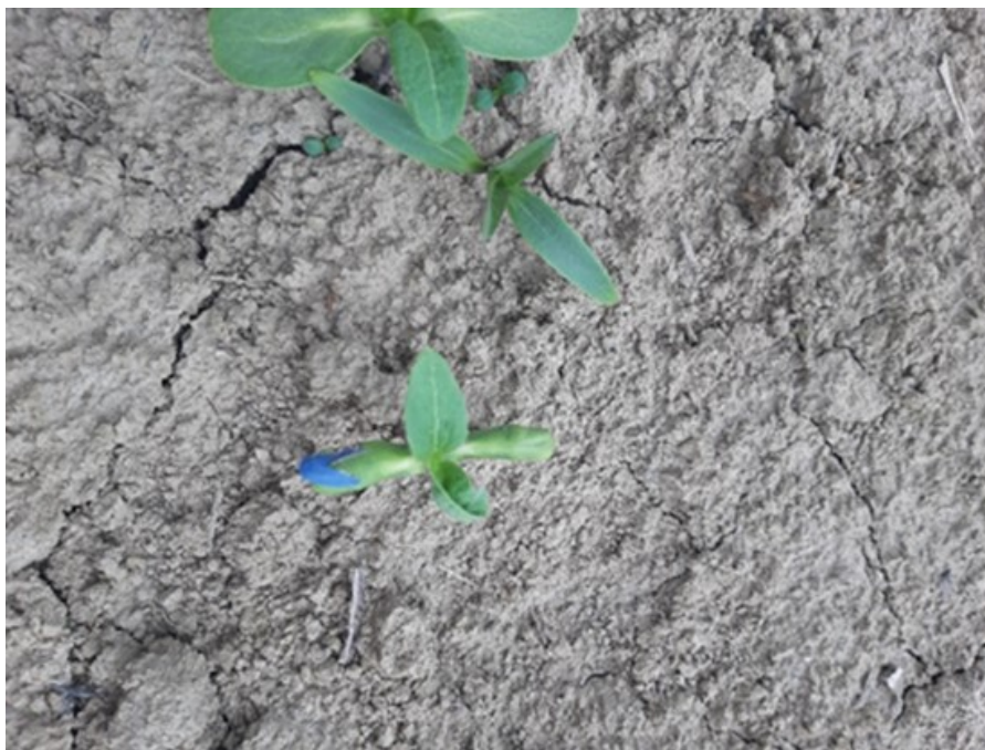
Slika 13. Ponik suncokreta i korova

Naknadno prskanje je nakon ponika suncokreta i korova (Slika 13.) gdje je korišten EXPRESS 50SX u dozi od 45 g/ha, a naknadno za suzbijanje sirka FOCUS ULTRA u dozi 1,5 l/ha i DASHA u dozi od 0,5 l/ha.