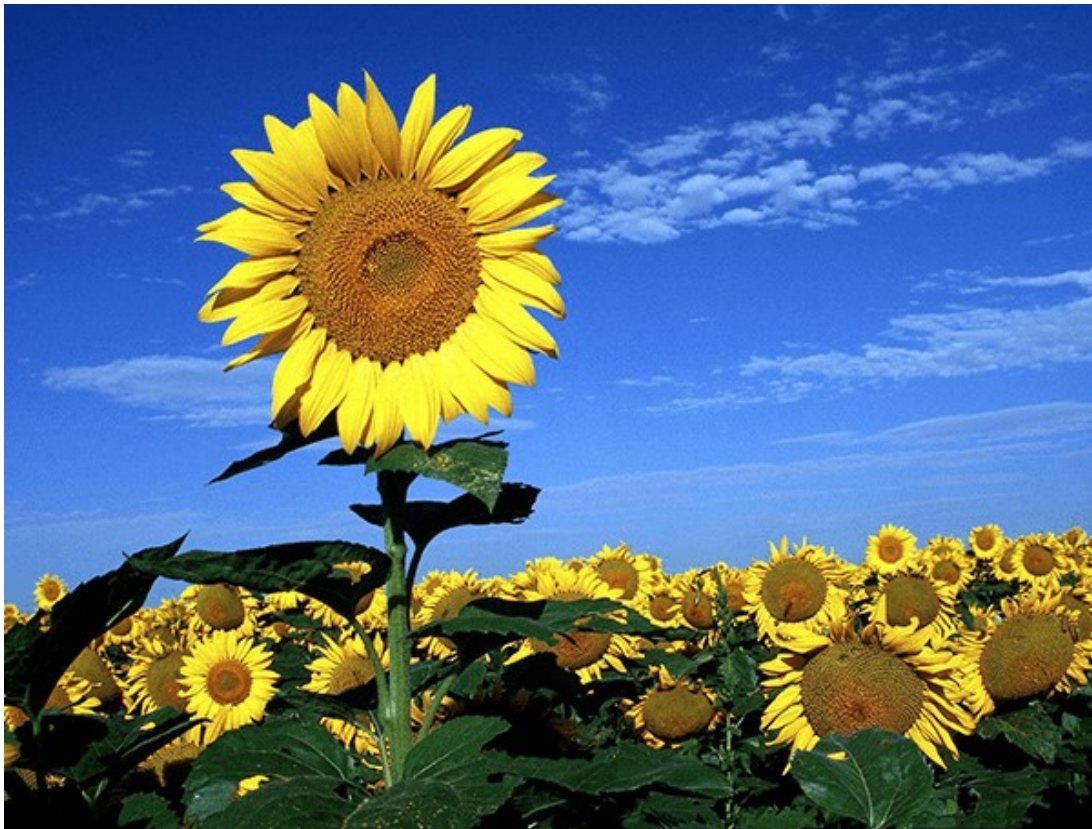
Slika 1. Suncokret

Gljive su, ne samo u nas nego i u drugim zemljama gdje se suncokret (Slika 1.) sije na manjim ili većim površinama, najrašireniji i najštetniji uzročnici bolesti ove kulture. Ipak, bakterije, virusi i fitoplazme potencijalna su opasnost i ne treba ih zanemariti. Razlog tomu je njihovo moguće širenje u nova područja te s druge strane zbog promjene patogenih svojstava uzročnika i stvaranja novih patotipova, patovara ili rasa parazita. Isto vrijedi i za neke gljivičine bolesti suncokreta koje ili danas nemaju kozmopolitski karakter ili se javljaju na malim površinama i zaražavaju neznan broj biljaka (Vratarić i sur., 2004.).