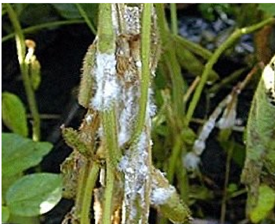
Slika 7. Truljenje srednjeg dijela stabljike

Truljenje srednjeg dijela stabljike (Slika 7.) javlja se od cvjetanja do zriobe. Infekciji stabljike obično prethodi razvoj bolesti na listu i lisnoj peteljci, a simptomi na stabljici jednaki su onima na donjem dijelu biljke. Bolesno tkivo izrazito je izbijeljeno i raščijano. Zaraza se širi na stabljiku pojavom nekrotičnih pjega koje su oštro odijeljene od zdravog dijela. Pjege rastu i prstenasto obuhvaćaju stabljiku. U unutrašnjosti stabljike gljiva stvara brojne crne ovalne ili nepravilne sklerocije veoma različitih dimenzija. Zbog razgradnje parenhima srži i kore stabljike se lagano lome, osobito pri jačem vjetru ili u vrijeme žetve uslijed udara kombajna, a sklerocije ispadaju na tlo (Vratarić i sur., 2004.).