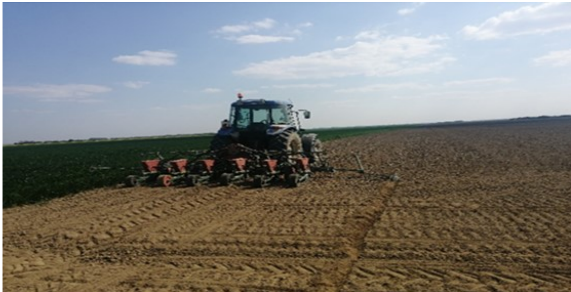
New Holland TD 5050 i pneumatskom sijačicom OLT PSK - 6 sa šest redova

Slika 12. Sjetva obavljena 19. travnja 2020. godine s traktorom