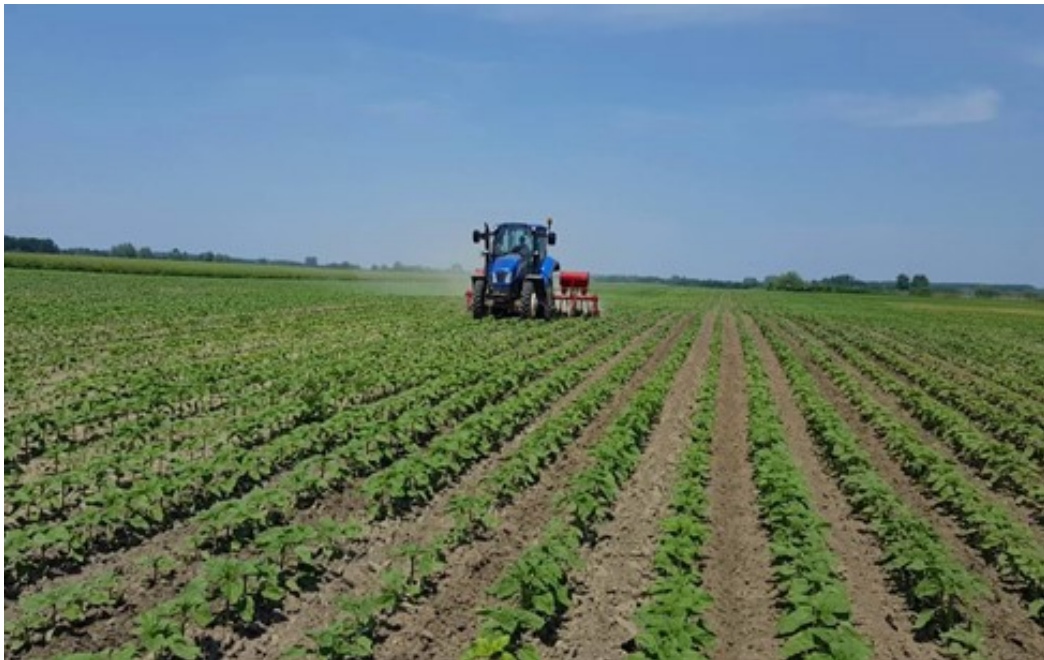
Slika 14. Međuredna kultivacija

Međuredna kultivacija (Slika 14.) obavljena je 28. svibnja 2020. godine s traktorom New Holland TD 5050 i kultivatorom IMT 6 redova.