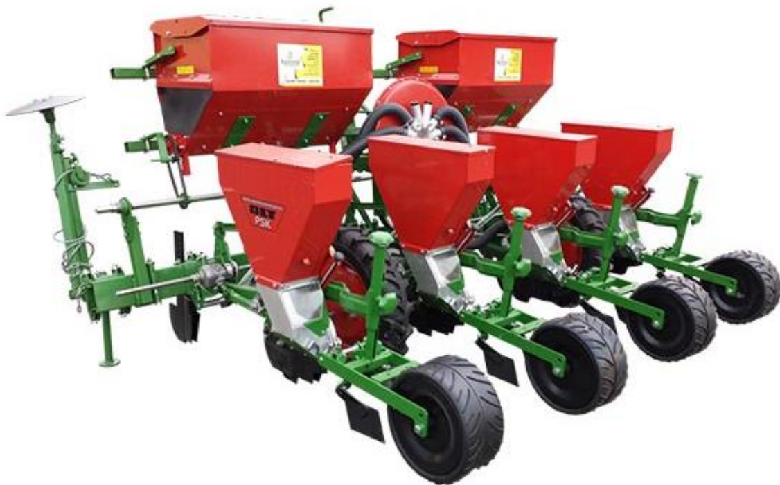
Slika 8. Sijačica PSK OLT