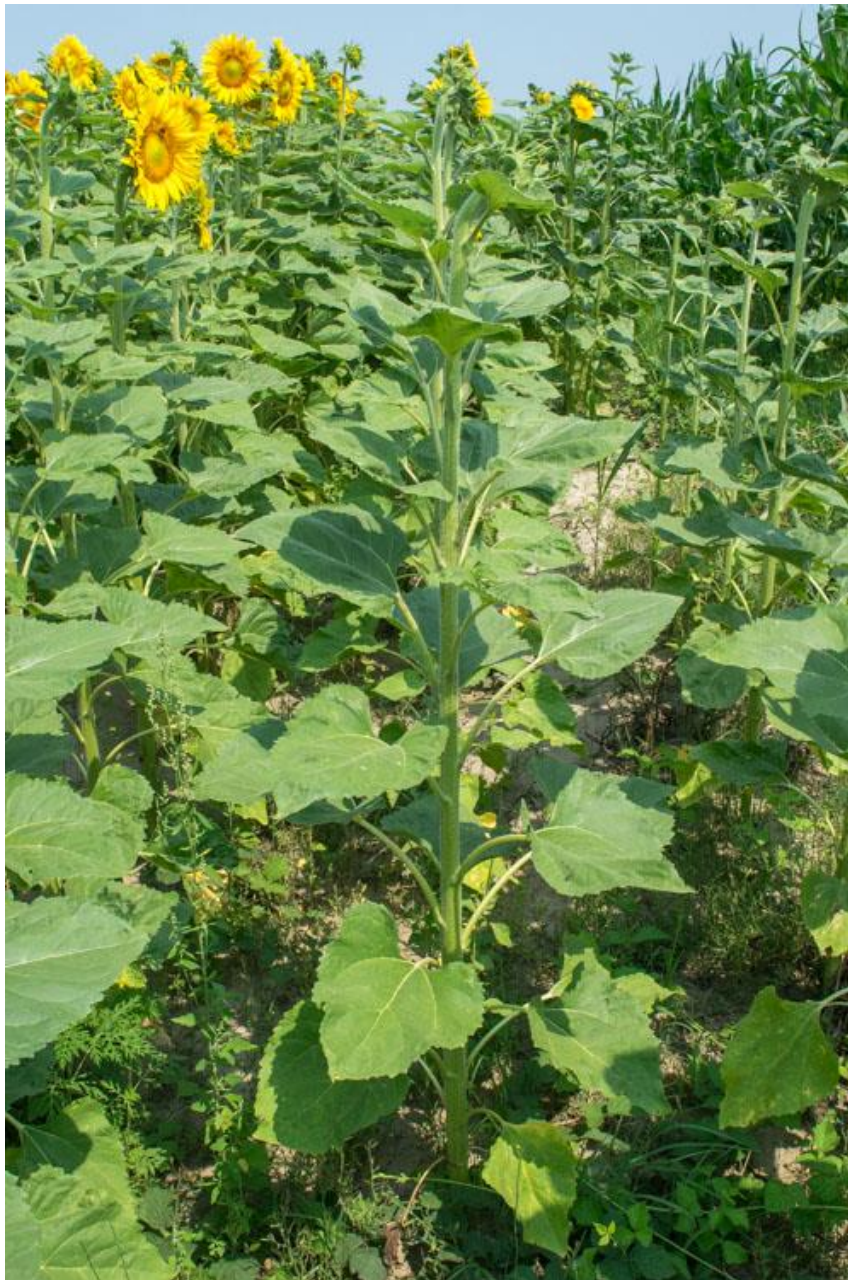
Slika 2. Stabljika suncokreta

Nakon što supka izbije na površinu tla, dolazi do razvijanja stabljike. U samim počecima, stabljika je krhka, lomljiva, te neotporna na bilo kakav fizički kontakt. S vremenom i biljka očvrstne, a u kombinaciji s čvrstim korijenom stabljika sve više jača, te izdržava nalete vjetra koji ponekad vrši pritisak na cijelu biljku. Stabljika (Slika 2.) je obrasla dlačicama, a završava cvijetom glavicom na kojoj su smješteni cvjetovi (Prlina, 2015.).