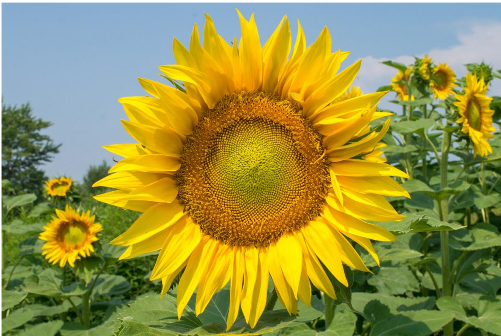
Slika 3. Cvijet suncokreta

Cvijet suncokreta (Slika 3.) razvija se na samom vrhu stabljike, u svojim počecima izgleda kao glavica koja se s vremenom raste i razvija. Veličina glavice nije uvijek jednaka, a ovisno o sorti i agrotehničkim i vremenskim uvjetima može biti velika između 10 i 75 centimetara. Ona se sastoji od lože cvata na kojoj se nalaze dvije vrste cvjetova: cjevasti – plodni i jezičasti – neplodni. Jezičasti su intenzivne, jarke žute boje te im je glavna svrha privlačenje kukaca. Cjevasti cvjetovi su dvospolni, raspoređeni unutar cijele glavice. Oni imaju pricvjetni list koji poslije procesa oplodnje očvrstne i na taj način sprječava prosipanje i opadanje sjemena. Prašničke niti su slobodne, a prašnice su srasle u prsten koji okružuje vrat tučka, koji se sastoji od plodnice, vrata i dvodijelne njuške (Gadžo i sur., 2011., prema Prlina, 2015.).