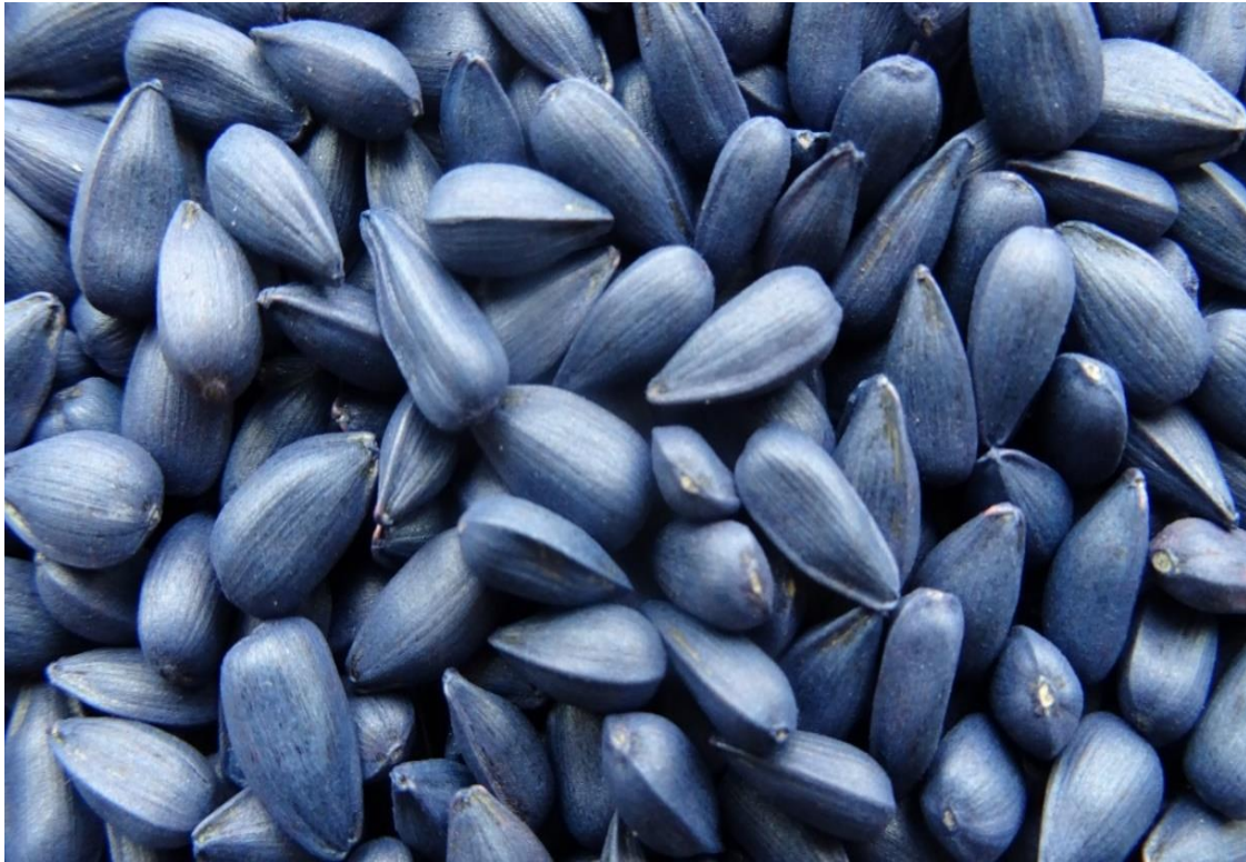
Slika 5. Sjeme hibrida suncokreta NK Neoma primjenjenog u ispitivanju

glava je karakterističnog izgleda s velikim brojem zrna velike težine. Relativno je tolerantan na sušu, dok je veoma tolerantan na Phomaspp i dobre tolerantnosti na Phomopsispp. i Sclerotiniasclerotiorum . Optimalan sklop biljaka za ovaj hibrid iznosi od 55 000 do 60 000 (Katalog suncokreta, 2020.).