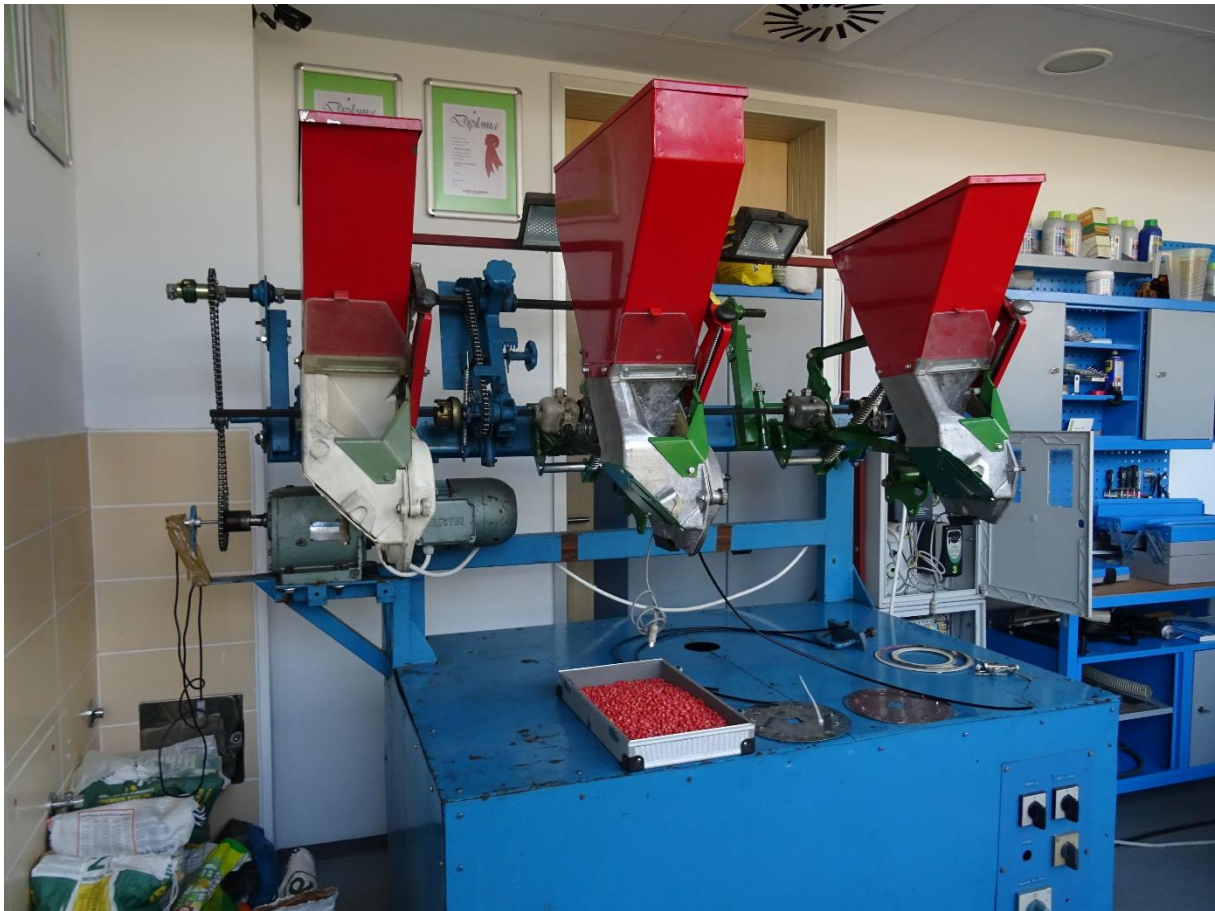
Slika 9. Ispitni stol za pneumatske sijačice