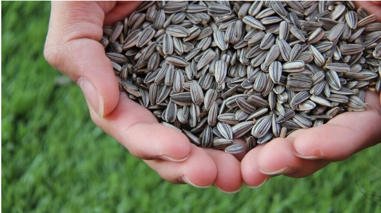
Slika 4. Plod suncokreta

Plod suncokreta se naziva i roškom, iako je jednostavno poznat kao sjemenka. Plod se sastoji od ljuske i jezgre, a sadrži epidermu koja svojom čvrstoćom brani plod. Sjemenke se razlikuju po boji, te po kakvoći sjemenog ulja koja ovisi o sorti suncokreta (Prlina, 2015.).