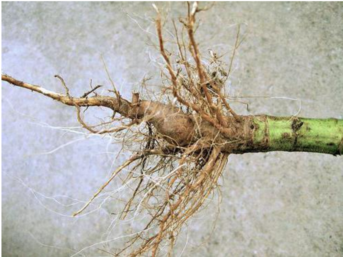
Slika 1. Korijen suncokreta

Korijen nije niti velik niti jak, ukoliko ga se promatra u odnosu na cijeli rast biljke. Kada bi se u obzir uzeo samo korijen, onda se može reći da je snažan, ima veliku snagu upijanja tvari iz tla i može dosegnuti i do tri metra u dubinu, te oko metar u širinu. O tome hoće li korijen biti snažan, te kakvog će oblika biti – ovisi o tipu tla. Na suhim tlima glavni dio korijena podrijet će dublje u tlo, pa će imati manje korjenastih niti u odnosu na korijen koji raste na tlima bogatim vodom. Tada glavni korijen ne prodire duboko u zemlju, već se razvija više bočnog korijenja (Vratarić i sur., 2004., prema Prlina, 2015.).