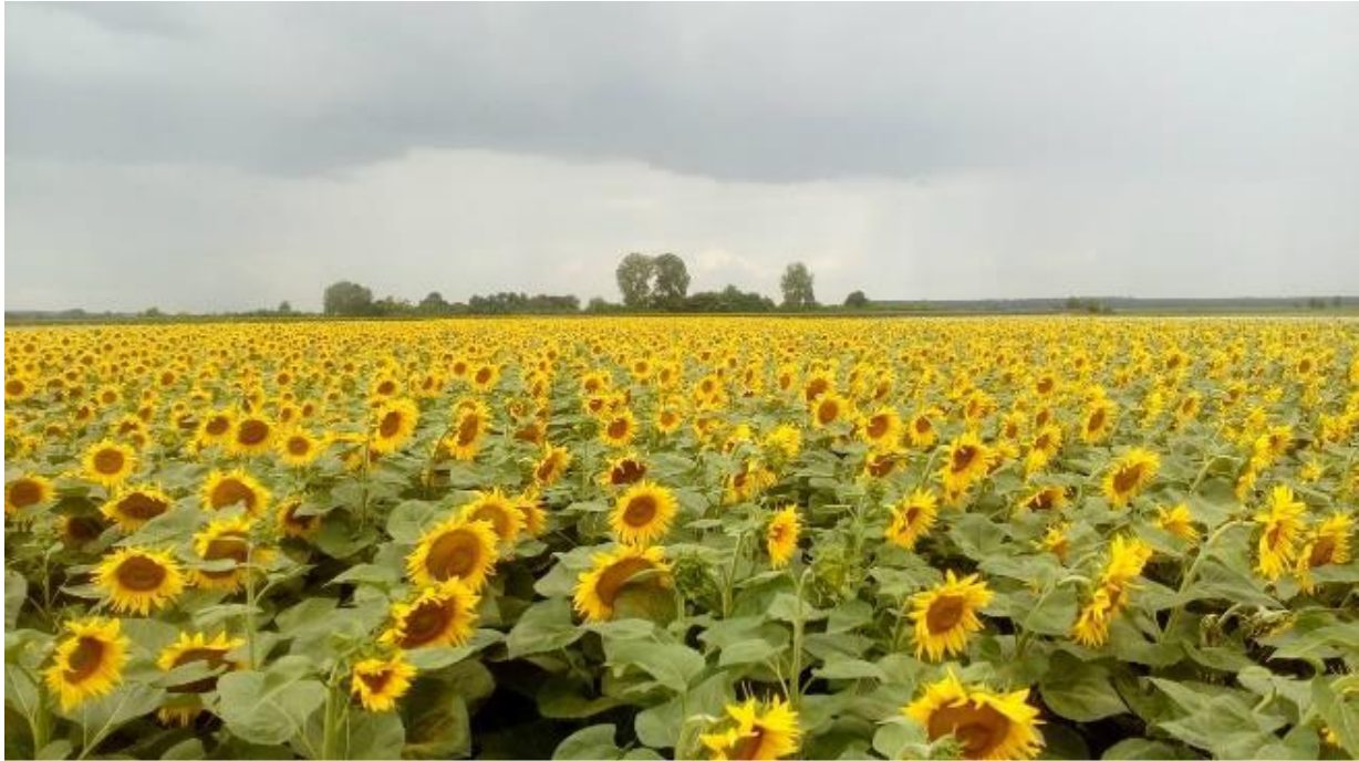
Slika 7. Suncokret NK Neoma