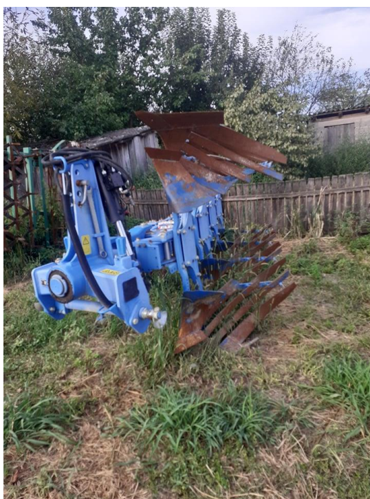
Slika 5. Duboko oranje s plugom Lemken VariOpal 8