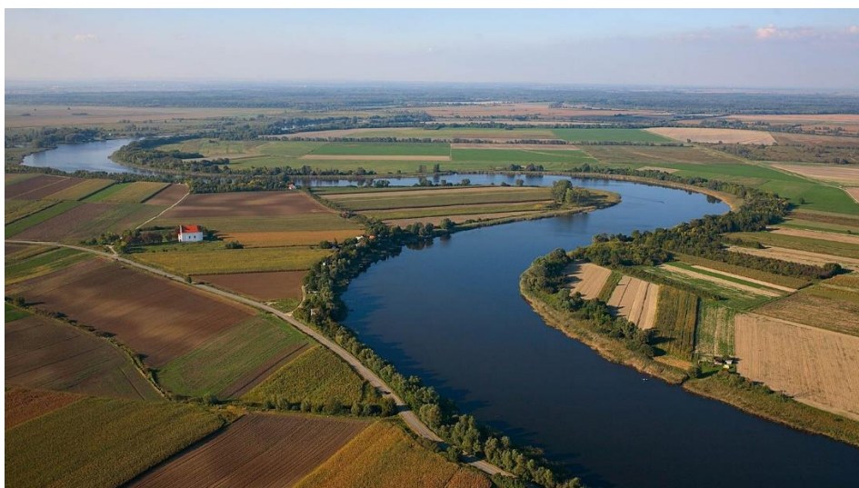
Slika 3. Baranja

Od prirodnih atrakcija u Baranji se može posjetiti Park prirode Kopački rit. Park prirode Kopački rit je najveće poplavno područje u srednjem dijelu Europe omeđen rijekama Dravom i Dunavom. Od 1993. godine je Ramsarsko područje, a kasnije postaje i dijelom ekološke mreže Natura2000. Ima bogatu biološku raznolikost, a značajan dio Parka je Posebni zoološki rezervat i rubno područje gdje se najveći dio raznolikosti može promatrati na jednome mjestu.