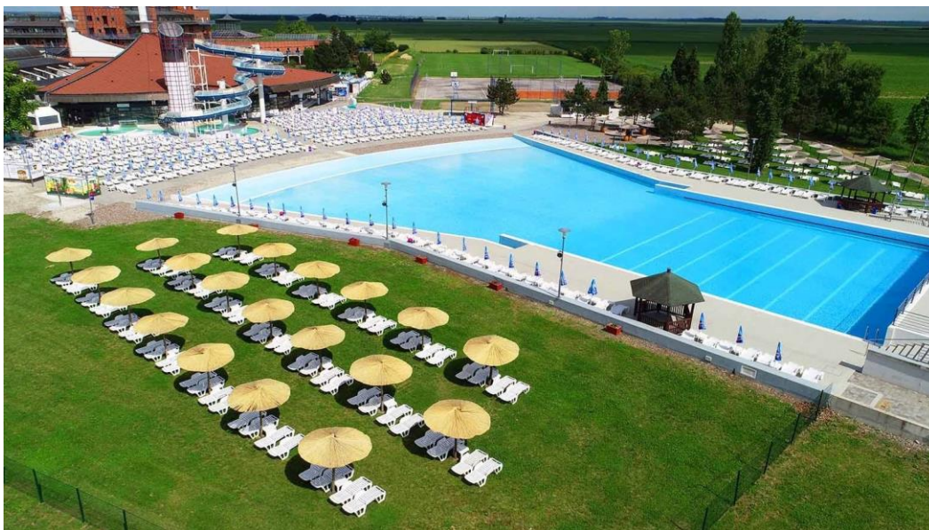
Slika 7. Bizovačke toplice