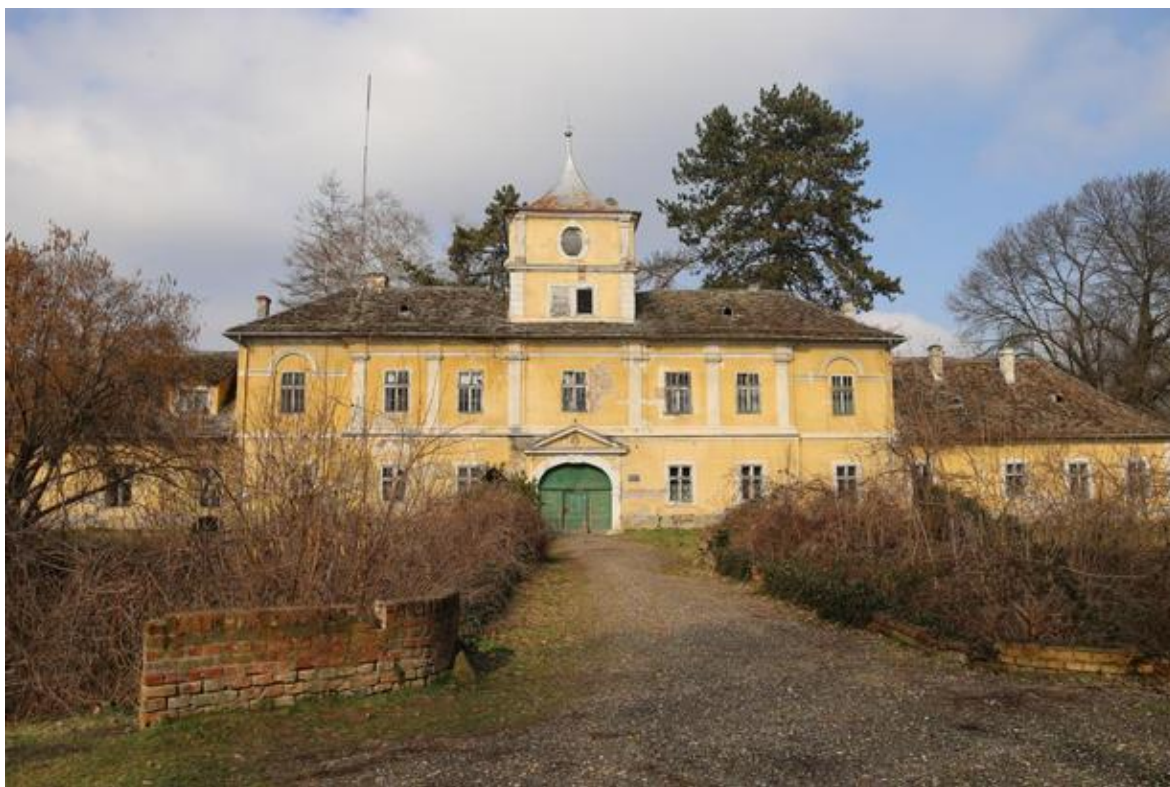
Slika 4. Dvorac Eugena Savojskog

Kulturne znamenitosti koje privlače turiste su Crkva sv. Petra i Pavla, Dvorac Eugena Savojskog, Dvorac obitelji Eszterházy, Dvorac Tikveš, Dvorac u Kneževu, Etnološki centar baranjske baštine, Ekoturistički posjetiteljski centar, Spomenik Batinskoj bitci i Vinoteka i zavičajni muzej.