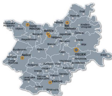
Slika 2. Baranja