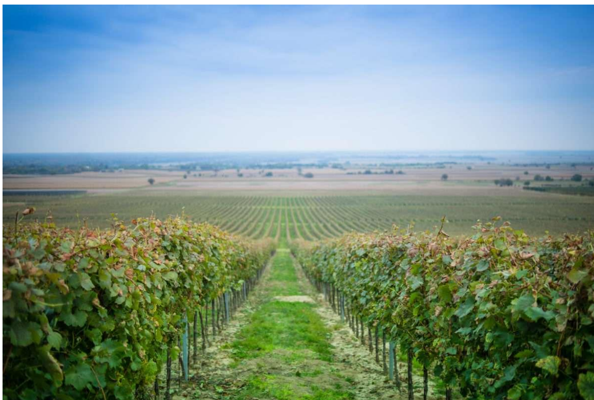
Slika 5. Baranjski vinogradi

U Baranji je vrlo dobro razvijen seoski turizam, a skoro svako domaćinstvo proizvodi vino izuzetne kvalitete. Iz tog je razloga vino izrazito značajno za Baranju i njezin gospodarski, ali iznad svega turistički razvoj. Svake se godine pokušava novim načinima zadiviti turiste poboljšavanjem gastronomske ponude, ali i organiziranjem druženja na otvorenom uz lagano pucketanje vatrice u kasnim večernjim satima. Način pripreme baranjskih vina dobro je čuvana tajna, a ona su svake godine sve kvalitetnija i bolja, što turisti prepoznaju i dodatno cijene.