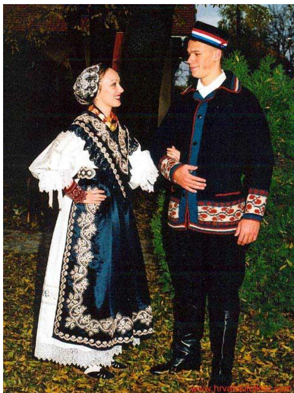
Slika 1. Šokac i Šokica