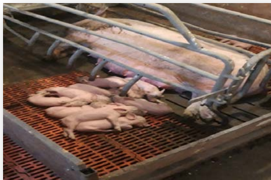
Slika 8. Dojna krmača s prascima

preko pojilice. Osim što ne zadovoljava potpunu potrebu za vodom, krmačino mlijeko je također siromašno elementom željeza, pa se prascima 3. dana života injekciono aplicira u potkožno tkivo makroelement željezo, zajedno sa neophodnim vitaminima. Nakon 21. dana života, muška prasada se radi daljnjeg usmjeravanja u tov kastrira.