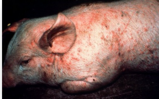
Slika 13. Vrbanac

pogodovnih čimbenika, kao što su npr. nagle promjene temperature zraka i tlaka, loša mikroklima, promjene hrane, te stres, dolazi do slabljenja otpornosti organizama, a posljedično do infekcije.