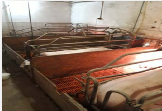
Slika 7. Prasilište

prase, po završetku poroda što prije posiše prvo majčino mlijeko – kolostrum. Sisanje kolostruma predstavlja ključni trenutak za preživljavanje prasadi, jer putem njega prasad u organizam unosi specifična antitijela (gama-globuline) koji izgrađuju pasivni imunitet prasadi. Pasivni imunitet štiti prasad od različitih oboljenja, a traje oko 3 tjedna kada počinju stjecati aktivni imunitet (Kralik i sur., 2007.).