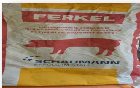
Slika 9. Dopunska krmna smjesa za prasad