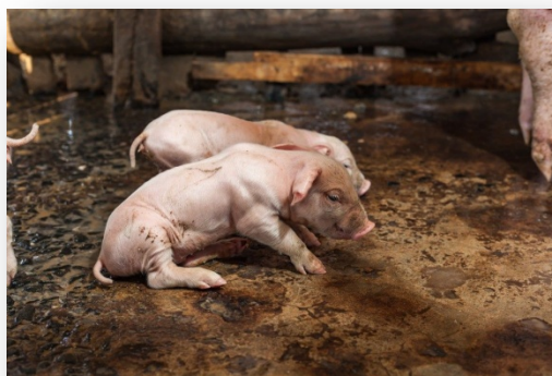
Slika 11. Prasad oboljela od E. coli

Escherichia coli je bakterija koja živi u donjem dijelu probavnog trakta sisavaca i jedna je od glavnih uzročnika infekcija. Uzročnik je enteropatogeni beta-hemolitički sojevi Escherichia coli . Ova bolest se najčešće javlja kod prasadi na sisi u prvih sedam dana života. Simptomi kod prasadi se mogu pojaviti odmah nakon prasenja, odnosno naglo izbijaju i mogu zahvatiti veći broj prasadi. Oboljela prasada slabo sisaju, imaju žućkasti proljev, brzo dehidriraju i naglo mršave.