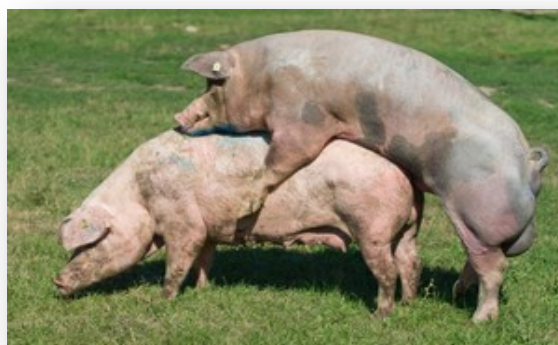
Slika 6. Prirodni pripust