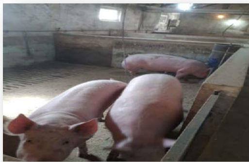
Slika 10. Tovljenici na OPG-u Lukač

Završnu fazu ciklusa svinjogojске proizvodnje predstavlja tov svinja. Glavni cilj tova, jest proizvodnja tovljenika starosti do 6 mjeseci i završne težine između 120 i 130 kilograma. Kako bi se dobili kvalitetni tovljenici potrebno je reducirati obroke i vrstu hranidbe, čime ćemo omogućiti dnevni prirast približno 700 grama i dobro raspoređeno mišićno tkivo u trupu tovljenika. Na tovnu sposobnost utječe više faktora, kao individualnost, tip i pasmina, tjelesna masa prasadi pri odbiću, dob svinja, hranidba te držanje i njega.