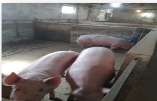
Slika 10. Tovljenici na OPG-u Lukač

Završnu fazu ciklusa svinjogojske proizvodnje predstavlja tov svinja. Glavni cilj tova, jest proizvodnja tovljenika starosti do 6 mjeseci i završne težine između 120 i 130 kilograma. Kako bi se dobili kvalitetni tovljenici potrebno je reducirati obroke i vrstu hranidbe, čime ćemo omogućiti dnevni prirast približno 700 grama i dobro raspoređeno mišićno tkivo u trupu tovljenika. Na tovnu sposobnost utječe više faktora, kao individualnost, tip i pasmina, tjelesna masa prasadi pri odbiću, dob svinja, hranidba te držanje i njega.