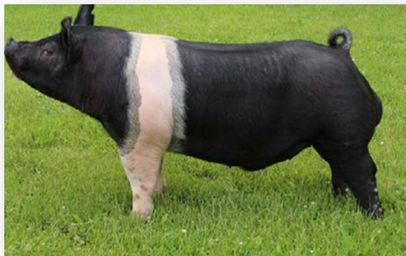
Slika 1. Nerast pasmine hempšir