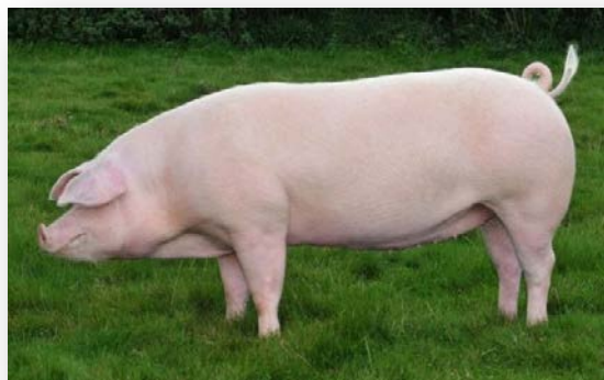
Slika 2. Nazimica danskog landrasa

Danci su križanjem domaće dugouhe svinje i velikog jorkšira uspjeli dobiti bijelu oplemenjenu svinju ili kako je danas nazivamo landras. Po ovoj pasmini Danska je postala poznata u svijetu, te je i danas zemlja koja je prva u pogledu razvoja svinjogojstva. Ovu pasminu karakterizira mala i lagana glava, s blago povijenom profilnom linjom.