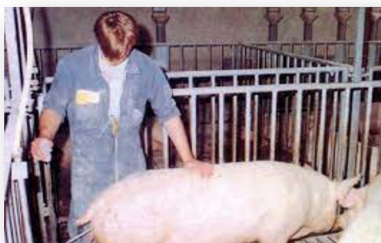
Slika 5. Umjetno osjemenjivanje krmača

Vrijeme trajanja prirodnog pripusta je do 15 minuta i isti se ponavlja nakon 12 sati. Kod umjetne oplodnje potrebno je 5 do 7 minuta kako bi čin osjemenjivanja bio gotov. Cjelokupni proizvodni ciklus na gospodarstvu se temelji na sinkronizaciji estrusa, odnosno izjednačavanjem spolnih ciklusa kod većeg broja plotkinja. Razlog sinkronizacije estrus jest formiranje skupina krmača koje se istodobno prase te dobivanje skupina prasadi kasnije tovljenika podjednake dobi. Ovakav način proizvodnje zahtjeva dosta vremena, ali nam se pokazao produktivnim.