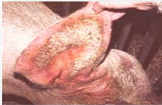
Slika 12. Svinja oboljela od šuge

Otpornost organizma ovisi o manifestaciji šuge pa životinje s jačim imunitetom spontano liječe šugu, a kod životinja sa slabijim imunitetom šuga se pojavljuje u kliničkom obliku. Najčešći simptomi šuge su dermatitis, pojava svrbeža, gubitak apetita, ogrebotine itd. Skrivena šuga je oblik zaraze u kome se šugarci ne mogu razmnožavati uslijed otpornosti organizma, al životinje sa skrivenom šugom i dalje su izvor zaraze.