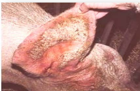
Slika 12. Svinja oboljela od šuge

Otpornost organizma ovisi o manifestaciji šuge pa životinje s jačim imunitetom spontano liječe šugu, a kod životinja sa slabijim imunitetom šuga se pojavljuje u kliničkom obliku. Najčešći simptomi šuge su dermatitis, pojava svrbeža, gubitak apetita, ogrebotine itd. Skrivena šuga je oblik zaraze u kome se šugarci ne mogu razmnožavati uslijed otpornosti organizma, al životinje sa skrivenom šugom i dalje su izvor zaraze.