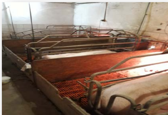
Slika 7. Prasilište

prase, po završetku poroda što prije posiše prvo majčino mlijeko – kolostrum. Sisanje kolostruma predstavlja ključni trenutak za preživljavanje prasadi, jer putem njega prasad u organizam unosi specifična antitijela (gama-globuline) koji izgrađuju pasivni imunitet prasadi. Pasivni imunitet štiti prasad od različitih oboljenja, a traje oko 3 tjedna kada počinju stjecati aktivni imunitet (Kralik i sur., 2007.).