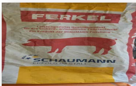
Slika 9. Dopunska krmna smjesa za prasad