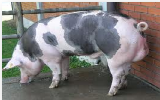
Slika 4. Pietren

Prosječni dnevni prirast je oko 750 g, a zahtjeva od 2,9 do 3,3 kg hrane za kilogram prirasta. Dugo vremena smatrana je najmesnatijom pasminom (oko 65% mišićnog tkiva u polovicama), ali kasnije su je pretekle hibridne svinje. Veliki problem ove pasmine je manjak intramuskularne masti koja je glavni preduvjet za kakvoću mesa (Kralik i sur., 2007.). Vrlo često, tropasminski hibridi s pietrenom imaju ispod 1,5% intramuskularne masti, dok stručnjaci preporučuju da za dobru kvalitetu mesa postotak mora biti od 2 do 3%.