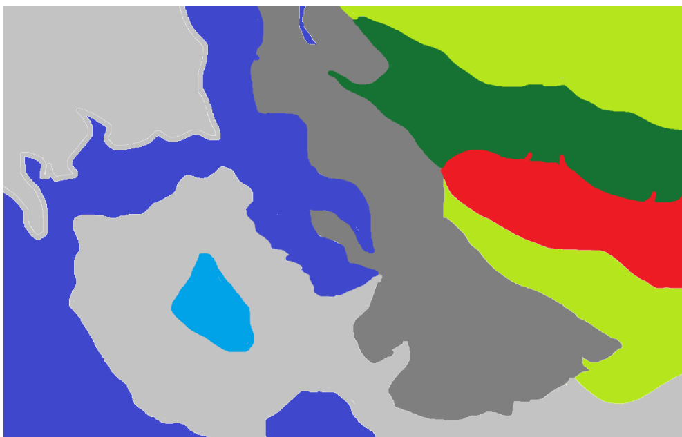
Slika 5. Slika krajobraza prema Formanu i Godronu

Prema gore navedenim pokazateljima, izrađena je slika krajobraza prema Formanu i Godronu, gdje je definicija okolnog krajobraza prikaz krša (slika 5 – crvena boja) i polja (slika 5 – svijetlo zelena boja), te obalnog dijela (slika 5 – granica sive i tamno plave boje) u kojem se je smjestio grad Šibenik (slika 5 – siva boja).