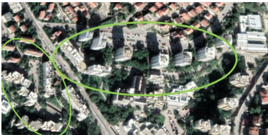
Slika 16. Izgrađene stambene zgrade s velikim dijelovima zelenila