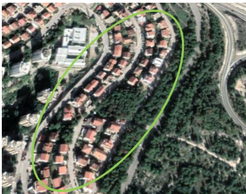
Slika 15. Dobar primjer gradnje, ostavljeno zelenilo