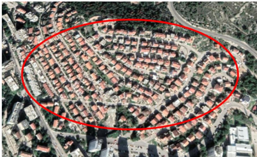
Slika 14. Prikaz guste gradnje

Novija izgradnja rubnih dijelova grada koja se odnosi na stambene zgrade pokazuje i pozitivni primjeri gradnje gdje se nalaze tzv. zeleni pojasevi (slika 15 i 16). Zgrade su dobro povezane infrastrukturom prometnica, a zeleni javni prostori sastoje se od gustog sklopa autohtonog drveća koje je sađeno u drvorede, na parkirališta ili čini zaštitni šumski pojas.