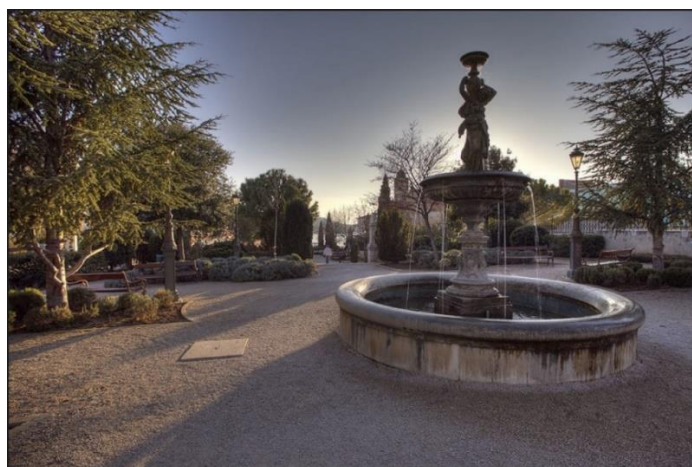
Slika 12. Perivoj Roberta Visianija

Veliki značaj ima perivoj Roberta Visianija. Smatra se jednim od najvećih perivoja i nalazi se u centralnom dijelu grada. Perivoj je izgrađen u 19. stoljeću te je bio obnovljen u periodu 1996. do 1998. Spada u neobarokne perivoje sa srednjovjekovnim oblikovnim elementima. Nakon Drugog svjetskog rata, postao je okupljalište za umirovljenike, polazišna točka za brodske linije te odmaralište za turiste. Nažalost, još tada se smatralo da perivoj nije dovoljno uređen na gradskoj razini (Dobrić i Temim, 2014). S obzirom da je perivoj smješten uz Poljanu, koja je bila pod uređenjem, park je trebao dobiti i svoj preobražaj (slika 12). S obzirom na situaciju s koronom, te velikim iznosom od 1.7 milijuna kuna za obnovu parka, grad je odlučio ne obnoviti ga ( https://sibenski.slobodnadalmacija.hr/sibenik/vijesti/sibenik/ ).