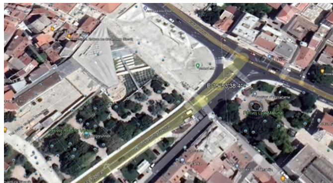
Slika 6. Dva najljepša parka u Šibeniku, Perivoj Roberta Visianija i Park Gospe van grada

Grad posjeduje nekoliko parkova od kojih je najveći i najstariji Perivoj Roberta Visianija, a u njegovoj se blizini nalazi i manji park novijeg datuma Park Gospe van grada (slika 6). Park se odlikuje svojom ljepotom te je atraktivno mjesto za druženje građana (slika 7). Iako je najveći i najatraktivniji, u njegovoj se blizini nalazi park koji se može mjeriti svojom ljepotom. To je park Gospe van grada. Puno je manji od Perivoja Roberta Visianija, ali ništa manje poznatiji. Odlikuje ga fontana u kojoj žive ribe te vodene kornjače (slika 8). Tijekom noći grad je dobro osvijetljen, daje kompletno drugi dojam nego preko dana. Osvjetljenje tvrđava i parkova je sveden na minimum kako bi posjetitelji mogli doživjeti grad u drugom obliku.