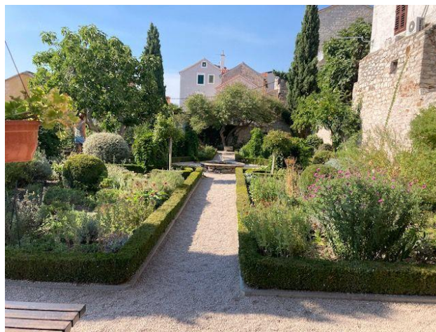
Slika 19. Srednjovjekovni samostanski mediteranski vrt Sv. Lovre

Veliki značaj ima Srednjovjekovni samostanski mediteranski vrt Sv. Lovre, zbog toga što je jedini vrt takve vrste u cijeloj Hrvatskoj. Postoje samo nekoliko u Europi, što mu daje važnost da ostaje očuvan (slika 19). Oblikovnost srednjovjekovnog vrta: „križna staza, u središtu mali zdenac, jednostavno uređenje obrubljeno šimširom i prekrasnim, starinskim mirišljivim ružama. U četiri polja unutar kompleksa zasađeno je ljekovito i začinsko bilje. Posebno mjesto pripada zbirci majčine dušice s prekrasnim crvenkastim, ljubičastim, sivkastim, svijetlozelenim i tamnozelenim bojama lišća. Kombinacijom boja zbirka je vrhunska likovna i oblikovna senzacija. Još jedna znamenitost koju vrijedi spomenuti su kapari u vrtu. Legenda kaže da je kapare u Šibenik donio Juraj Dalmatinac. Kapari su posađeni u šupljinama zidova te nas podsjećaju na velikog graditelja Jurja Dalmatinca.“ ( https://www.rezerviraj.hr/crkve/41855-srednjovjekovni-samostanski-mediteranski-vrt-sv-lovre.html ).