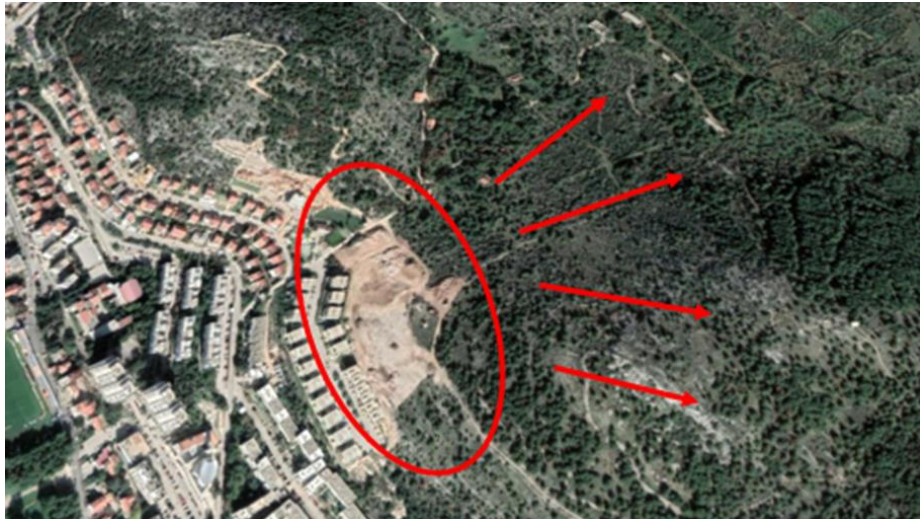
Slika 13. Prikaz smjera širenja gradnje i devastacija šume