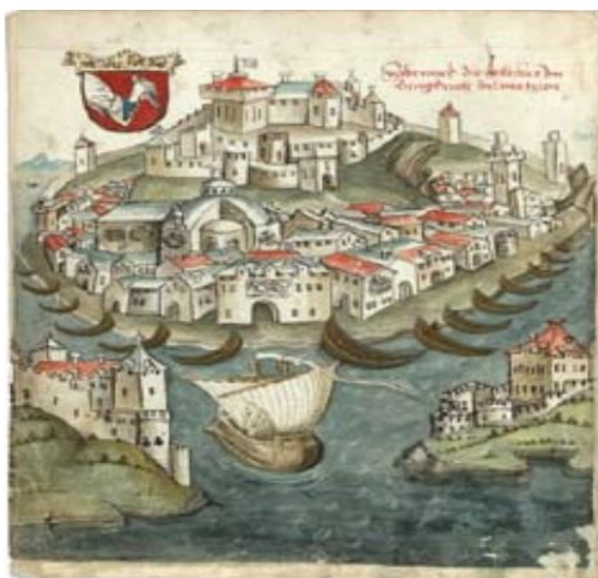
Slika 1. Konrad von Grünemberg, Šibenik, 1486.

Grad Šibenik je utemeljen u doba kneza Domagoja u IX. st. Prvo se razvijao kao utvrda sa predgrađem u Dolcima i na istočnoj strani kaštela, gdje je sagrađena crkva sv. Krševana u XII. st., oko koje se razvila jezgra grada. Šibenik je izniknuo na brijeg jedno 70 m iznad mora, na mjestu gdje se nalazi današnja tvrđava sv. Ante. Nisu nađeni tragovi urbane tradicije, ali je postojao život u kasnoantičko doba. Nakon što se dogodila bitka na Petrovoj gori 1097., te smrću vladara Petra, grad priznaje vlast hrvatsko-ugarskog kralja Kolomana 1105. Taj događaj je pokrenuo neumornu bitku između Venecije, Bizanta i Arpadovića nad Šibenikom, sve do 1180. S obzirom da je u XII. st. bio još uvijek naselje, a ne grad, pa su njegova buduća usmjerenja bila da dostigne titulu grada (civiteta). Šibenik je postao biskupskim sjedištem te tako stekao civitet, međutim zbog teških obveza i nameta zaostajao je u gospodarskom smislu. Izbijale su pobune protiv vlasti Bibirskih, te uz potporu Mletačke Republike uspješno su othrvali vlast Mladina II. Grad je izgubio tada autonomiju i slobodu biranja kneza, kojeg bi birali Mlečani. Ludvik I. Anžuvinac je uspio poraziti Mletačku Republiku u bitci te potpisivanjem mira u Zadru, grad je došao pod anžuvinsku vlast. Međutim 1412. grad se ponovo našao pod vlasti Mletačke Republike. U drugoj polovici XV. st. Šibenik je bio pod osmanskom prijetnjom, što je uzrokovalo njegovom gospodarskom zastoju. Izgled grada u to vrijeme vidljiv je na slici 1.