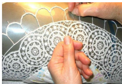
Slika 10. Ručni rad – heklanje