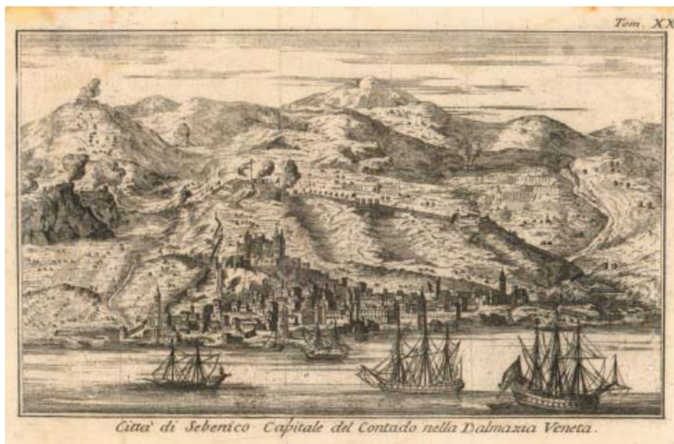
Slika 2. Salmon, Šibenik, oko 1750.

Zbog čestih osmanskih navala, napadanja, te padom gradova Knina i Skradina došlo je do znatnog pada broja stanovnika. Šibenik se počeo oporavljati nakon 1581., kada je na vlast došao knez Giovanni Antonio Foscarinij. Mletački general Christoph Martin von Degenfeld je 1646. Dao je sagraditi utvrdu nazvanu Barone Degenfeld (od 1911. Šubićevac), kako bi obranili grad od Osmanlija, tvrđava je odigrala veliku ulogu u povijesti u borbi protiv osmanske opsade 1647. Nakon poraza Osmanlija u Morejskom ratu, grad je stekao gospodarski oporavak koji je tekao vrlo sporo, što je uzrokovalo bunama koje su trajale od 1736. do 1740. Nakon stabilizacije, grad se počeo širiti (slika 2).