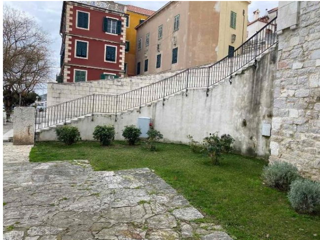
Slika 18. Stepenice katedrale sv. Jakova nakon posjećenog grma

Veliki značaj ima Srednjovjekovni samostanski mediteranski vrt Sv. Lovre, zbog toga što je jedini vrt takve vrste u cijeloj Hrvatskoj. Postoje samo nekoliko u Europi, što mu daje važnost da ostaje očuvan (slika 19). Oblikovnost srednjovjekovnog vrta: „križna staza, u središtu mali zdenac, jednostavno uređenje obrubljeno šimširom i prekrasnim, starinskim mirišljivim ružama. U četiri polja unutar kompleksa zasađeno je ljekovito i začinsko bilje. Posebno mjesto pripada zbirci majčine dušice s prekrasnim crvenkastim, ljubičastim, sivkastim, svijetlozelenim i tamnozelenim bojama lišća. Kombinacijom boja zbirka je vrhunska likovna i oblikovna senzacija. Još jedna znamenitost koju vrijedi spomenuti su kapari u vrtu. Legenda kaže da je kapare u Šibenik donio Juraj Dalmatinac. Kapari su posađeni u šupljinama zidova te nas podsjećaju na velikog graditelja Jurja Dalmatinca.“ ( https://www.rezerviraj.hr/crkve/41855-srednjovjekovni-samostanski-mediteranski-vrt-sv-lovre.html ).