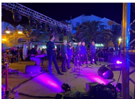
Slika 9. Klapa Intrade

Protočnost grada osigurana zaobilaznicom i protokom saobraćaja uz samu obalu mora. Sjecišta su vezana uz glavne objekte (bolnica, sud, zatvor, industrijska zona i centar grada. Glavne, prije navedene povijesne građevine i povijesna jezgra grada, zajedno s tradicijskim klapskim pjevanjem (slika 9) i kukičanjem (slika 10). Klapsko pjevanje i pjesma čini duh grada i ona se čuje danju i noću na ulicama i u restoranima. Šibenik svojim festivalima i svakodnevnicom tako nosi naziv „Grad muzike“. Kukičanje (heklanje) kao tradicionalna razbibriga žena, u današnje je vrijeme postala također zaštitna slika Šibenika te se taj stari zanat prenosi s pokoljenja na pokoljenje, a dekorativni predmeti izrađeni na taj način dio su suvenira grada. Skica grada prema k. Lynchu prikazana je na slici 11.