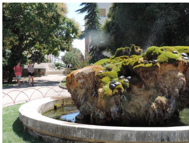
Slika 8. Park Gospe van Grada

Protočnost grada osigurana zaobilaznicom i protokom saobraćaja uz samu obalu mora. Sjecišta su vezana uz glavne objekte (bolnica, sud, zatvor, industrijska zona i centar grada. Glavne, prije navedene povijesne građevine i povijesna jezgra grada, zajedno s tradicijskim klapskim pjevanjem (slika 9) i kukičanjem (slika 10). Klapsko pjevanje i pjesma čini duh grada i ona se čuje danju i noću na ulicama i u restoranima. Šibenik svojim festivalima i svakodnevnicom tako nosi naziv „Grad muzike“. Kukičanje (heklanje) kao tradicionalna razbibriga žena, u današnje je vrijeme postala također zaštitna slika Šibenika te se taj stari zanat prenosi s pokoljenja na pokoljenje, a dekorativni predmeti izrađeni na taj način dio su suvenira grada. Skica grada prema k. Lynchu prikazana je na slici 11.