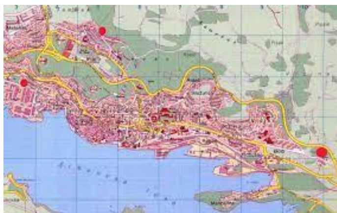
Slika 3. Plan grada Šibenika