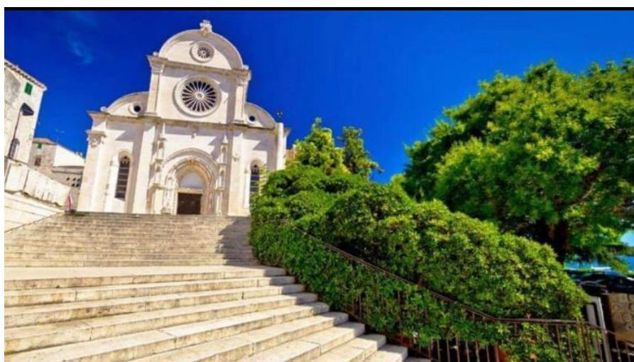
Slika 17. Grm katedrale sv. Jakova

Arhitekt Ante Vrban, podrijetlom Šibenčanin, komentirao je sječu zelenila nazvavši je katastrofom kulturne baštine ( https://www.jutarnji.hr/vijesti/hrvatska/sibencani-ogorceni-potezom-nadbiskupije-uklonili-stoljetno-stablo-koje-je-simboliziralo-ulaz-u-katedralu-na-to-mjesto-stavljaju-totem-s-projektorom-8386853 ).