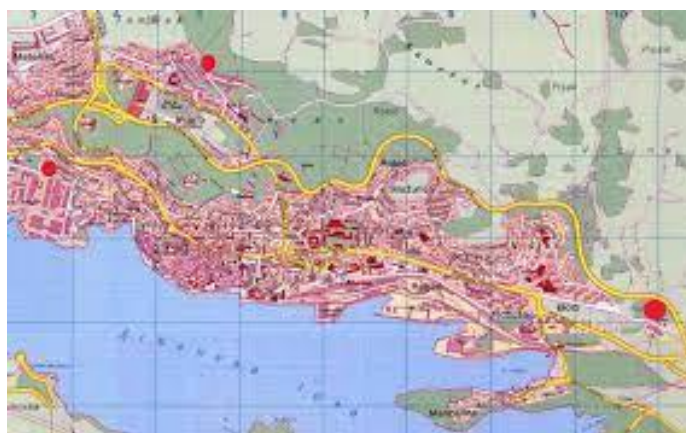
Slika 3. Plan grada Šibenika (Izvor: https://www.sibenik.hr/upload/planovi/2020/07/2020-07-08/48/7%20ID%20GUP%20SIBENIK-PLAN.pdf )