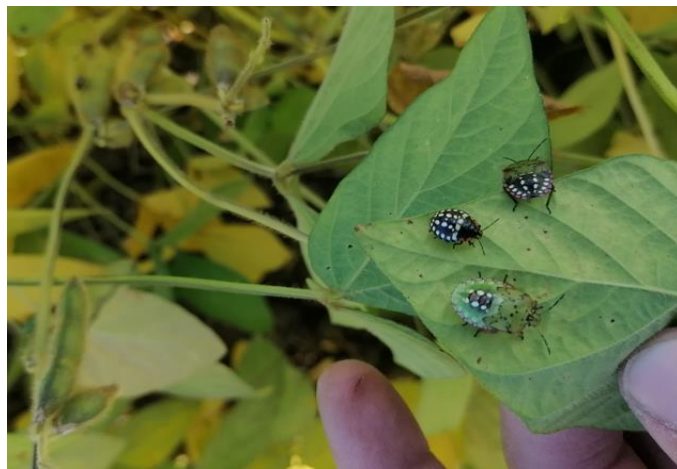
Slika 15 Prikaz napada tri stadija zelene stjenice ( Nezara viridula L.)

Budući da se soja nalazila u fazi polaganog opadanja lisne mase koje je rezultat postupnom sazrijevanja, odlučeno je da se neće prskati protiv zelene stjenice ( Nezara viridula L.) zbog rezidua insekticida (duga karenca) u soji ali i zbog procjene da napad koji je sporadičan neće nanijeti štetu zbog koje bi bilo ekonomski opravdano prskanje.