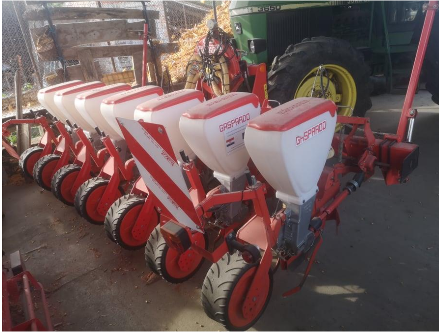
Slika 2. Prikaz sijačice GASPARDO SP