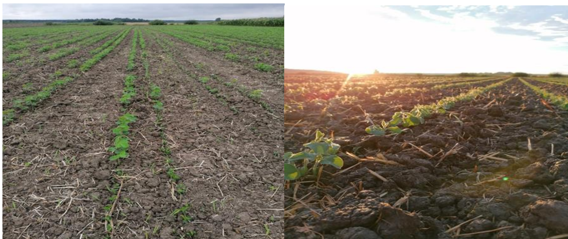
Slika 11. Prikaz nejednačnog nicanja postrne soje sjetvom u udvojene redove u odnosu na ujednačen nicanje sjetve na međuredni razmak 50 cm

Nakon sjetve u mikrozonama nešto krupnijih strukturnih agregata tlo koje je bilo prilično isušeno je dodatno prolaskom većeg broja ulagača za sjetvu jednake površine pokusa bilo više rastreseno te nedovoljno i nejednako slegnuto u dvije različite tehnike sjetve. Većina izniknutih ja biljaka niknulo prije prve kiše gdje je sjeme imalo dobar kontakt sa tlom dok u spomenutim mikrozonama koje su bile nešto krupnijih strukturnih agregata nicanje krenulo nakon prve obilnije kiše koja je bila 17. srpnja 2020 godine, što je prilična razlika u vremenu nicanja. (Slika 11.)