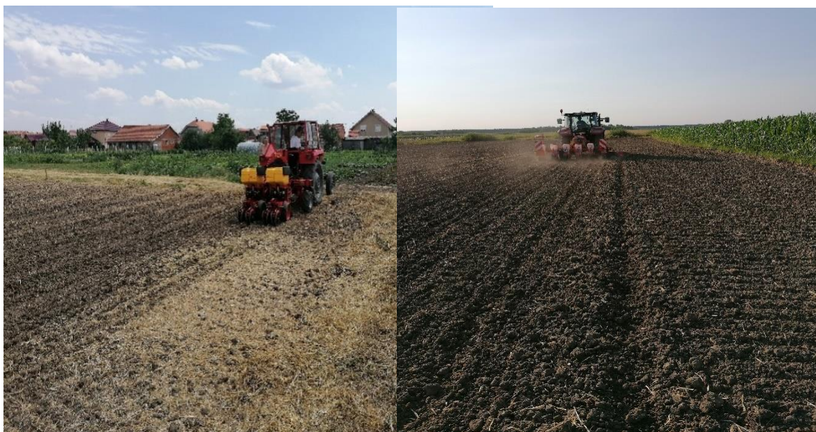
Slika 10. Prikaz sjetve dviju glavnih varijanti pokusa

Sjetva pokusa obavljena je 1. i 2. srpnja 2020. godine na dubini od 6 cm. (Slika 10.) Razlog nešto dublje sjetve u odnosu na sjetvu u redovnim rokovima je iz razloga jer je tlo bilo prilično isušeno zbog razmaka od završetka pripreme tla do sjetve, te smo dubinu sjetve odredili vizualnim pregledom stanja vlažnosti tla te je sjeme položeno u vlagu. Ono što je bitno za istaknuti jest da je prilikom vizualnog pregleda tla na nekoliko nasumičnih mjesta na parceli i odgrtanja uočena nejednaka raspodjela vlage na jednakoj dubini. Razlog isušenosti na pojedinim mjestima je zbog nešto krupnije (orašaste) strukture, koja je rezultat sastava prohoda rotodrljačom gdje je uslijed usitnjavanja većeg volumena tla došlo do pomicanja krupnijih strukturnih agregata na rubove radnog zahvata stroja.