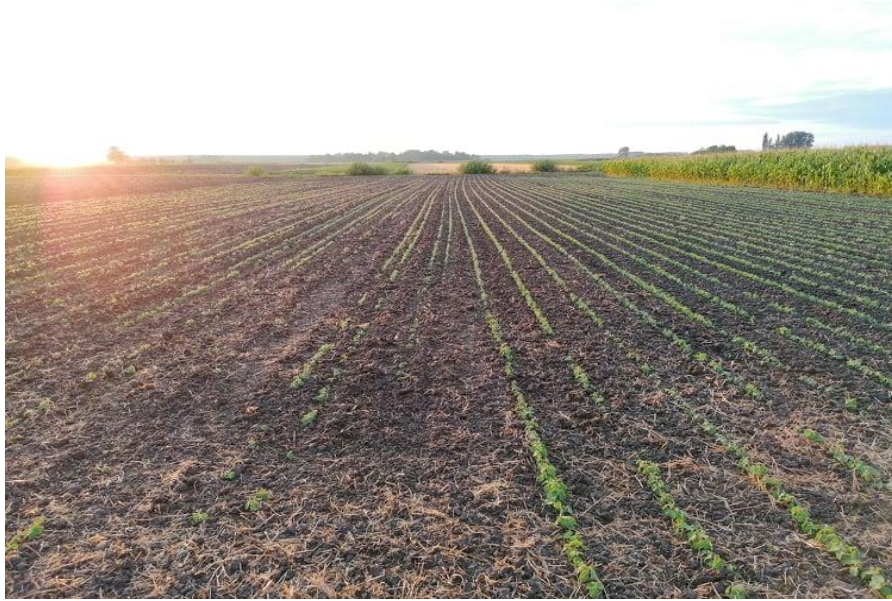
Slika 7. Prikaz dviju glavnih varijanti pokusa