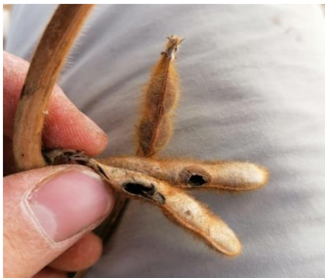
Slika 14. Prikaz oštećenja mahuna soje od štričkovog šarenjaka ( Vanessa cardui L.)

Prskanje je obavljeno s insekticidom Nurelle D (klorpirifos 500 g/l, cipermetrin 50g/l) EC u dozi od 0,75 l ha -1 . Tretman je obavljen u kasno popodne jer se gusjenice za toplog vremena zadržavaju pri vrhu stabljike soje dok je način djelovanja insekticida kontaktno i inhalacijski što je vrlo bitno da se navedeno izbalansira i odradi u pravom trenutku kako bi učinak prskanja bio što viši. Već nakon 10 minuta uočeno je grčenje gusjenica, dok je nakon dva ovaj problem bio riješen. U kasnijim fazama rasta soje, pojavila se druga generacija ovog štetnika, ali ispod praga štetnosti te drugi tretman nije učinjen. Prilikom čupanja podvarijanti pokus uočeno je nekoliko oštećenih mahuna (Slika 14.)