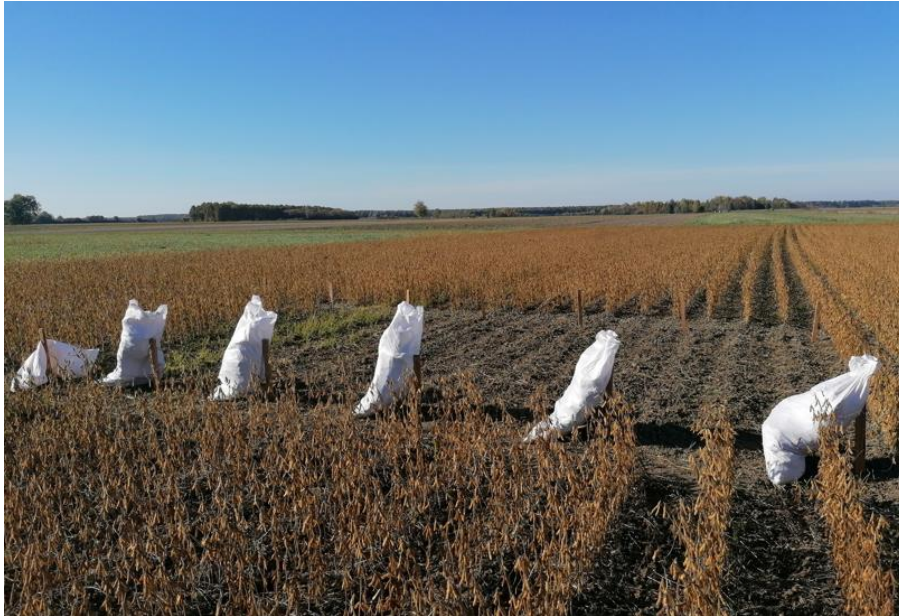
Slika 17. Završen posao prikupljanja biljnog materijala za svaku podvarijantu