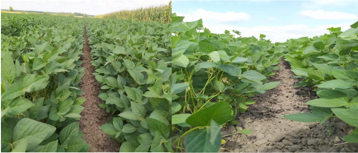
Slika 12. Međuredni prostor nakon kultivacije 50 cm (lijevo) i Twin Row (desno)