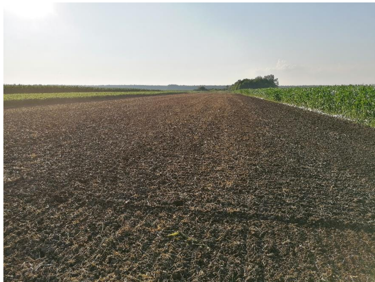
Slika 9. Tlo pripremljeno za sjetvu pokusa nakon dva prohoda rotodrljačom

Nakon obavljenog oranja i tanjuranja, sljedeći dan ujutro pristupljeno je pripremi tla rotodrljačom. Korištena je rotodrljača Maschio Delfino Super DL 3 m radnog zahvata u agregatu s traktorom Case Farmal 105 U. Dubina rada rotodrljače je oko 15 cm uz brzinu rada 2,3 \text{ km h}^{-1} . Ovaj tip tla (ritska crnica) kada je vlažno i kada je obradom zahvaćen velik volumen tla, nemoguće je kvalitetno usitniti za sjetvu u jednom proходу. Istog dana ali nekoliko sati kasnije (nakon što se tlo prosušilo), obavljen je još jedan prohod rotodrljačom radi stvaranja orašasto grašaste strukture sjetvenog sloja tla (Slika 9.).