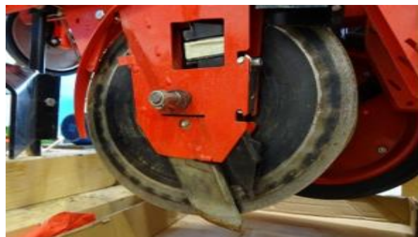
Slika 5. Sjetvena baterija sijačice MaterMacc Twin Row MS 8100 (lijevo), i provodna cijev za sjeme (desno)