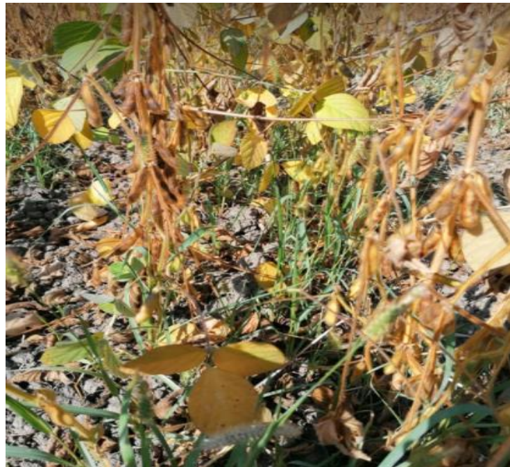
Slika 13. Novi ponik korova iz roda Setaria u drugoj i trećoj podvarijanti Twin Row-a u međurednom razmaku glavnog reda