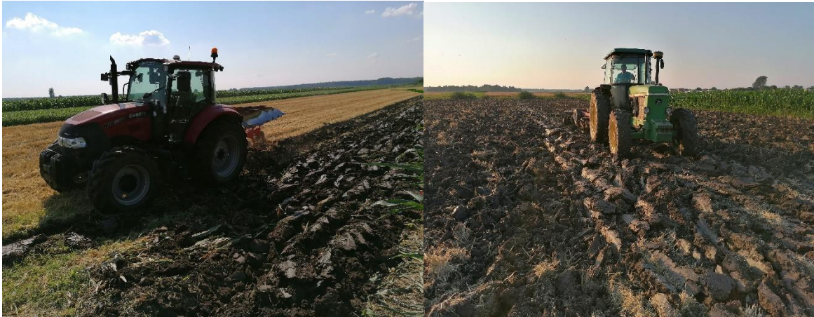
Slika 8. Oranje i tanjuranje kao prvi koraci u priprema tla za sjetvu pokusa