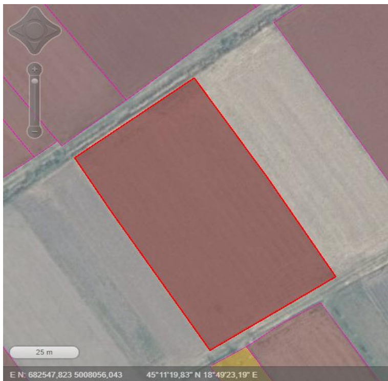
Slika 1. Prikaz pokusne parcele snimljene iz ARKOD preglednika

Pokus je postavljen na k.č. 901, ARKOD ID 3807231, površine 0,49 ha, gdje je pokus zauzeo 2000 m 2 ili 0,2 ha. (Slika 1.) Svaka pokusna varijanta prostirala se na 1000 m 2 te je unutar dvije varijante prorijeđene biljke na 5 m 2 kako bi smo mogli istražiti utjecaj gustoće sjetve pri 69 b/m 2 , 64 b/m 2 i 59 b/m 2 na visinu prinosa zrna. Koordinate pokusa su preračunate u stupnjeve te iznose 45,18822222 stupnjeva sjeverne geografske širine i 18,82302778 stupnjeva istočne geografske dužine. (ARKOD., 2021.)