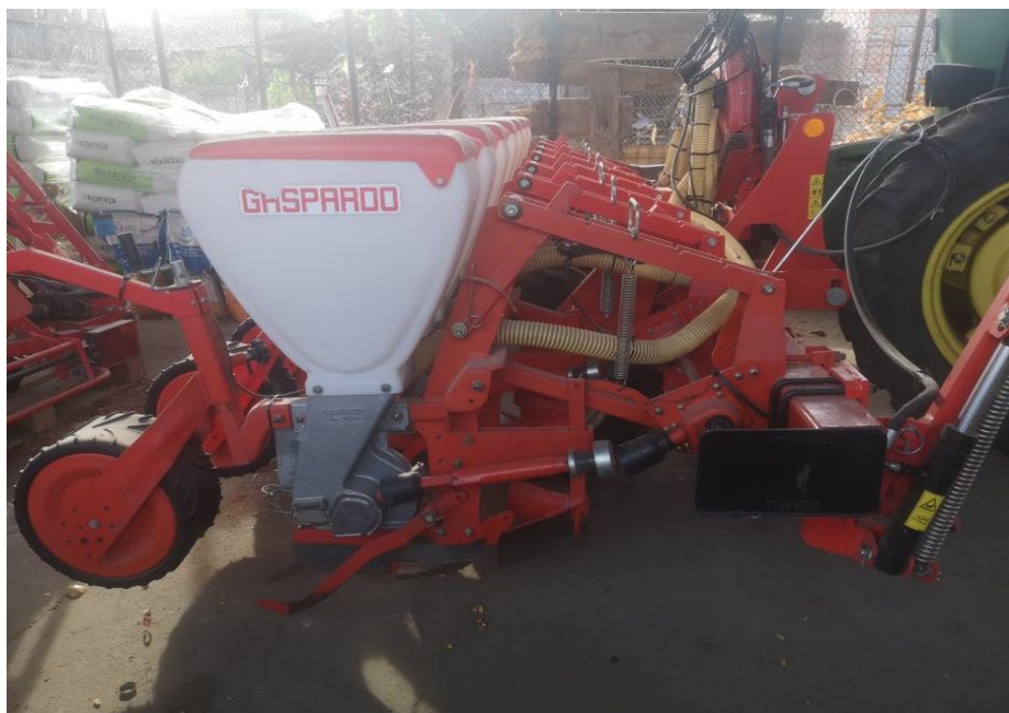
Slika 3. Prikaz sjetvenog aparata u osnovnoj opremi kod sijačice GASPARDO SP