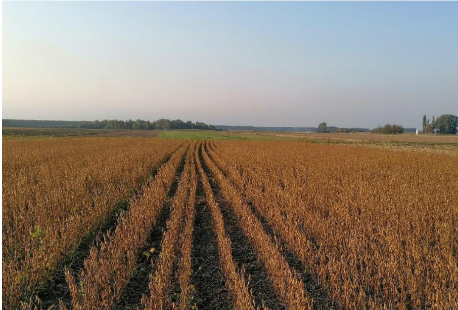
Slika 16. Prikaz dviju varijanti neposredno pred žetvu