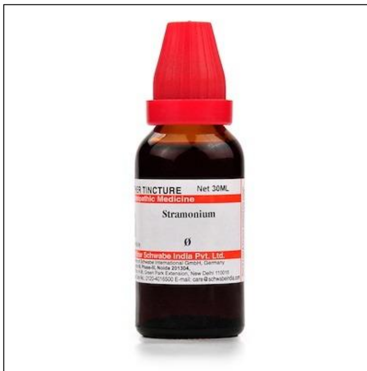
Slika 8. Tinktura bijelog kužnjaka ( D. stramonium )

Simptomi trovanja kužnjakom su: uznemirenost, konfuzija, pospanost, klonulost, hodanje prelazi u geganje, posrtanje, pojava halucinacija, ubrzanje srčanog pulsa, gubitak pamćenja, suhoća usta, mučnina, suhoća kože, širenje zjenica oka, nejasan govor, povišena tjelesna temperatura, žeđ, nesvjestica, nekontrolirano mokrenje (Grlić, 1989., Lesinger, 2006.b).