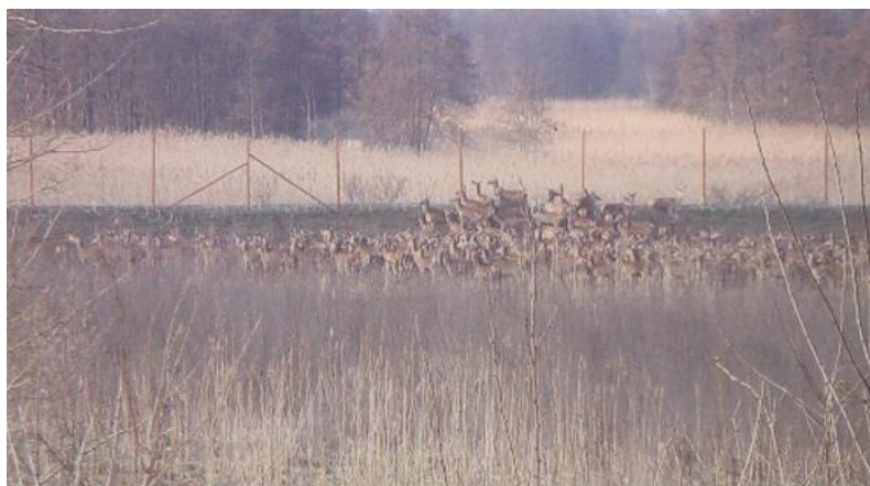
Slika 13. Krdo jelenske divljači snimljeno uz žicu u ožujku 2016. u zajedničkom otvorenom lovištu broj XIV/167 Duboševica

Postavljena žica na granici s Mađarskom uzrokovala je značajne posljedice na životinjski svijet. Nepovoljni i štetni utjecaji bodljikave “žilet” žice koja je smještena ispred ograde predstavlja opasnost za sve vrste divljači, također visoka ograda od 3 metra u potpunosti sprječava migraciju divljači. Prvobitna zamisao je bila ukloniti žilet žicu nakon postavljanja visoke ograde, ali to nije učinjeno. I dalje se bilježe slučajevi stradavanja divljači u manjem broju, ali glavni problem je ostao. Onemogućene su dnevne i sezonske migracije jelenske divljači, te je postavljanjem žice populacija razdvojena pri čemu se ne zna koliko ih je ostalo s jedne, a koliko s druge strane. Stoga postavljanjem visoke ograde dolazi do narušavanja prirodne ravnoteže u staništu, te dovodi do poremećaja u ponašanju i migracijskim navikama divljači. Ovaj problem je još veći u sezoni rike jelenske divljači, koja se događa krajem kolovoza i početkom rujna, jer nemogućnošću migracije dolazi i do nemogućnosti miješanja genetskog materijala, što dugoročnim ostavljanjem ograde može imati neželjene posljedice po populaciji jelenske divljači s obje strane.