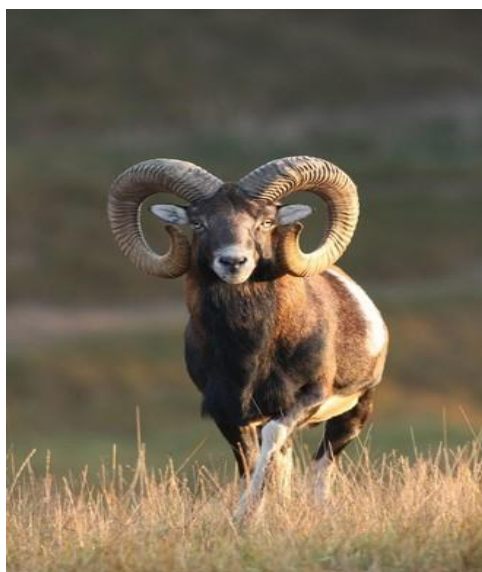
Slika 4. Muflon

Staništa muflona su brda i planine pod mediteranskim šumama, pašnjacima, ali se prilagođava kontinentalnim uvjetima. U Hrvatskoj se može naći na Papuku, Petrovoj gori, Iloku, Brijunima, Cresu i Rabu. Mase je 40 do 50 kg (Kuhada, 2016.). Parenje započinje u listopadu i studenom.