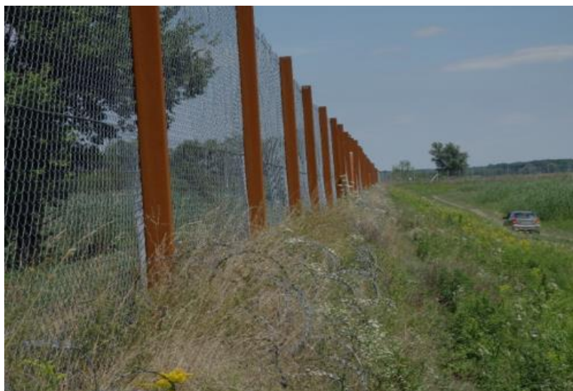
Slika 12. Žilet žica i visoka ograda u lovištu XIV/167 Duboševica