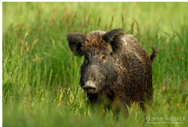
Slika 5. Divlja svinja

Spada među najraširenije vrste sisavaca u Europi. Nomadska je životinja, živi u šumama jele, hrasta i bukve. Traže staništa koja u blizini imaju mjesta s vodom, na takav način se rješavaju nametnika. Vrlo je dobar plivač. Masa mužjaka seže do 300 kg, dok je ženke upola manja. Razdoblje parenja traje od polovice studenog do početka veljače. U Hrvatskoj je nalazimo na cijelom kontinentu i jadranskoj obali, pa tako i na otocima Krk, Cres, Mljet, Hvar i Brač (Merkler, 2012.).