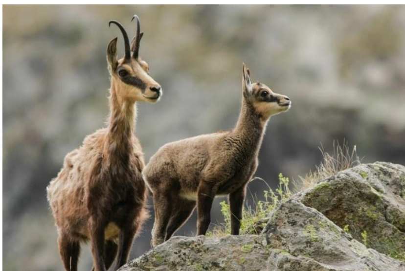
Slika 3. Divokoza (ženka i jare)

Žive u kršu, planinama i planinskim travnjacima, dok se zimi sele u niže krajeve gdje je snijeg plići da mogu lakše naći hranu. U Hrvatskoj ih možemo naći na Biokovu, Velebitu, Risnjaku i Snježniku. Sezona parenja kreće u jesen i traje do prosinca. Divokoza je mase do 35 kg, dok je divojarac do 45 kg (Kuhada, 2016.).