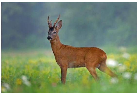
Slika 2. Srna obična (srnjak)

Srna je široko rasprostranjena u cijeloj Hrvatskoj, izuzev nekih otoka. Vjerna je staništu pa su njene migracije kratke, svega u krugu nekoliko kilometara. Staništa su joj bjelogorične i miješane šume, a vrlo često ih nalazimo u poljima uz šumarke. Vrlo su adaptivne pa se mogu vidjeti u blizini naselja. Masa srna je 17 do 25 kg, a srnjaka 20 do 30 kg (Kuhada, 2016.). Pare se tijekom srpnja i kolovoza.