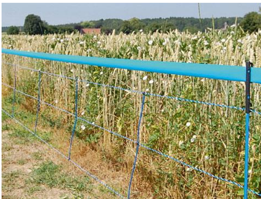
Slika 16. Električna ograda

Za zaštitu manjih poljoprivrednih površina koriste se privremene električne ograde. Jednostavne su za postavljanje, najveći nedostatak je trošak generatora. Jakost impulsa ovisi o vrsti životinje, duljini ograde te se postavlja na 9 V, 12 V, 230 V. Potrebno je ostaviti čistinu ispred ograde kako bi divljač mogla uočiti prepreku. (Tucak i sur., 2006.).