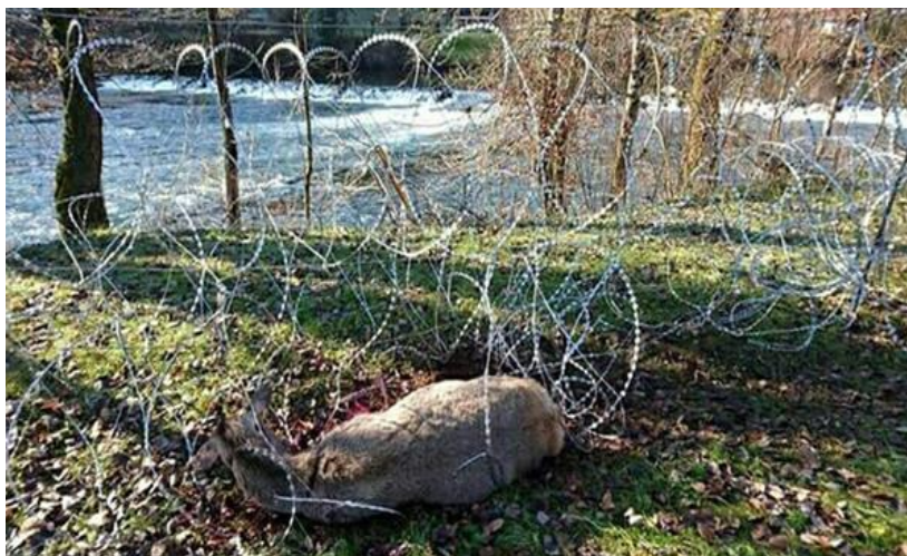
Slika 11. Jelenska divljač zapetljena u žilet žicu