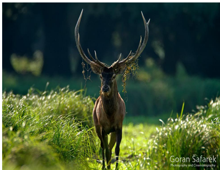
Slika 1. Jelen obični