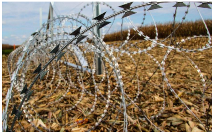
Slika 9. Žilet žica

U rujnu 2015. godine Republika Mađarska podiže žilet žicu na granicu sa Republikom Hrvatskom u dijelu Osječko-baranjske županije. Nedugo kasnije postavili su također i ogradu koja je bila visoka cca 3 metra (Florijančić i sur., 2016.).