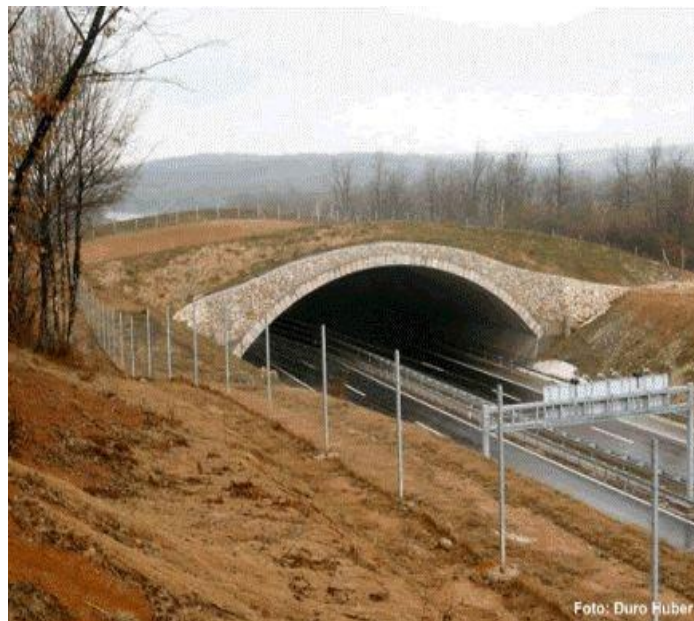
Slika 8. Zeleni most

Autocesta A5 kao dio paneuropskog koridora Vc ide od mađarske granice s Hrvatskom na sjeveru Baranje do granice s Bosnom i Hercegovinom kod mjesta Svilaj. Svojom trasom zajedno sa zaštitinim pojasom prolazi kroz lovišta, često presijeca njihove granice dijeleći ih na dva ili više dijelove, smanjuje njihovu površinu te narušava ekološke uvjete staništa. Negativan utjecaj autoceste je prisutan kod lovišta kojima autocesta presijeca lovište na dva ili više dijela, tako da preostali dio više nije racionalno uključiti u domicilno lovište. Negativan utjecaj je prisutan u većoj ili manjoj mjeri gotovo kod svih lovišta, a najviše je u baranjskom dijelu izražen kod zajedničkih otvorenih lovišta broj XIV/163 „Luč“, XIV/154 „Jagodnjak“, XIV/161 „Čeminac“, XIV/155 „Darda“ i XIV/151 „Petrijevci“.