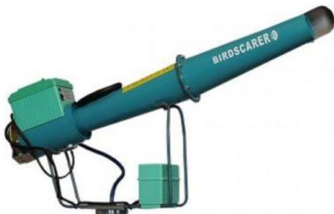
Slika 17. Plinski top

Za plašenje divljači koriste se plinski topovi koji su smješteni na odgovarajućoj udaljenosti i uključuju se u pravilnim vremenskim razmacima. Korištenje plinskih ili zvučnih topova trebalo bi se s vremenom povećavati jer se divljač jako brzo navikne na učestale zvukove, te bih se svakih nekoliko dana trebala micati tj. mijenjati učestalost uključivanja.