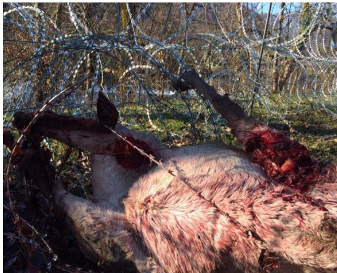
Slika 10. Uginuća jelenske divljači pri zaplitanju u žilet žicu