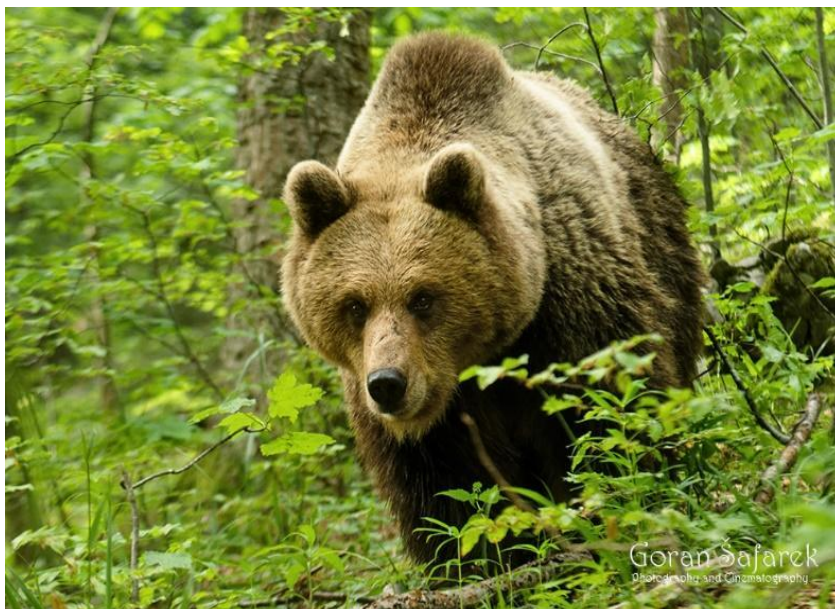
Slika 6. Smeđi medvjed

Medvjedi započinju razdoblje neaktivnosti od listopada do prosinca, a nastavljaju s aktivnostima te kratkim dnevnim migracijama od ožujka do svibnja, pri čemu točno razdoblje ovisi o lokaciji, vremenu i stanju pojedinca. U južnim područjima to je razdoblje neaktivnosti vrlo kratko ili ga uopće nema. To je razdoblje obilježeno dubokim snom u kojem medvjedi dopuštaju da im tjelesna temperatura padne za nekoliko stupnjeva (Janicki i sur., 2005.).