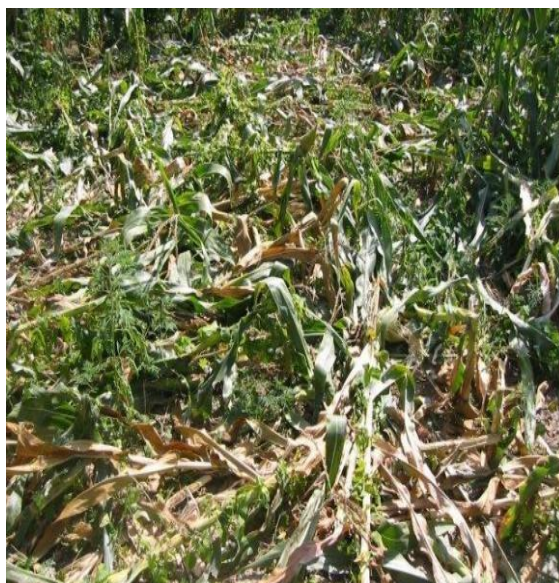
Slika 15. Štete na poljima od divljači

Kao posljedice dnevnih migracija, često kao posljedica pronalaženja hrane, javljaju se gospodarske štete na poljoprivrednim (slika 15.) i šumskim kulturama zbog ograničenog korištenja pojedinih prirodnih resursa.