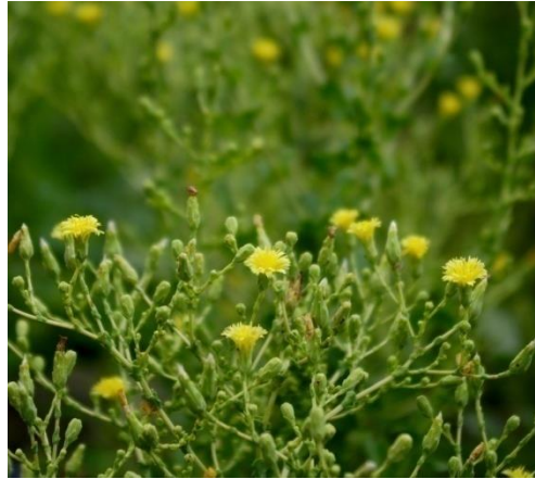
Slika 5. Cvijet salate

Cvjetovi salate su sastavljeni u cvat glavicu, a ona je obavijena pricvjetnim listovima (slika 5.). U svakom cvatu se nalazi oko 15 dvospolnih, jezičastih, žutih cvjetova. Iako su cvjetovi samooplodni, moguća je i stranooplodnja koja podrazumijeva prisustvo kukaca (Parađiković, 2014.).