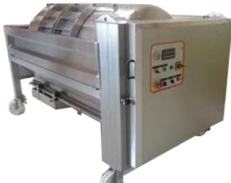
Slika 4. Preša za prešanje grožđa

Prešanje je drugi po redu proces u preradi grožđa. Prešanje se odvija u dvije faze: prskanje kožice bobica u kojem se oslobađa samotok iz sredine bobice, te druga faza, gnječenje bobica gdje se pod povećanim pritiskom oslobađa sok iz periferne zone. Prešanje masulja moramo se obaviti što je moguće brže, a ciklus prešanja mora biti što kraći jer tako sprječavamo pretjeranu i nepoželjnu oksidaciju mošta. Prešanjem s povećanim pritiskom dobivamo veće količine mošta, ali takav mošt je slabije kvalitete. Tijekom prerade grožđa do 40% mošta dobijemo postupkom muljanja-cijeđenja, a prešanjem dobijemo ostatak mošta. Prešanje se može obaviti kontinuirano ili diskontinuirano. Preše kod diskontinuiranog procesa ne oštećuju krute dijelove masulja, tako da se one mogu koristiti za proizvodnju visoko kvalitetnog vina, ali postupak prešanja duže traje, te je potrebna dodatna ljudska snaga. Ostatci od prešanja se nazivaju se drop, trop, kom ili komina, te predstavljaju krutu fazu s masenim udjelom masulja. U ostacima i dalje ostaje šećera, kiselina i pigmenata (Zoričić, 1996.).