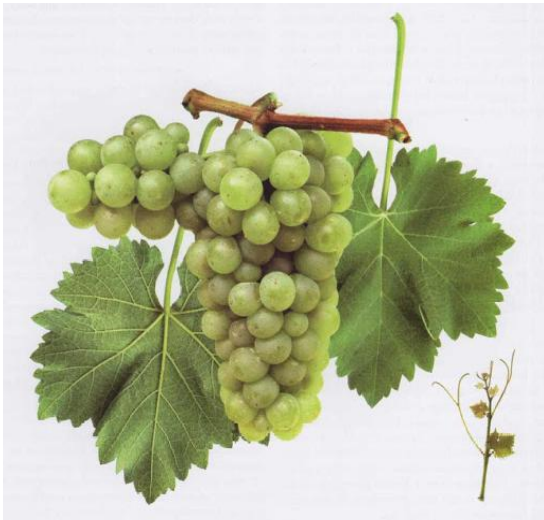
Slika 1. Sauvignon bijeli

Dozrijeva u drugom razdoblju. Radi bujnosti sorte važan je pravilan odabir podloge, prikladno tlo i izbor položaja. U dubljim i plodnijim tlima, te na podlogama jačeg rasta reže se na dugo rodno drvo, a u mršavijim kraće. Prikladan je za srednje visoki i za povišeni sustav uzgoja. Rodnost je srednja i redovita. Srodnost s američkim podlogama je dobra, ali se u plićim tlima ne preporučuju podloge vrlo snažnog rasta, kao na primjer Rupestris du Lot. Otpornost na smrzavanje je dosta dobra, prema gljivičnim oboljenjima nešto slabije otporna (Maletić i sur., 2008.).