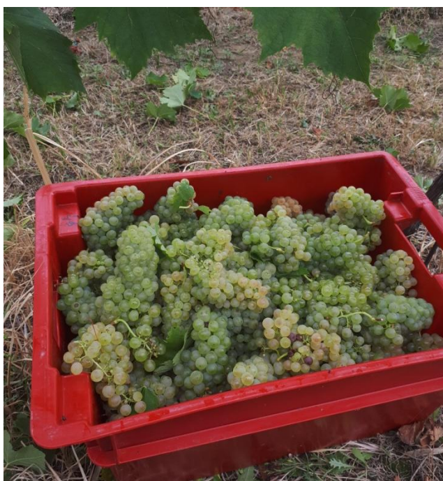
Slika 2. Berba grožđa u plastične posude

Prerada grožđa počinje berbom. Prije svega treba napraviti pripremne radove, osigurati radnu snagu i transport ubranog grožđa. Grožđe se bere kada postigne tehnološku zrelost odnosno kada je omjer šećera i kiselina optimalan. Svaka sorta ima svoje karakteristike koje se razlikuju u sadržaju šećera, kiselina, tvari arome, boje i drugih komponenata te zastupljenosti pojedinih dijelova grozda kao što su peteljkovina, pokožica ili sjemenke. Šećeri i kiseline su osnovni sastojci koji utječu na kvalitetu mošta i vina, te se zato na osnovu njih određuje tehnološka vrijednost grožđa. Od zdravog grožđa s optimalnim sadržajem šećera i kiselina možemo dobiti vina visoke kvalitete. Berbu treba obavljati po toplom i suhom vremenu, te paziti da ne oštetimo grozdove pažljivo ih stavljajući u plastične posude (Slika 1.). Kišovito vrijeme prije berbe može utjecati na niske sadržaje šećera u grožđu, a ukoliko su razine šećera velike dolazi do problema da previše šećera fermentira u previše alkohola. Postotak alkohola za bijela vina otprilike iznosi 11 – 13 %, a za crna vina iznosi 12 – 14 % alkohola. Sadržaj šećera u grožđu može varirati, ali obično je to od 18 do 24 % šećera (Radovanović, 1986.).