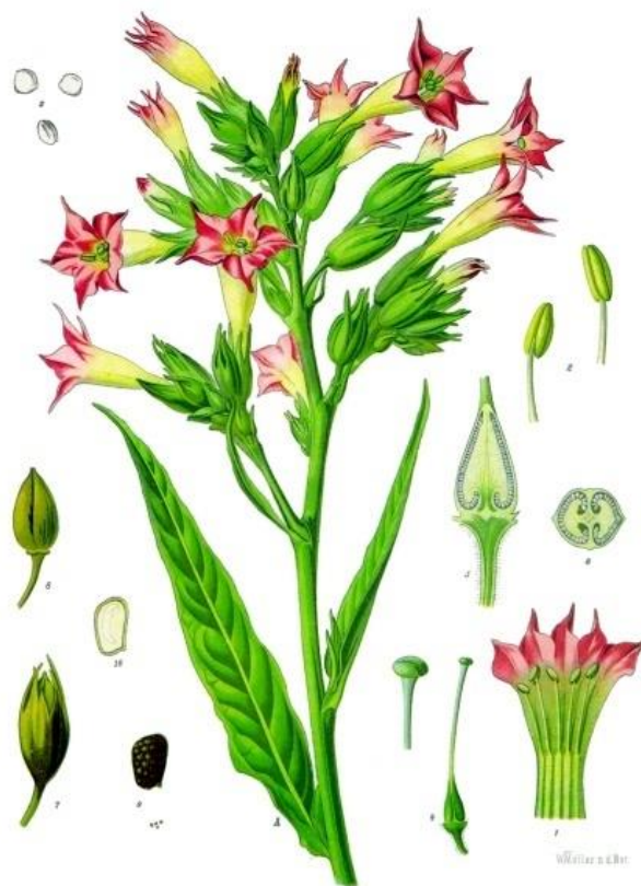
Slika 9. Shematski prikaz biljnih dijelova pravog duhana