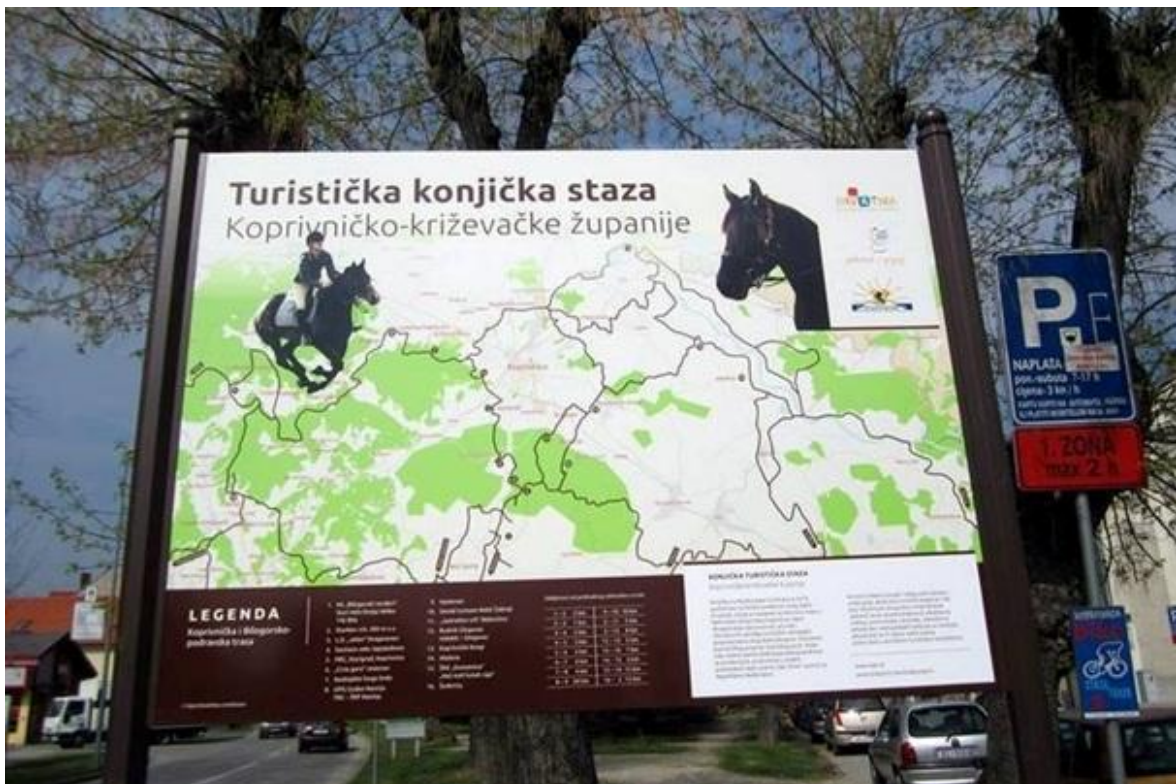
Slika 5. Turistička konjička staza Koprivničko-križevačke županije

županije stranim turistima. Oko 280 km staze podijeljeno je u tri regije: koprivničku, križevačku i đurđevačku. Otvorenje konjičkih staza bio je prvi korak prema konjičkom turizmu kojeg bi se još dodatno moglo unaprijediti (kckzz.hr). Bliska suradnja s Bjelovarsko – bilogorskom županijom gdje je ovaj tip turizma razvijeniji može pomoći u dijeljenju iskustava kako bi se izbjegli potencijalni problemi. Koprivničko–križevačka županija je u suradnji s Bjelovarsko–bilogorskom županijom radila na uređenju dodatnih 300 km staza za jahanje koje su danas i certificirane. U sklopu projekta se planira dodatna izgradnja novih kilometara, a plan je proširiti konjičku turističku stazu od Koprivnice, kalničkog gorja, sjevernih obronaka Bilogore, grada Križevaca i na kraju, povezivanje sa Zagrebačkom županijom. Isplanirana je i razvijena konjička turistička staza koja se proteže od mjesta Jabučeta, Virja, Đurđevca, Molva pa sve do Malog Bukovca kako bi se povećala ponuda u aktivnom turizmu, a razvijena je i podloga za porast dolazaka gostiju. Naravno, potrebno je unaprijediti razvoj konjičkih turističkih staza, pridruženih centara i povezivanje usluga (TZ KKŽ, Elaborat certifikacije, 2019.).