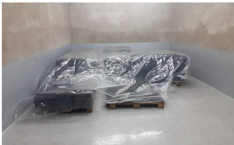
Slika 27. Prostorija za klijanje paprike

Nakon klijanja, presadnice se premještaju u dva plastenika od 120 m 2 i 50 m 2 gdje nastavljaju svoj daljnji rast i razvoj. Temperature se u plastenicima kreću od 22 – 25 °C tijekom dana i tako sve dok se ne presade na otvoreno polje. Zalijevanje biljaka se provodi svaka 3 dana do zasićenja supstrata vodom kada je biljka manja, a kada naraste i kada su visoke temperature u plasteniku tada se zalijeva i do 2 puta na dan.