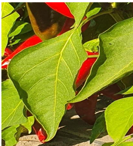
Slika 5. List paprike