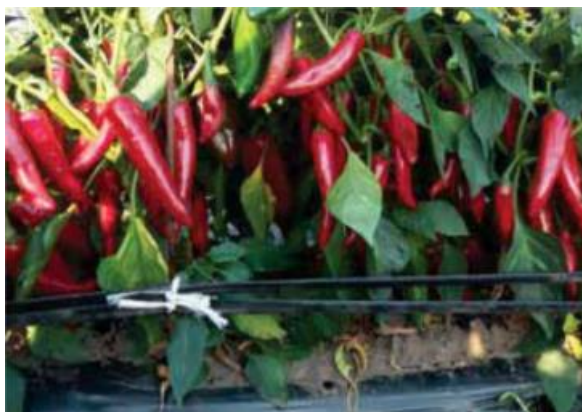
Slika 24. Palotás F1

Palotás F1 (Slika 24) se ističe lakoćom branja, koncentriranim tj. ujednačenim dozrijevanjem, visokim prinosom, stabilnom koncentracijom tj. sadržajem boje kroz cijeli plod što daje prvorazrednu sirovinu i kvalitetu mljevene začinske paprike. Sadrži veliku količinu suhe tvari što doprinosi i većoj količini mljevene paprike. Može imati i do 20 plodova po biljci koji su izrazito krupni. Biljka je jakog korijena te jako dobro usvaja vodu i hranjive tvari, ima intenzivan porast te nešto krupnije listove i jako dobro podnosi sušu.