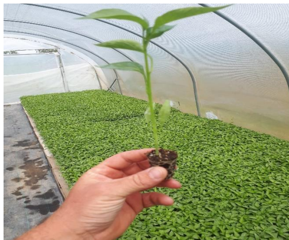
Slika 2. Biljka paprike

Korijen paprike je vretenast, razgranat, ali je prilično plitko razvijen za razliku od drugih kultura i slabe je usisne moći. Veoma brzo počinje sa svojim grananjem i dostiže dubinu i do 70 cm, a širina se kreće od 30 do 40 cm i ovisi o sorti (Slika 2 i 3).