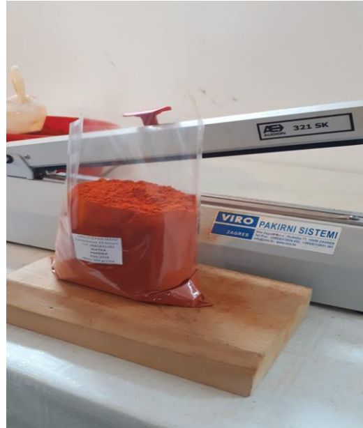
Slika 36. Pakiranje paprike