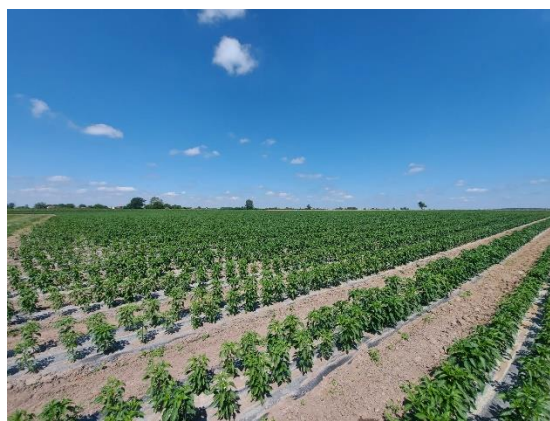
Slika 31. Navodnjavanje kap po kap

Navodnjavanje se provodi svaka 2 – 3 dana kasno popodne ili ujutro, jer tada su niže temperature i ne dolazi do prevelikog isparavanja iz tla i biljka puno lakše usvaja vodu jer se ne nalazi u uvjetima previsokih temperatura.