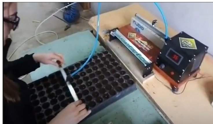
Slika 26. Sjetva paprike u plastične kontejnere

Nakon sjetve, plastični kontejneri se slažu na euro paletu zbog lakše manipulacije te se odnose u manju prostoriju u kojoj će sjeme klijeti 4-5 dana. Temperature se u prostoriji za vrijeme klijanja kreću od 27 – 30 °C, a u ovakvim uvjetima paprika vrlo brzo klija. Kontejneri se ne odnose u plastenik na klijanje iz razloga što je potrebno puno više energije za zagrijavanje plastenika nego za zagrijavanje manje prostorije. Prostorija je izolirana te se na ovakav način dugo održava ciljana temperatura. Paprika se pokriva najlonom kako supstrat ne bi gubio preveliku količinu vlage (Slika 27).