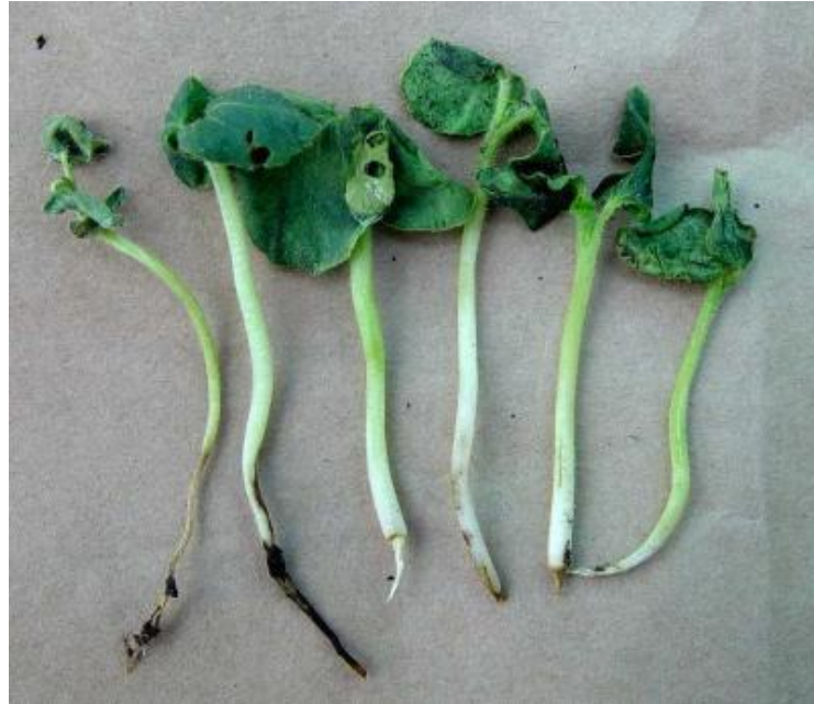
Slika 17. Zaraza na mladim presadnicama