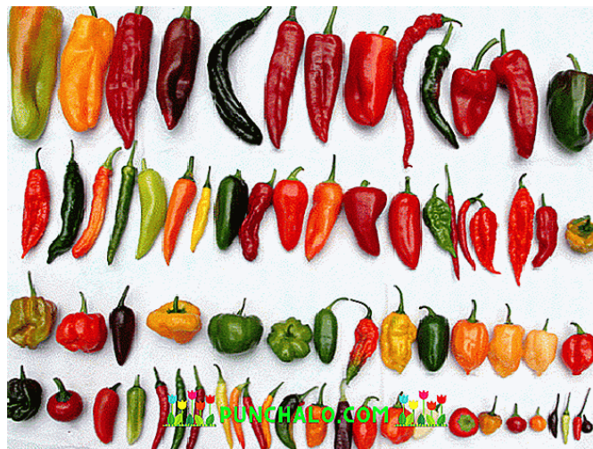
Slika 7. Oblici paprike

Plod predstavlja šuplja boba različitih oblika, veličine i boje, Sastoji se od mesa (perikarpa) i placente sa sjemenkama, a placenta je rahlog tkiva koja može biti okruglog ili ovalnog oblika. Oblik ploda može biti raznih oblika poput zvonolikog, okruglog, stožastog, prizmatičnog pa sve do rožastog oblika (Slika 7). Boja plodova mnogo varira i ovisi o kojima se organskim pigmentima radi. Plodovi mogu biti: tamnozelene, žute, ljubičaste pa sve do izrazito crvene boje. Plod se može grupirati u klase po određenim veličinama, od 10 g je sitan plod, srednje krupan je od 40 – 70 g, krupan 70 – 150 g i vrlo krupan više od 150 g. Začinska paprika svojom veličinom se ubraja u srednje krupne plodove. Unutar ploda se nalazi sjemenska loža koja na sebi sadrži većinu sjemenki, dok se manji dio nalazi na stjenkama pregrade ploda. Jedan plod paprike u sebi može formirati te sadržavati od 500 – 600 sjemenki, a ponekad i više što jako ovisi o sorti paprike (Paradić, 2009.).