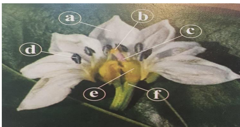
Slika 6. Presjek cvijeta paprike