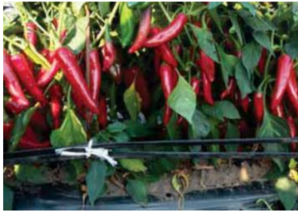
Slika 24. Palotás F1

Palotás F1 (Slika 24) se ističe lakoćom branja, koncentriranim tj. ujednačenim dozrijevanjem, visokim prinosom, stabilnom koncentracijom tj. sadržajem boje kroz cijeli plod što daje prvorazrednu sirovinu i kvalitetu mljevene začinske paprike. Sadrži veliku količinu suhe tvari što doprinosi i većoj količini mljevene paprike. Može imati i do 20 plodova po biljci koji su izrazito krupni. Biljka je jakog korijena te jako dobro usvaja vodu i hranjive tvari, ima intenzivan porast te nešto krupnije listove i jako dobro podnosi sušu.