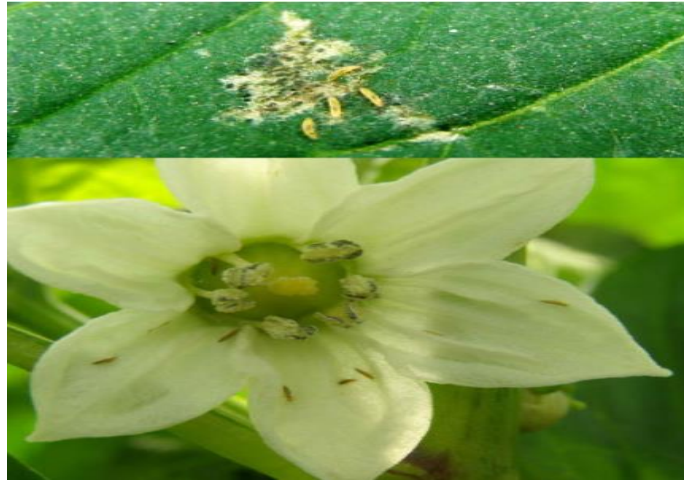
Slika 20. Štete od kalifornijskog tripsa