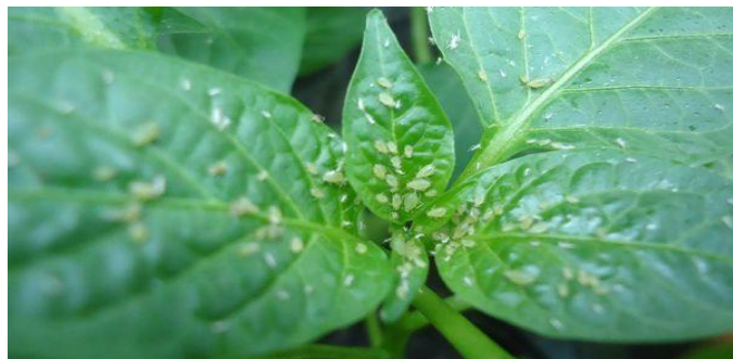
Slika 18. Lisne uši na listu paprike

Lisne uši ( Aphidae ) prave znatne štete kada su biljke u ranijim fazama razvoja, pogotovo kod uzgoja presadnica (Slika 18). Pojavu lisnih ušiju na najmlađem vršnim dijelovima paprike treba kontrolirati već kod proizvodnje presadnica, a posebno nakon presađivanja na otvorene gredice ili u polje. Štete od lisnih ušiju su vidljive na vršnom lišću gdje sisaju biljne sokove i biljke gube prirodnu zelenu boju. Ponekad ukoliko je veći napad tada se mlade biljke deformiraju. Mogu prenositi razne viruse sa svojim usnim aparatom poput virusa mozaika krastavca, Y virus krumpira i slično.