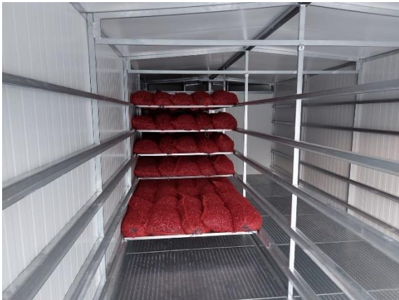
Slika 33. Postavljanje paprike u sušaru

sušari. Nakon sušenja paprika se ostavlja da se ohladi nakon čega se iznosi iz sušare i prebire na stolu. Sve paprike koje su oštećene prilikom transporta ili prilikom berbe, a da nije bilo tada uočeno, u ovoj fazi se odvajaju.