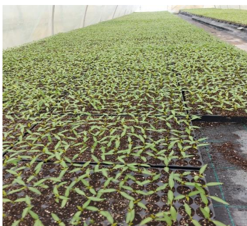
Slika 12. Sjetva u PVC kontejnere