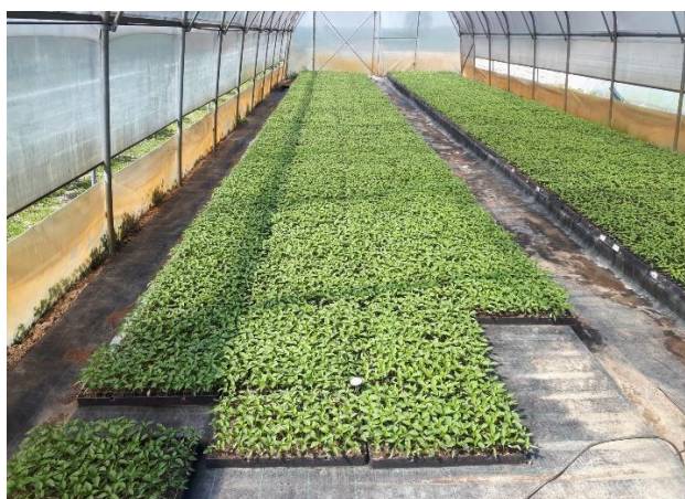
Slika 10. Uzgoj presadnica paprike u supstratu