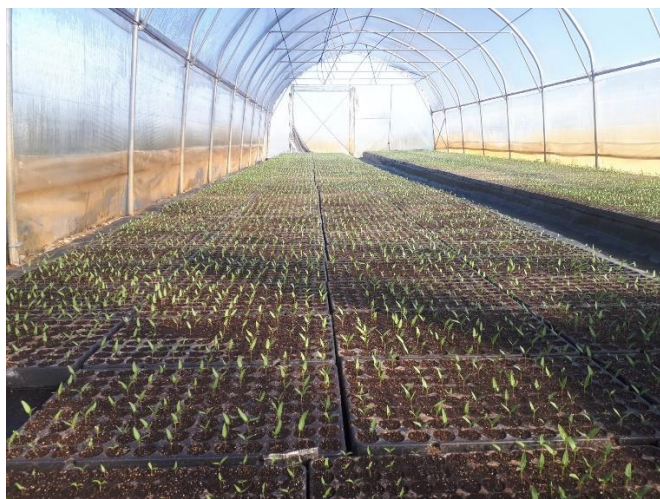
Slika 28. Presadnice u plasteniku

Nakon klijanja, presadnice se premještaju u dva plastenika od 120 m 2 i 50 m 2 gdje nastavljaju svoj daljnji rast i razvoj. Temperature se u plastenicima kreću od 22 – 25 °C tijekom dana i tako sve dok se ne presade na otvoreno polje. Zalijevanje biljaka se provodi svaka 3 dana do zasićenja supstrata vodom kada je biljka manja, a kada naraste i kada su visoke temperature u plasteniku tada se zalijeva i do 2 puta na dan.