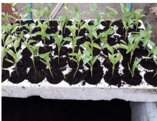
Slika 11. Sjetva u polistirenske kontejnere

Za srednje ranu proizvodnju uzgoj presadnica u kontinentalnoj Hrvatskoj započinje krajem veljače, a sadnja se odvija tijekom travnja. Kod ranije proizvodnje potrebno je više sjemena za sjetvu od 8 – 10 g/m 2 , a za kasniju proizvodnju sjetva je nešto rjeđa sa 6-8 g/m 2 . Nakon sjetve 20 – 25 dana započinje pikiranje presadnica kada su se razvila dva stalna lista, što najčešće ovisi o temperaturi i svjetlu. Mlade biljke se zasjenjuju kako se ne bi gubila vlaga iz njih i ovo se primjenjuje izrazito kada je jako sunce, jer nepotrebno gubljenje vode iz presadnice nije poželjno. Pod utjecajem velike sunčeve topline postoji mogućnost da dođe do izduživanja presadnica. Sjetva se obavlja u gotove hranjive supstrate u polistirenske (Slika 11) ili PVC kontejnere (Slika 12).