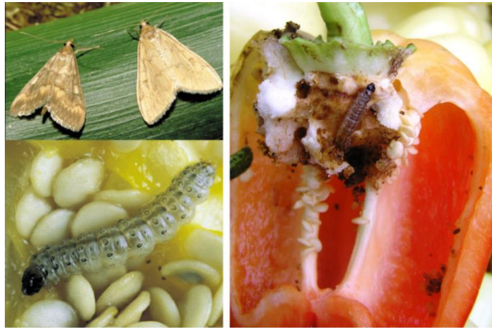
Slika 19. Štete od kukuruznog molja na paprici

Kukuruzni moljac (Slika 19) zbog čestog uzgoja kukuruza kao monokulture može napraviti značajne štete na paprici jer vrlo često napada papriku i rajčicu. Gusjenice se nakon izlaska iz jaja ubušuju u plodove paprike i najčešće se hrane i ubušuju u sjemenu ložu. Ponekad je teško primjetiti napad štetnika jer rupe koji buši ponekad znaju biti uz peteljku ploda. Suzbijanje je potrebno provesti prvo na izvorima pojave štetnike kao što su stara kukuružišta i bljni ostaci te biljke domaćina na kojim se nalazi. Dozvoljene aktivne tvari za suzbijanje moljca su lufenuron i metaflumizon.