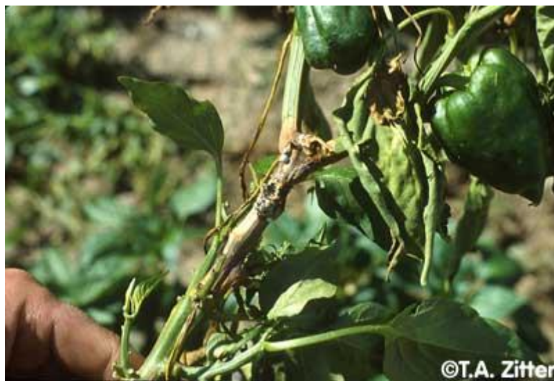
Slika 15. Bijela trulež paprike

Sclerotinia sclerotiorum je uzročnik bijele truleži. Napada više od 400 domaćina kultiviranih i korovnih vrsta. Osnovni izvor zaraze predstavljaju sklerocije koje kasnije kliju u micelij ili apotecij sa askusima i askosporama. Klijanjem sklerocija u tlu nastaje micelij koji se prvo naseli na mrtvu organsku tvar, a zatim prodire u korijen i vrši zarazu. Ukoliko se radi o stabljičnom tipu bolesti zarazu obavljaju askospore, odnosno hife se iz prokljalih askospora šire na lisnu peteljku i stabljiku. Zaraza se može pojaviti i na neoštećenim dijelovima stabljike koju vrše askospore. Suzbija se na način da se treba poštivati plodored (4 – 6 godina), sjetva zdravog sadnog materijala, uništavanje korova i upotrebom kemijskim sredstava.