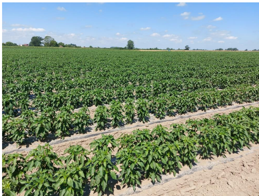
Slika 13. Uzgoj paprike na otvorenom na foliji - navodnjavanje kap po kap

Prije presađivanja presadnica u polje potrebno je odraditi kaljenje biljaka, odnosno postupno prilagođavati biljku na vanjske uvjete. Ovu mjeru je potrebno provoditi 10 – 15 dana prije presađivanja u polje, gdje presadnice otkrivamo, dodatno provjetravamo plastenik i smanjujemo im količinu vode u navodnjavanju. Za sadnju u polje ili u negrijane plastenike koriste se presadnice starosti 45 – 50 dana. U kontinentalnom dijelu Hrvatske paprika se isključivo uzgaja iz presadnica jer postoji mogućnost od kasnih proljetnih mrazeva. Presađivanje se odvija onda kada je tlo dovoljno toplo i kada prestane opasnost od kasnijih mrazeva. Sadnja se obavlja na razmak između redova 70 cm ili ako se radi sadnja na malč foliju tada je razmak između redova i u redu 30 cm. Njega nasada ovisi o načinu uzgoja što znači da ako se paprika uzgaja na malč foliji nema kultiviranja, ali postoje primjeri u praksi da poljoprivrednici koriste ili prenamjenjuju strojeve kako bi mogli obavljati kultivaciju između malč folija. Kultivacija se provodi poslije navodnjavanja 2 – 3 puta u vegetaciji. Prvu prihranu paprike obavljamo 10 dana nakon presađivanja, drugi puta prije stvaranja prvih plodova i treći puta mjesec dana nakon druge prihrane (Parađiković 2009; Vinković i sur., 2018.).