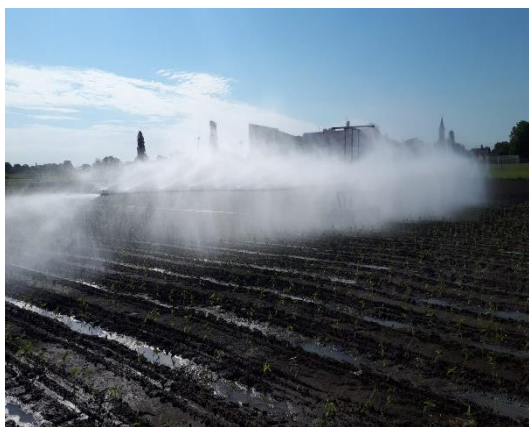
Slika 30. Navodnjavanje kišnim krilom