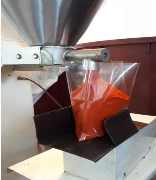
Slika 35. Punjenje vrećice sa paprikom