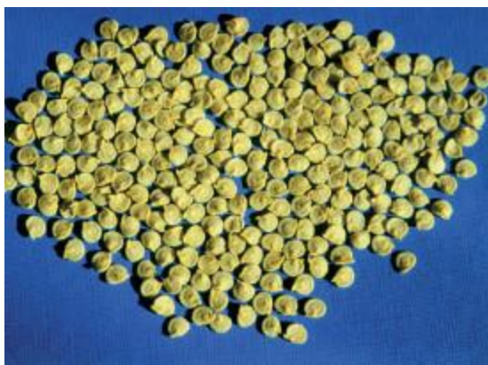
Slika 8. Sjeme paprike