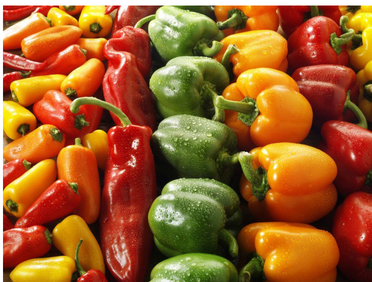
Slika 1. Paprike u raznim bojama

Nijedna povrtna kultura nema toliku raznovrsnost po obliku, veličini, boji i okusu plodova kao što ima paprika (Slika 1). Opća podjela s obzirom na veličinu ploda i primjenu je na krupnoplodne i sitnoplodne paprike (Paradićević, 2009.).