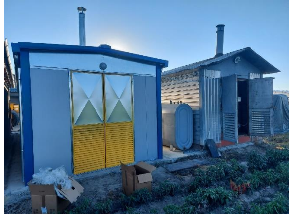
Slika 34. Sušare za začinsku papriku