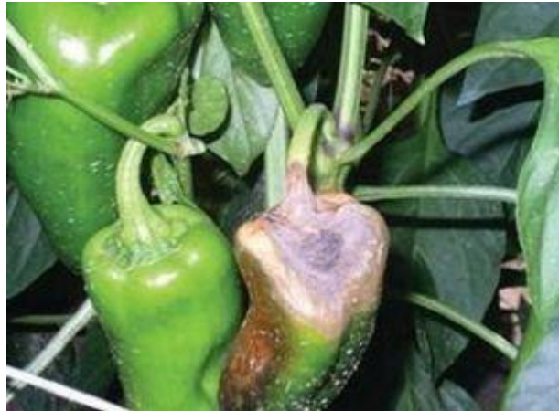
Slika 16. Siva plijesan paprike

prenose relativno lako sa zračnim strujama i vrše zarazu. Jako su važne fitosanitarne mjere za suzbijanje ove bolesti, poput kontrole okolišnim uvjeta (staklenici), agrotehničke mjere i primjena fungicida, daju jako dobre rezultate. Preporuka struke je uklanjanje zraženih biljnih dijelova ili spaljivanje. Siva plijesan se na paprici javlja najčešće na plodovima kroz određene ozljede ili rane.