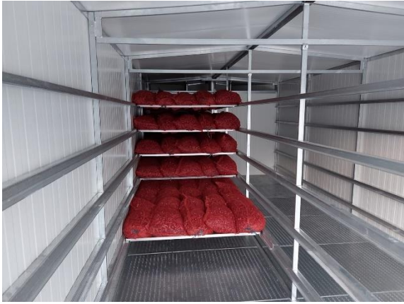
Slika 33. Postavljanje paprike u sušaru

sušari. Nakon sušenja paprika se ostavlja da se ohladi nakon čega se iznosi iz sušare i prebire na stolu. Sve paprike koje su oštećene prilikom transporta ili prilikom berbe, a da nije bilo tada uočeno, u ovoj fazi se odvajaju.