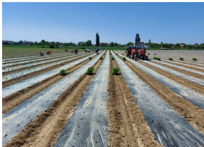
Slika 29. Sadnja paprike

Sadnja paprike se obavlja tek kada prođe opasnost od pojave kasnih proljetnih mrazeva. Tlo je potrebno navodnjavati dan prije sadnje ukoliko je bilo sušno razdoblje. Sadnja se na OPG-u Stjepan Marić odvija početkom mjeseca travnja, ali određeni klimatski uvjeti mogu uvjetovati vrijeme sadnje. Primjer je ova 2021. godina kada su se temperature početkom svibnja kretale od 10 – 16 °C što je vrlo nepogodno za sadnju. Sadnja se na OPG-u obavila 25.5. kada su uvjeti za sadnju bili povoljni. Veliki problem ovako kasne sadnje odnosno dužeg uzgoja presadnica u plasteniku je njihovo izduživanje, što nije pogodno za dobivanje kvalitetne presadnice. Prilikom sadnje se koristila sadilica tip Hortec Due Manual uz istovremeno postavljanje folije i sustava za navodnjavanje kap po kap. Ove proizvodne sezone se sadilica koristila isključivo za postavljanje folije i sustava za navodnjavanje dok se sadnja presadnica obavljala ručno. Sadnja se odvijala ručno zbog toga što prilikom sadnje sadilicom, posađena biljka ponekad bude prislonjena na crnu malč foliju što izaziva opekotine na listu paprike i ne utječe povoljno na njezin razvoj. Razmak paprike u redu je iznosio oko 25 cm, a između redova oko 30 cm.