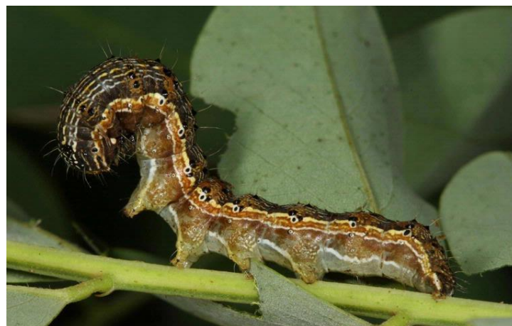
Slika 21. Žuta kukuruzna soвица

Žuta kukuruzna soвица ( Helicoverpa armigera ) je jedan od najopasnijih štetočina poljoprivrednih kultura (Slika 21). Na njezin razvoj povoljno utječu visoke temperature i padaline početkom proljeća i visoke temperature tijekom ljeta. Tijekom godine razvija dvije to tri generacije i prezimi u stadiju kukuljice. Leptiri lete od svibnja do listopada, a najviše ih nalazimo tijekom kolovoza i rujna. Oplođene ženke odlože u prosjeku i do 500 jaja na generativne organe biljaka. Štete rade na takav način da se gusjenice ubušuju u plodove paprike najčešće uz peteljku ploda. Štete je moguće smanjiti uz korištenje tolerantnih sorti i hibrida, određenim agrotehničkim mjerama, te uporabom biološkim i kemijskih sredstava (Parađiković, 2009).