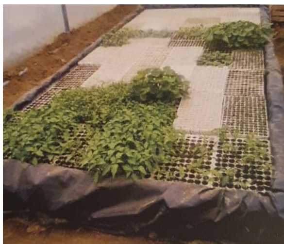
Slika 9. Uzgoj presadnica paprika u hranjivoj otopini

Ranija proizvodnja zahtjeva i sjetvu presadnica u pravo vrijeme kako bi na vrijeme uspjele narasti do vremena sadnje. Presadnice se za ranu proizvodnju siju u toplim lijevama, plastenicima i staklenicima, za srednje ranu u polutopljim lijevama, a za kasnu proizvodnju na otvorenim gredicama. Dobivanje kvalitetne presadnice najviše ovisi od načina uzgoja i supstrata u kojem se uzgaja. Mogu se uzgojiti na uobičajen način u supstratu ili u hranjivoj otopini metodom plutajućih kontejnera (Slika 9 i 10) (Parađiković 2009; Vinković i sur, 2018.).