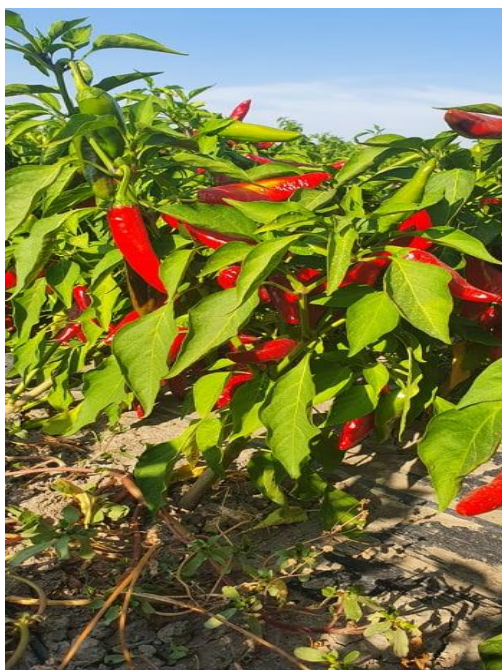
Slika 22. Szikra F1