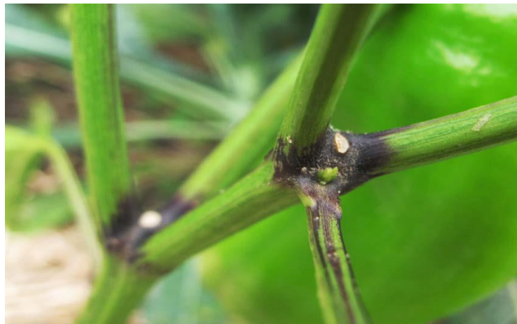
Slika 4. Stabljika paprike

stabljike i međukoljenaca (internodija). Stabljika ima mogućnost rasta od 40 – 200 cm, što u pravilu zavisi od vrste kultivara i njezinom načinu uzgoja (Slika 4). Sorte paprike se razlikuju po tipu rasta paprike koji može biti neograničen ili indeterminantan, ograničen ili determinantan i poluograničen ili semideterminantan. Indeterminantan tip paprike se uzgaja uglavnom u zaštićenim prostorima te je za njega karakteristično da tijekom svog čitavog vegetativnog razvoja razvija cvjetove i formira plodove. U proizvodnji paprike za svježju uporabu sve su više u primjeni hibridne sorte, a njihova je prednost u odnosu na linijske sorte veća bujnost biljke, ujednačen rast te oblik plodova kao i visoki prinos. Semideterminantan tip paprike na stabljici nakon razvijanja 7 - 12 listova na vrhu formira cvijet i završava sa rastom, dok se kod determinatnog tipa nakon 6 – 8 listova formira cvijet i završava sa rastom. Broj grana po jednom koljencu je veći kod determinatnih tipova stabljike. Stabljiku karakterizira pojava ljubičaste boje na nodijima i uzdužno po cijeloj stabljici u obliku linija, a na poprečnom presjeku stabljika je okrugla, peterokutna ili šesterokutna (Parađiković, 2009.).