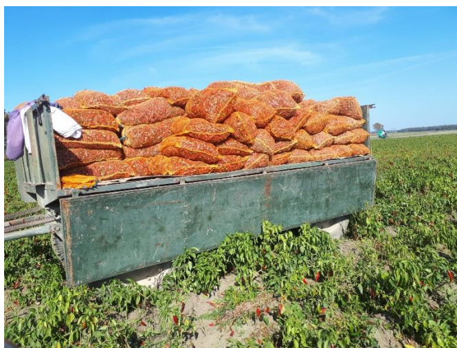
Slika 32. Punjenje vreća za transport paprike do sušara

sunčanom vremenu poslije rose i nikada poslije kiše jer se vlažni plodovi zagrijavaju i mogu uzrokovati jaču pojavu plijesni ili truleži. Berba se obavlja početkom mjeseca rujna i traje mjesec dana. Prilikom berbe, plodovi paprike se pažljivo otkidaju sa grana zajedno sa peteljkom i pazi se da se biljka ne iščupa ili ne ošteti grana. Radnici na licu mjesta otkidaju peteljku sa ploda i te ih polažu u plastične kante. Kasnije se odnose na uvratine te se pretresaju u mrežaste vreće (Slika 32). Berba u jednom navratu traje 7-8 dana odnosno dok se sušare potpuno ne napune.