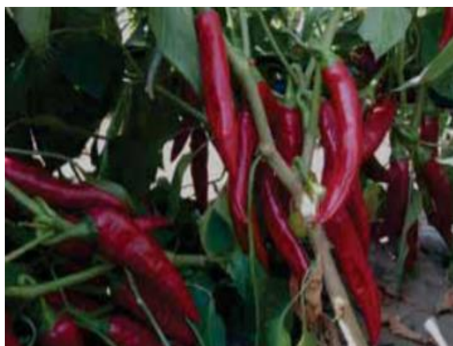
Slika 23. Bolero F1

Bolero F1 je slatka paprika koja je također pogodna uzgoju na otvorenom polju. Kontinuirano raste i sadržaj boje prilikom berbe iznosi 180 – 200 ASTA (American Spice Trade Association), dok nakon sazrijevanja bude nešto veći od 300 – 360. Nakon berbe i sušenja se tek uočava nešto tamno crvenija boja ploda. Preporuka sjemenske kuće je uzgoj 6 – 7,5 biljaka po m 2 tj. 60 000 – 75 000 biljaka/ha.