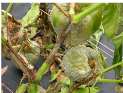
Slika 14. Phytophthora capsici

Phytophthora capsici je uzročnik polijeganja presadnica, truleži korijena, vrata korijena i plodova paprike. Ukoliko do zaraze dođe iz tla nakon presađivanja tada se simptomi javljaju u zoni korijenova vrata (pojava smeđe boje, nekroze i vlažne truleži kore) i biljke venu i suše se. Ako se bolest pojavi u pazušcima lista ili grane tada odumiru dijelovi biljaka koji se nalaze iznad. Zaraza na paprici se može izvršiti direktno ili preko peteljke lista ili ploda. Simptomi na listu su vidljivi u obliku nekrotičnih pjega gdje se pojavljuje micelij za vrijeme vlažnog vremena. Ukoliko nakon zaraze nastupi vlažno vrijeme tada nastaje vodenasta pjega koja se vrlo brzo širi i zahvaća veći dio ploda a na njoj se nalazi bijela masa micelija i spora. Gljiva prezimi u zaraženim biljnim ostatcima ili slobodno u tlu bez biljke domaćina i razmnožava se na temperaturama od 10 do 35 °C uz prisutnost vode.