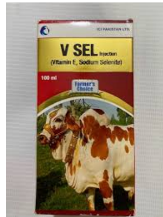
Slika 3: Izgled pakiranja natrijev selenita – dodatka selena u hranidbi goveda