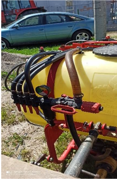
Slika 5. Regulator tlaka sa manometrom