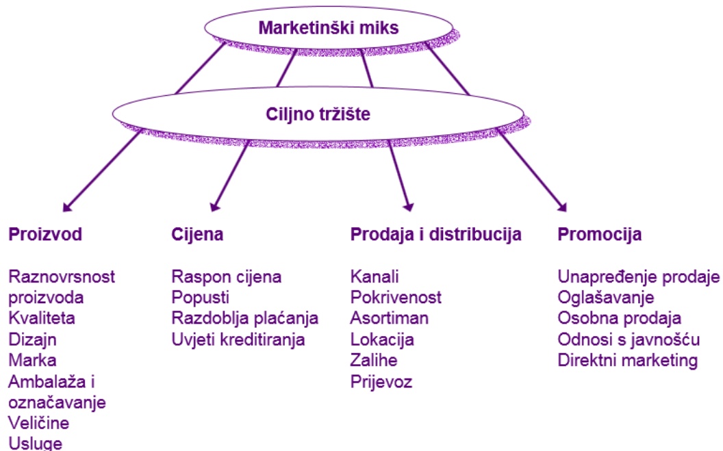
Slika6. Konceptija marketing miksa

Pod pojmom marketinški miks podrazumijeva se specifična kombinacija elemenata koji se koriste za istovremeno postizanje ciljeva poduzeća i zadovoljavanje potreba i želja ciljnih tržišta.