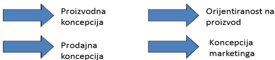
Slika 1. Ključne poslovne orijentacije

1920-ih i 1930-ih razvija se marketing kao posljedica dijeljenja koncepcija menadžementa na distribuciju i prodaju. Razlikujemo nekoliko ključnih poslovnih orijentacija ili koncepcija: Proizvodna, koncepcija proizvoda, prodajna, marketinška i društvena koncepcija marketinga.