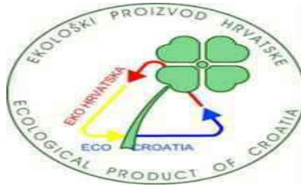
Slika 8. Znak ekološkog proizvoda