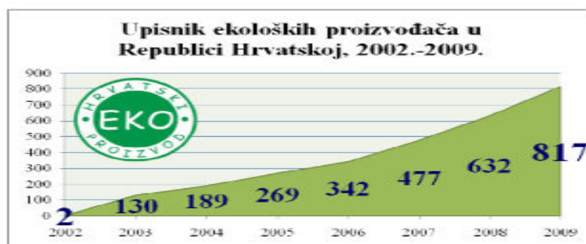
Slika 3. Ekološki proizvođači RH 2002.-2009.

Ekološka proizvodnja definira se kao poseban sustav održivoga gospodarenja u poljoprivredi i šumarstvu koji obuhvaća uzgoj bilja i životinja, proizvodnju hrane, sirovina i prirodnih vlakana te preradu primarnih proizvoda, a uključuje sve ekološki, gospodarski i društveno opravdane proizvodno-tehnološke metode, zahvate i sustave. 10 Najpovoljnije koristi plodnost tla i raspoložive vode, prirodna svojstva biljaka, životinja i krajobraza, povećanje prinosa i otpornosti biljaka s pomoću prirodnih sila i zakona, uz propisanu uporabu gnojiva, sredstava za zaštitu bilja i životinja, sukladno međunarodno usvojenim normama i načelima. Svrha je ekološke proizvodnje zaštita zdravlja i života ljudi, zaštita prirode i okoliša te zaštita potrošača.