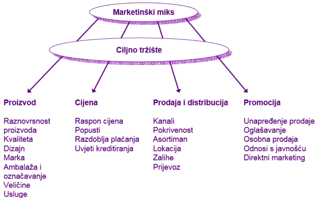
Slika6. Konceptija marketing miksa

Pod pojmom marketinški miks podrazumijeva se specifična kombinacija elemenata koji se koriste za istovremeno postizanje ciljeva poduzeća i zadovoljavanje potreba i želja ciljnih tržišta.