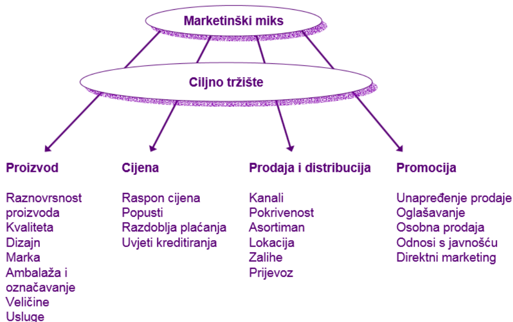
Slika6. Konceptija marketing miksa

Pod pojmom marketinški miks podrazumijeva se specifična kombinacija elemenata koji se koriste za istovremeno postizanje ciljeva poduzeća i zadovoljavanje potreba i želja ciljnih tržišta.