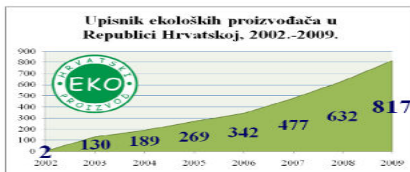
Slika 3. Ekološki proizvođači RH 2002.-2009.

Ekološka proizvodnja definira se kao poseban sustav održivoga gospodarenja u poljoprivredi i šumarstvu koji obuhvaća uzgoj bilja i životinja, proizvodnju hrane, sirovina i prirodnih vlakana te preradu primarnih proizvoda, a uključuje sve ekološki, gospodarski i društveno opravdane proizvodno-tehnološke metode, zahvate i sustave. 10 Najpovoljnije koristi plodnost tla i raspoložive vode, prirodna svojstva biljaka, životinja i krajobraza, povećanje prinosa i otpornosti biljaka s pomoću prirodnih sila i zakona, uz propisanu uporabu gnojiva, sredstava za zaštitu bilja i životinja, sukladno međunarodno usvojenim normama i načelima. Svrha je ekološke proizvodnje zaštita zdravlja i života ljudi, zaštita prirode i okoliša te zaštita potrošača.