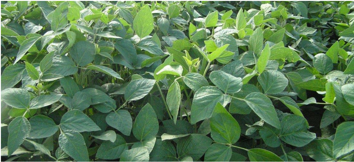
Slika 3. Listovi soje

većine sorata. Listovi kod nekih kasnih sorata zadržavaju zelenu boju i ne otpadaju. To je posljedica sortnog svojstva ili oboljenja od virusa.