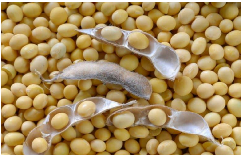
Slika 5. Plod (mahuna) soje