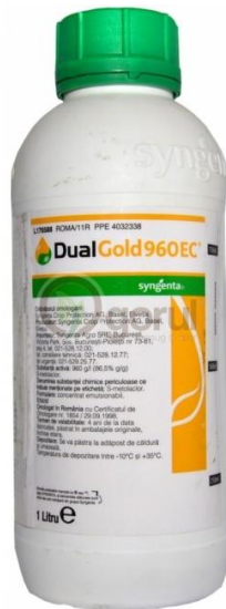
Slika 11. Dual Gold 960 EC herbicid