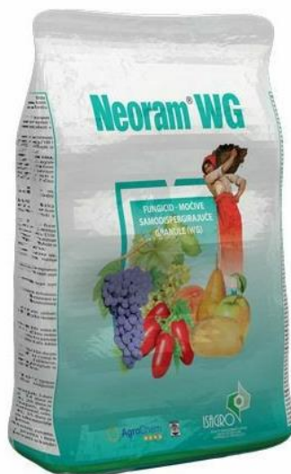
Slika 12. Fungicid Neoram WG

Fungicid (Slika 12.) se primjenjuje u slučaju jačeg napada plamenjače (Pospišil, 2010.)