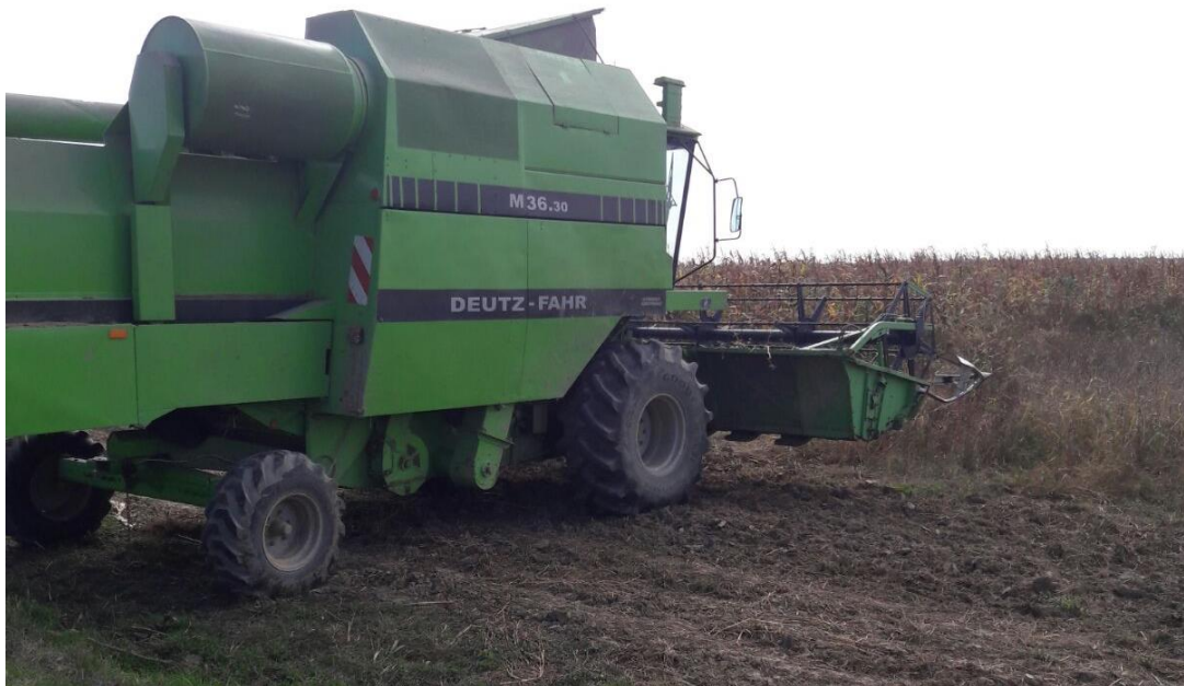
Slika 13. Kombajn Deutz Fahr M36.30

Žetvi soje treba posvetiti punu pažnju. Vrijeme žetve ovisi o duljini vegetacije soje, ali najčešće se obavlja u drugoj polovici rujna. Početak žetve treba planirati kad je vlaga zrna 14-16 %, a za čuvanje soje bez sušenja vlaga mora biti 13 % (Pospišil, 2010.). Žetva se obavlja kad je sjeme u gornjim mahunama u punoj zrelosti. Obavlja se žitnim kombajnom (Slika 13.). Brzina kretanja kombajna iznosi do 5 km/sat, a broj okretaja bubnja od 600-800/min. Prinosi soje na plodnim tlima uz pravilnu agrotehniku mogu biti i do 4,5 t/ha, a najčešće su 2,5-3,5 t/ha.