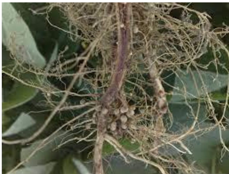
Slika 2. Korijen soje