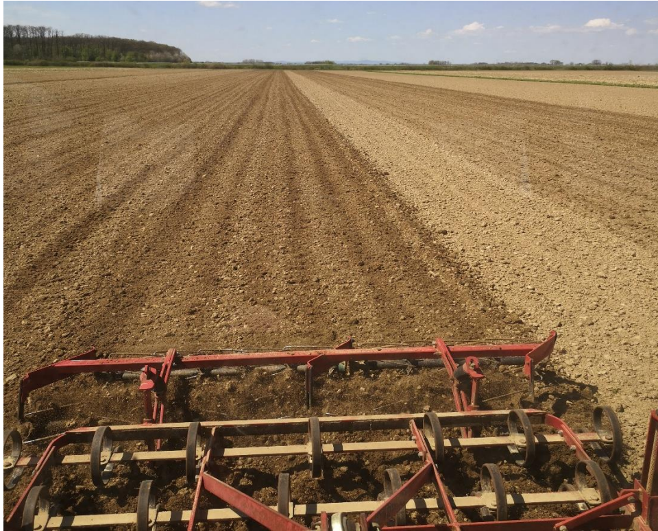
Slika 6. Predsjetvena priprema tla sjetvospremač IMT