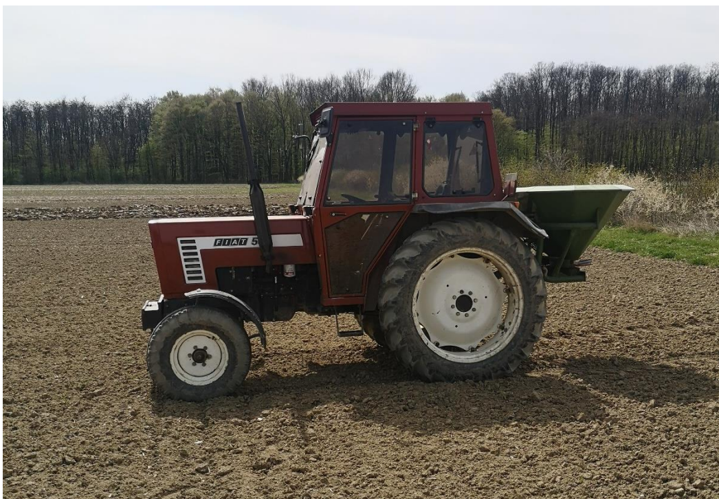
Slika 8. Fiat 566