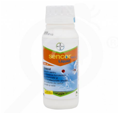
Slika 10. Sencor SC 600 herbicid