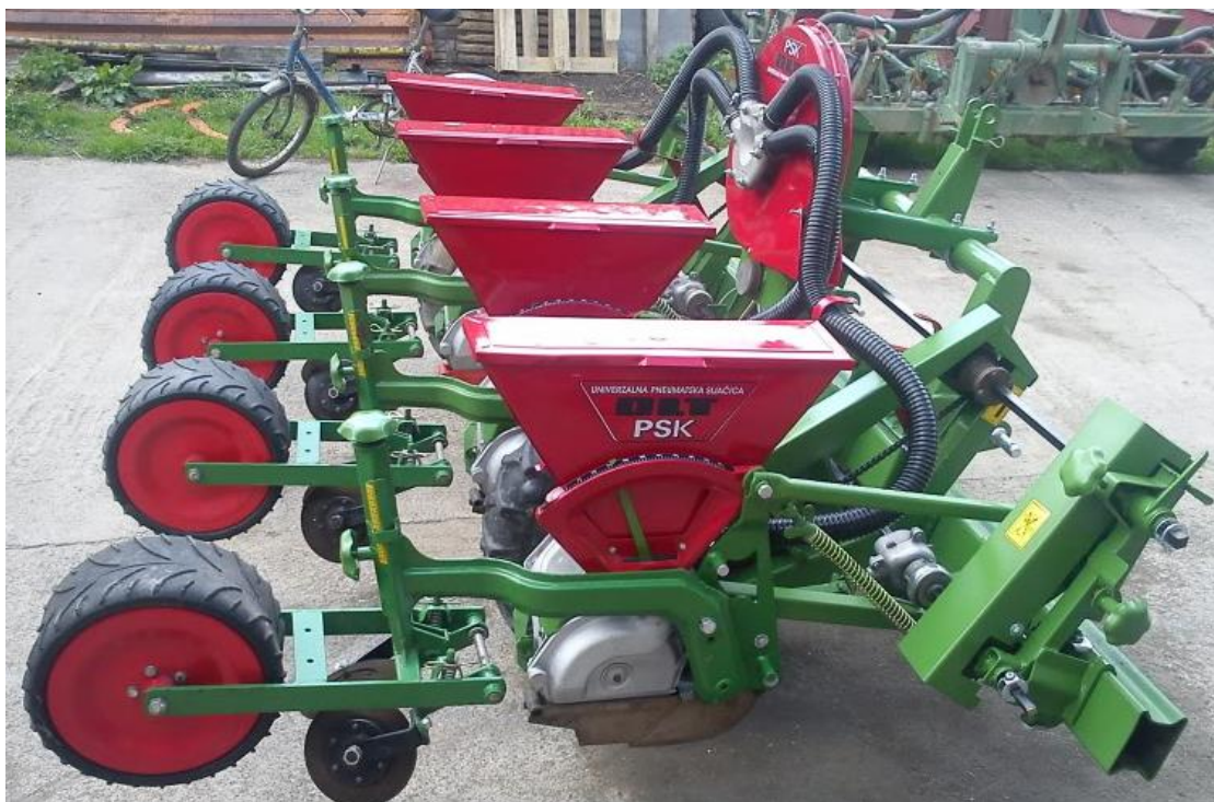
Slika 9. Sijačica OLT PSK