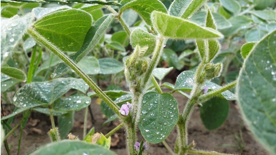
Slika 4. Cvijet i stabljika soje