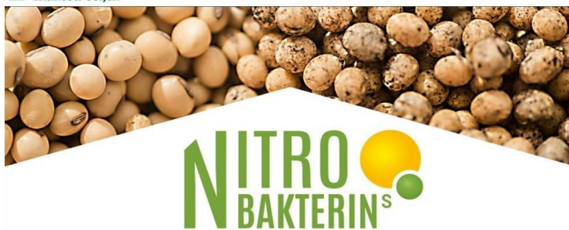
Slika 7. Nitrobakterin