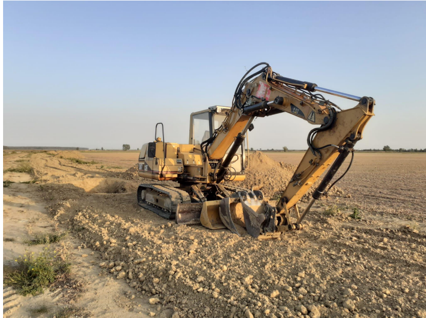
Slika 5. Radovi na razvođenju vode za potrebe navodnjavanja