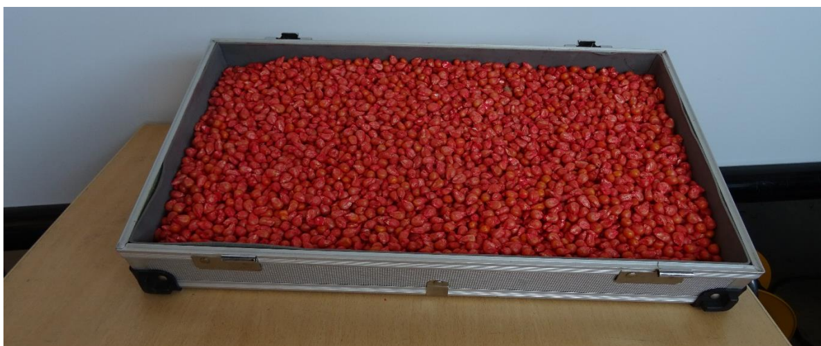
Slika 5. Sjeme KWS hibrida Konfites