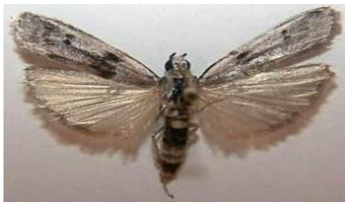
Slika 7. Brašneni moljac ( Anagasta kuehniella Zell.)

Leptir ima sivkasta krila s crvenim prugama raspona 22-25 mm (slika 7.). Gusjenice se hrane prvenstveno brašnom i sličnim proizvodima, a zapredaju ih u veće hrpe. Tijekom jednog dana može tridesetak gusjenica zapresti 1 kg brašna. Zapredene hrpice brašna mogu začepiti cijevi i strojeve u mlinovima.