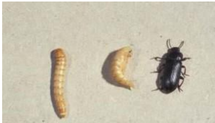
Slika 5. Veliki brašnar ( Tenebrio molitor L.)

Najveći je štetni kornjaš u našim skladištima (slika 5.). Tijelo mu je crne boje dužine 12-17 mm. Hrani se brašnom i brašnеним proizvodima, no nalazi se i u žitu, mliječnim proizvodima i mesu. Čini veće štete i na ambalaži i raznim drvenim dijelovima koje ličinke mogu pregristi. Ličinke su duže od odraslih. Odrasli žive 10-20 mjeseci i oni prezimljuju. Razvoj duže traje na nižim temperaturama. Zimi se razvoj prekida. Postoji jedna generacija tijekom godine.