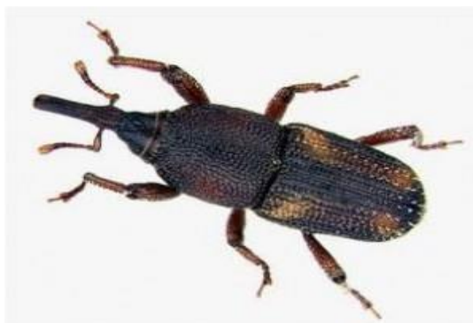
Slika 2. Rižin žižak ( Sitophilus oryzae L.)

Također je česta vrsta u silosima i drugim velikim skladištima. Ima veće potrebe za toplinom, pa se bolje razvija u velikoj gomili zrnja. Hrani se sličnom hranom kao i žitni žižak, ali i zrnjem uljarica, te većim brojem drugih prehrambenih proizvoda. Iako ne predstavlja nekakvu prijetnju za ljudsko zdravlje, ovaj žižak može uzrokovati ogromne gubitke hrane jer ga nalazimo u velikim količinama u uskladištenim proizvodima poput riže, pšenice, zobi, ječma i slično (slika 2.)