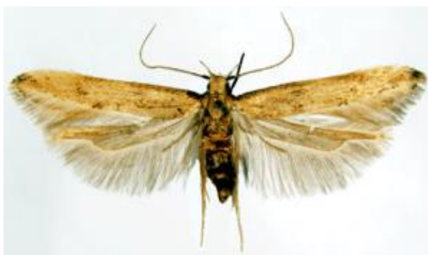
Slika 4. Žitni moljac ( Sitotroga cerealella Oliv.)

Jedna od najčešćih vrsta štetnih leptira u skladištima poljoprivrednih proizvoda (slika 4.). Ima raspon krila 15-18 mm. Odlaze jaja na zrnje žitarica ili u njegovoj blizini, gusjenice se ubušuju u zrno, te se hrane njegovim sadržajem.