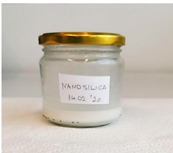
Slika 10. Pripremljena formulacija NanoS

Pripremljena formulacija NanoS čuvana je u staklenki obojanog stakla i držana u tami na sobnoj temperaturi do trenutka primjene.