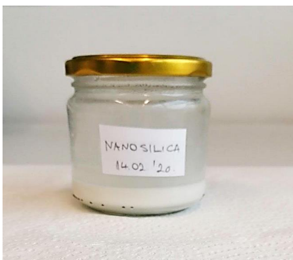
Slika 10. Pripremljena formulacija NanoS

Pripremljena formulacija NanoS čuvana je u staklenki obojanog stakla i držana u tami na sobnoj temperaturi do trenutka primjene.