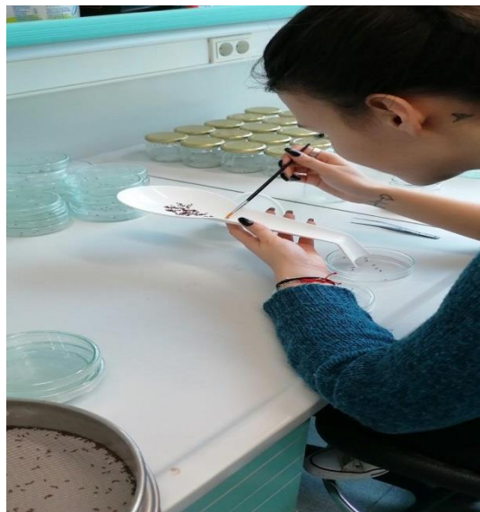
Slika 11. Brojanje odraslih jedinki R. dominica

Korištena je vrsta žitni kukuljičar ( Rhyzopertha dominica Fab.), koja po načinu ishrane pripada primarnim vrstama skladišnih kukaca. Kukci su uzgajani u kontroliranim uvjetima na temperaturi od 24-27 °C i rvz 70±5%, na uzgojnoj podlozi od zrna meke pšenice. Za testiranje i utvrđivanje insekticidne djelotvornosti testirane formulacije NanoS korištene su odrasle jedinke kukaca starosti 2-4 tjedna (slika 11.).