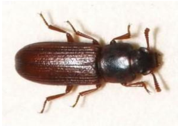
Slika 6. Kestenjasti brašnar ( Tribolium castaneum Herbst)

Najradije napadaju klicu zrna, no napadaju i najrazličitije druge proizvode.