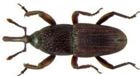
Slika 1. Žitni žižak ( Sitophilus granarius L.)

Najčešća je vrsta u velikim skladištima. Ovaj žižak učestala je štetočina diljem svijeta i poznat je po nanošenju štete pohranjenim žitaricama, pa tako i poljoprivredi generalno jer polaže jajašca u jezgru zrna. Tamnosmeđe je boje, bez pjega na pokrildu (slika 1.). Nema drugi par opnastih krila pa ne može letjeti. Ženka izbuši rupu u cijelom neoštećenom zrnju i u nju odloži jaje, a zatim otvor zatvori sluzastom tvari koja se stvrdne. Ženke polažu oko 150 jaja u jednom ciklusu (prema nekim entomolozima ovisno od uvjeta to može biti od 40 do 250 komada) i to tako da svako jaje bude smješteno u posebno zrno. Ličinke koje se izlegu unutar zrna svoj kompletan razvoj završavaju u tom zrnju.