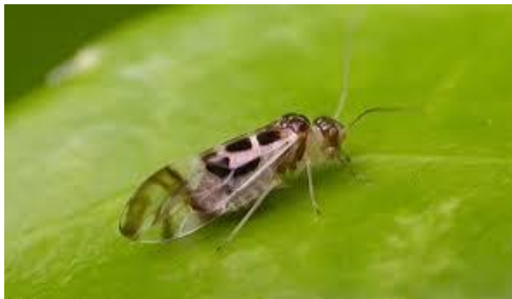
Slika 8. Prašne uši (Psocoptera)

To su sitni, nježne građe kukci, a najveći broj vrsta zabilježen je u prirodi, gdje žive na biljnom materijalu, ispod kore drveća, na otpadu lišća, u gnijezdima ptica i na stočnim otpacima (slika 8.). Prisutne su u povoljnim ekološkim uvjetima životne sredine (visoka relativna vlaga zraka, preko 70%; vlažnost zrnatih proizvoda veća od skladišne - 14-18%, povišena temperatura proizvoda 22-33 0 C i viša). U ovakvim uvjetima dolazi do razvoja mikroorganizama (epifitna mikroflora zrna), raznih vrsta gljivica, plijesni i bakterija, kojima se prašne uši hrane.