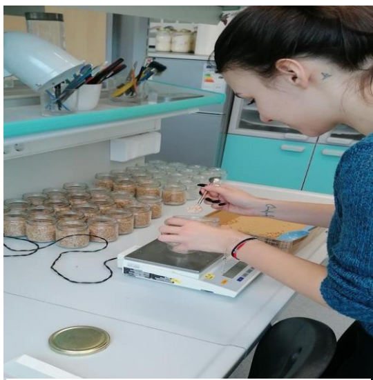
Slika 12. Priprema pšenice i stavljanje u staklene posudice

Kontrolni tretman je postavljen na isti način, ali bez aplikacije formulacije. Svi tretmani su postavljeni u 4 ponavljanja.