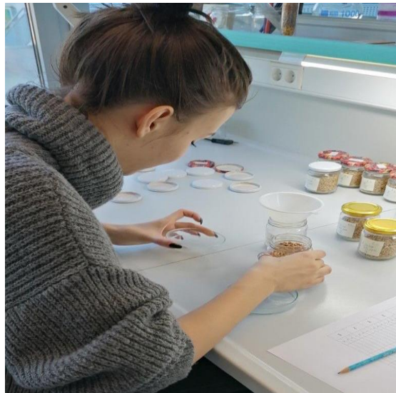
Slika 13. Procjena mortaliteta odraslih jedinki R. dominica