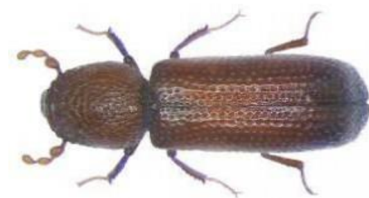
Slika 3. Žitni kukuljičar ( Rhyzopertha dominica Fab.)

Tijelo mu je dugo 2,3-3 mm, tamnosmeđe je boje (slika 3). Vratni štiti potpuno prekriva glavu okrenutu prema dolje. Pokrilje je hrapavo i točkasto udubljeno. Ticala su karakteristične građe; 3 zadnja segmenta tvore kijaču. Ženka odloži 100-500 jaja na razne proizvode. Ličinke oštećuju različite proizvode, a mogu se ubušiti u zrnje žitarica u kojem izgrizaju endosperm. Ličinke žućkaste, povijene, živi unutar zrna.