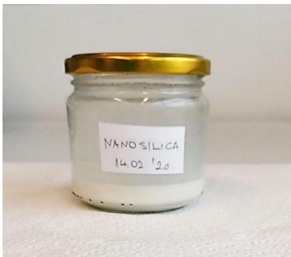
Slika 10. Pripremljena formulacija NanoS

Pripremljena formulacija NanoS čuvana je u staklenki obojanog stakla i držana u tami na sobnoj temperaturi do trenutka primjene.