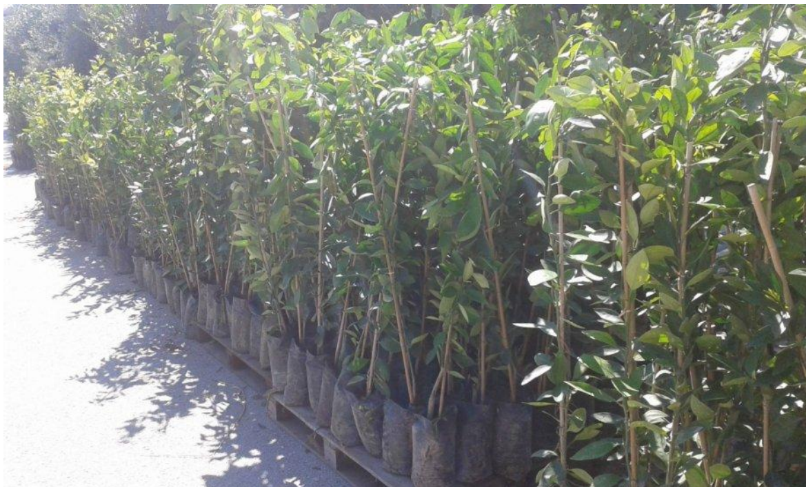
Slika 2. Sadnice mandarina

područjima mogu se saditi početkom jeseni, nakon prvih velikih kiša, a na hladnim i vjetrovitim područjima preporučuje se proljetna sadnja utvrdio je Krpina (2004.)