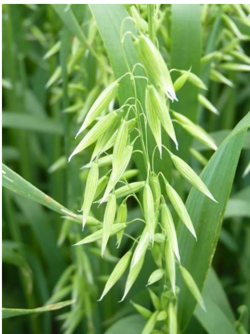
Slika 8. Metlica zobi

Zob je samooplodna kultura, kod koje se oplodnja događa u zatvorenim cvjetovima (Gračan i Todorić, 1990.). Cvat kod zobi je metlica koja se sastoji od glavne grane iz koje se izdvajaju postrane grane te grančice te se jasno razlikuje od ostalih strnih žitarica (Slika 8.). Na krajevima tih grana i grančica se formiraju mali klasići. Ti klasići mogu razviti više cvjetova, ali najčešće razviju dva cvijeta koju su jednako građeni kao i kod drugih strnih žitarica (tri prašnika i tučak) (Gagro, 1997.). Klasići su građeni od dvije pljeve koje obuhvaćaju cijeli klasić te vretenca na kojem se nalaze dijelovi cvijeta.