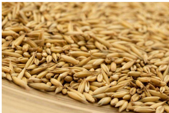
Slika 9. Zrno zobi

Plod zobi je zrno ili pšeno koje je obavijeno pljevicama (Slika 9.). Izduženog je oblika i jasno se razlikuje trbušna i leđna strana na kojoj se nalazi cijelom dužinom izražena brazdica. Pljevice omotavaju zrno, ali nisu srasle s njim, te su obrasle finim gustim dlačicama. Te pljevice mogu biti svijetložute, bjelkaste, smeđe, sive ili crne boje.