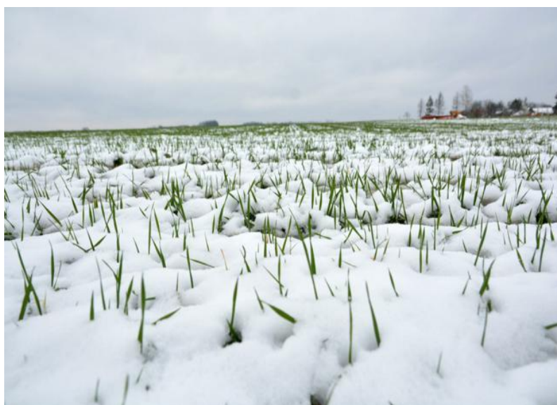
Slika 11. Zob ispod sniježnog pokrivača

Mlade biljke tijekom proljeća mogu podnijeti niske temperature i do – 8 °C. Otpornost na niske temperature ovise o vremenu sjetve, klimatski uvjetima tijekom zimskog i proljetnog perioda, izboru kultivara te o agrotehnici. Stoga je poželjno da tijekom zime imamo snježni pokrivač preko zobi, jer snježni pokrivač služi kao izolator i zaštita zobi od izmrzavanja (Slika 11.).