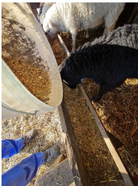
Slika 2. Hranidba ovaca

U svjetskoj proizvodnji žitarica, zob ( Avena sativa L. ) zauzima sedmo mjesto (iza riže, kukuruza, pšenice, ječma, sirka, prosa). Kao lagani koncentrat zob se uglavnom koristi za ishranu svih vrsta domaćih životinja, a naročito povoljno djeluje na vitalnost i druge fiziološke funkcije konja (Mlinar i Pus, 1992.). Zbog svoje dobre probavljivosti, ona se koristi najvećim dijelom za hranidbu konja, krava (zbog povećanja mliječnosti), peradi, ovaca i slično (Slika 2.). Za prehranu domaćih životinja, zob se može koristiti u zelenom stanju (samostalno ili u smjesi sa drugim leguminozama). Slama se također može koristiti u prehrani stoke jer je mekanija i sočnija od ostalih žitarica. Bogata je probavljivim hranjivim tvarima, proteinima, energijom, fosforom i željezom (Naveena i sur., 2021.). U odnosu na ostale žitarice, ova kultura ima najkvalitetnije zrno s aspekta ishrane. Zrno zobi sadrži manje ugljikohidrata, 2 – 3 puta više masti, te bjelančevine koje imaju visoku biološku vrijednost, ali je zato siromašna triptofanom.