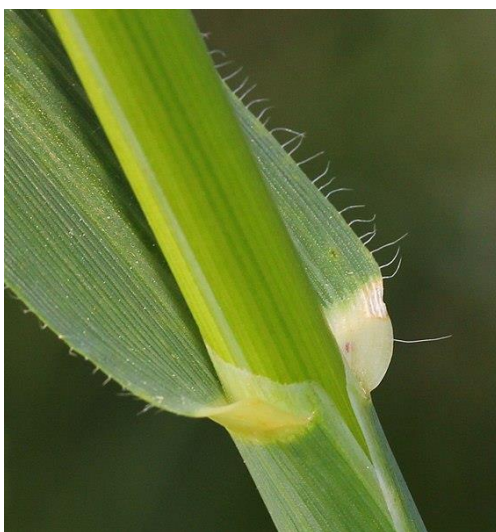
Slika 7. Jezičac/ligula

Rukavac je čvrsto građen te ima zaštitnu ulogu za mladu biljku. Na prijelazu između lisnog rukavca i lisne plojke se nalazi dobro razvijen jezičac (ligula) (Slika 7.). Pomoću dobro razvijene ligule zob se lako razlikuje od ostalih strnih žitarica. Zadatak jezičca je da štiti biljku od prodora vode i mikroorganizama u prostor između rukavca i vlati.