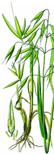
Slika 1. Avena sativa L.

Praroditelj zobi je divlja zob Avena fatua i Avena sterilis , koja se pojavljuje kao korovna vrsta. U davna vremena se uzgajala u planinskim područjima srednje Europe te u sjevernom dijelu Europe. Uzgojno područje je manje nego područje uzgoja ostalih žitarica, a nalazi se između 35 i 36° sjeverne širine te između 30 i 50° južne širine (Gagro, 1997.).