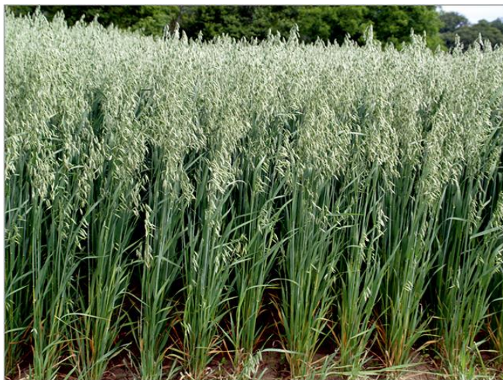
Slika 5. Stabljika zobi

nepovoljnih agroekoloških i agrotehničkih uvjeta. Visina joj se kreće od 60 – 120 cm te je sastavljena od 5 – 6 nodija.