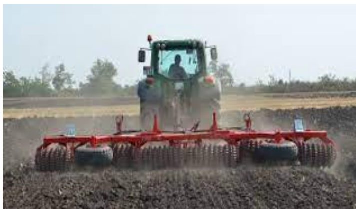
Slika 16. Valjanje usjeva