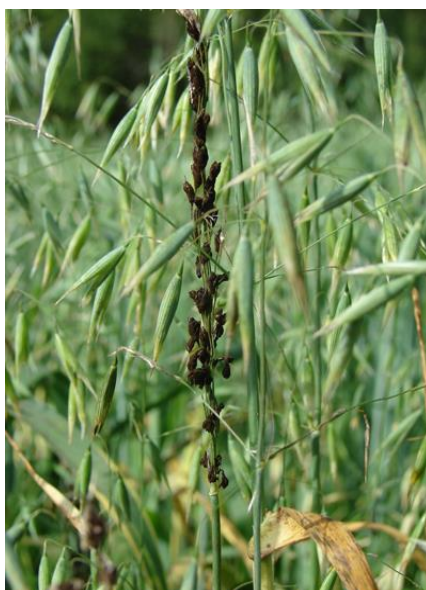
Slika 17. Ustilago avenae

Kod zaštite od bolesti treba voditi računa o plodoredu, jer zob dijeli bolesti sa drugim strnim žitaricama. Najčešća bolest koja se javlja u usjevu je prašna snijet ( Ustilago avenae ) koja može doći ukoliko se koristi sjeme iz vlastite proizvodnje (Slika 17.). Stoga takvo sjeme treba adekvatno tretirati i pripremiti za sjetvu.