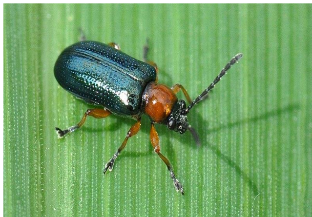
Slika 19. Odrasli oblik žitnog balca