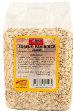
Slika 3. Zobene pahuljice

dosta vlakana koja utječu na bolju probavu kod ljudi, beta – glukan pomaže kod smanjenja kolesterola u krvi, povećava imunitet organizmu. Osim beta – glukana, sadrži još i b – sitosterol koji ima antikancerogena svojstva.