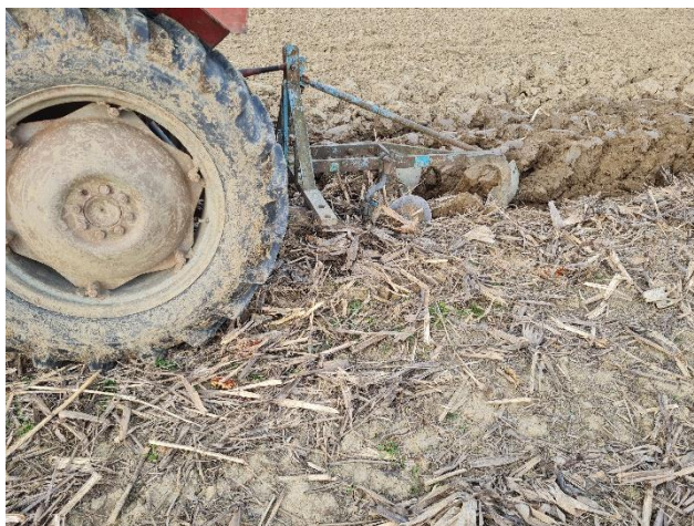
Slika 13. Osnovna obrada tla

Osnovnom obradom se zahvaća sloj tla u kojem se razvija glavčina korijenovog sustava uzgajane biljke. Na našim poljima još uvijek je dominantna osnovna obrada tla plugom (Zimmer i sur., 2014.) (Slika 13.). Prilikom oranja se odsijeca dio cjeline u okomitoj i vodoravnoj ravnini. Odsječeni dio tla – brazda se lomi, mrvli, premješta, te preokreće i odlaže na predhodnu brazdu (Zimmer i sur., 1997.).