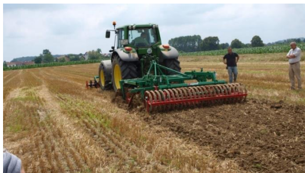
Slika 12. Prašenje strništa

Obrada tla ne ovisi o tome da li je ozima ili jara zob, nego se obavlja prema sastavu, stanju tla te prema predkulturi koja se nalazi na tom tlu. Ako je na površini bila neka rana predkultura tada je potrebno prvo obaviti prašenje strništa, a potom osnovnu obradu tla (Slika 12.).