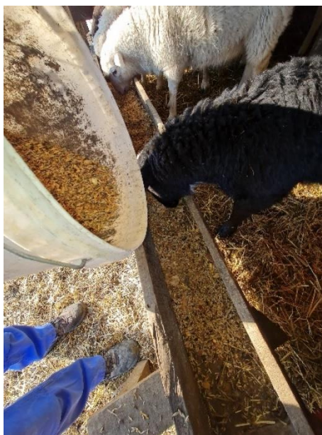
Slika 2. Hranidba ovaca

U svjetskoj proizvodnji žitarica, zob ( Avena sativa L. ) zauzima sedmo mjesto (iza riže, kukuruza, pšenice, ječma, sirka, prosa). Kao lagani koncentrat zob se uglavnom koristi za ishranu svih vrsta domaćih životinja, a naročito povoljno djeluje na vitalnost i druge fiziološke funkcije konja (Mlinar i Pus, 1992.). Zbog svoje dobre probavljivosti, ona se koristi najvećim dijelom za hranidbu konja, krava (zbog povećanja mliječnosti), peradi, ovaca i slično (Slika 2.). Za prehranu domaćih životinja, zob se može koristiti u zelenom stanju (samostalno ili u smjesi sa drugim leguminozama). Slama se također može koristiti u prehrani stoke jer je mekanija i sočnija od ostalih žitarica. Bogata je probavljivim hranjivim tvarima, proteinima, energijom, fosforom i željezom (Naveena i sur., 2021.). U odnosu na ostale žitarice, ova kultura ima najkvalitetnije zrno s aspekta ishrane. Zrno zobi sadrži manje ugljikohidrata, 2 – 3 puta više masti, te bjelančevine koje imaju visoku biološku vrijednost, ali je zato siromašna triptofanom.