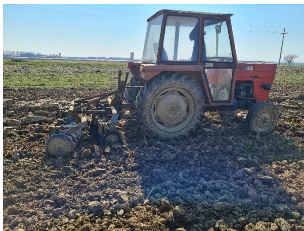
Slika 14. Dopunska obrada tla tanjuračama

Prema Pospišil (2010.), obrada tla tanjuračama, drljačom ili sjetvospremačem stvara usitnjeni i rastresiti površinski sloj koji omogućava kvalitetnu sjetvu te bolje klijanje i nicanje biljaka. Za sjetvu jare zobi, tlo ostaje u zatvorenoj brazdi sve do proljetne sjetve kako bi se sačuvala vlaga.