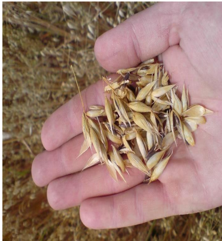
Slika 10. Ozima zob (crna zob)

Na našem uzgojnom području najviše se uzgajaju jare forme (bijela zob). Pored jare forme, nalazi se i ozima forma (crna zob) (Slika 10.).