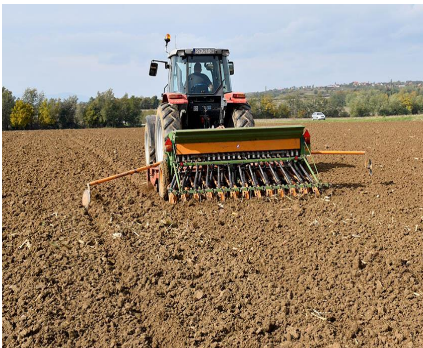
Slika 15. Sjetva zobi žitnom sijačicom

Prema znanstvenom radu i istraživanju Kadam i sur. (2019.) su obavili sjetvu u dva roka. Prvi rok sjetve je obavljen 25.10., a drugi rok je obavljen mjesec dana poslije, 25.11.. S tim ispitivanjem su utvrdili da je ranija sjetva bolja i dobili su veće prinose zelene (36,4 t/ha) i suhe krme (8,0 t/ha), a kasnijom sjetvom, odnosno 25.11. je postignuto 32,9 t/ha zelene krme, a suhe krme 7,1 t/ha.