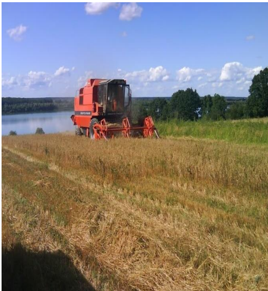
Slika 20. Žetva zobi

Žetva se obavlja univerzalni žitnim kombajnom (Slika 20.). Vлага u zrnu početkom žetve treba biti ispod 20 %. Da bi se zrno moglo skladištiti, vlaga zrna treba biti ispod 14 %. u našim uvjetima se žetva obavlja u drugoj dekadi srpnja. Prosječni prinosi se kreću oko 3 – 4 t/ha, ali ovisno o sortimentu, klimatskim i agrotehničkim uvjetima, ti prinosi mogu biti puno veći.