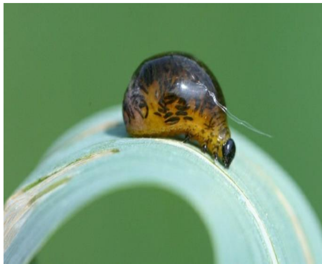
Slika 18. Ličinka žitnog balca

Osim mjere njege zaštite od bolesti i korova, imamo i zaštitu od štetnika. Štetnici djeluju na smanjenje količine prinosa te na smanjenu kvalitetu prinosa zrna. Kod zobi osobitu pažnju treba posvetiti suzbijanju leme ili žitnog balca ( Oulema melanopus L.) koja ukoliko se ne suzbije na vrijeme može uzrokovati velike štete (Pospišil, 2010.). Ličinke su sluzave, žute boje te svojim izgledom podsjećaju na puža (Slika 18.), a odrasli oblik je veličine 4 – 6 mm, tamnoplave do crne boje sa narančasto crvenim nogama i nadvratnim štitom (Slika 19.). Suzbijanje ovog štetnika se obavlja primjenom insekticida protiv ličinki i to kada učimo jednu ličinku po zastavici. To je ujedno i prag odluke za suzbijanje tog štetnika.