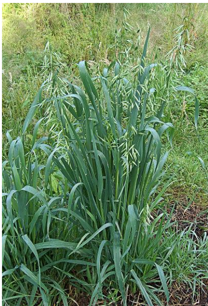
Slika 6. List zobi

stabljici. Takav raspored listova po stabljici omogućuje bolje iskorištenje sunčeve svjetlosti. U početnom porastu, rukavac prelazi duljinu plojke, a kasnije obuhvaća oko 2/3 internodija.